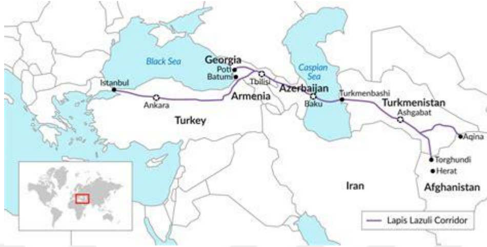
Şekil 1.2 Türkiye'nin Orta Koridor Üzerindeki Konumu ve BTK Hattı