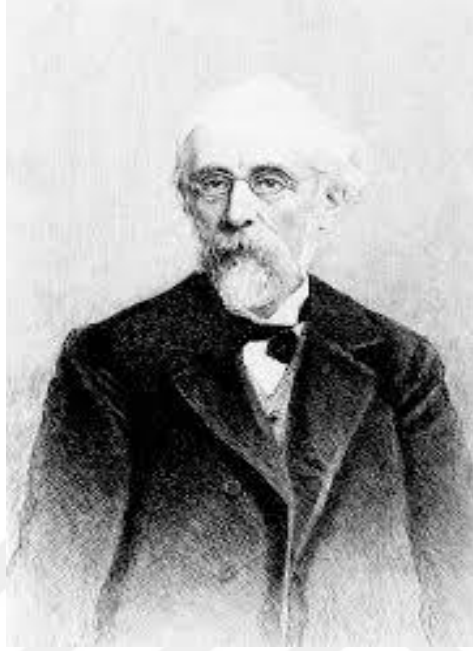
Resim 1: Theodor Nöldeke