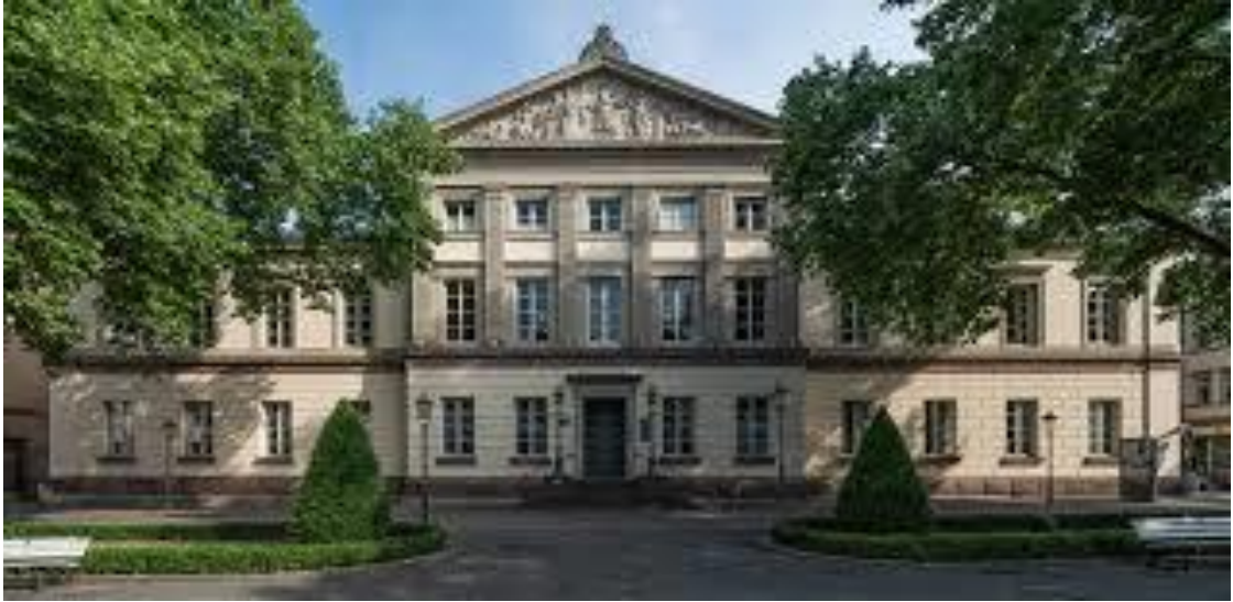
Resim 3: Göttingen Üniversitesi