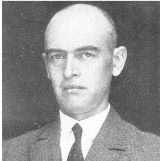
Resim 7: Gotthelf Bergstraesser