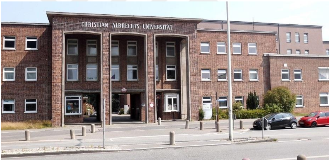
Resim 4: Kiel Üniversitesi- (Christian-Albrecht Universität)