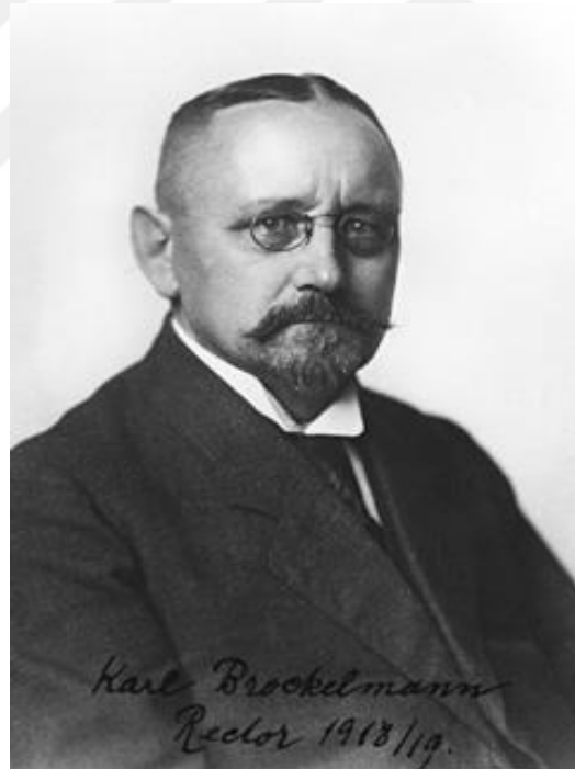
Resim 8: Carl Brockelmann