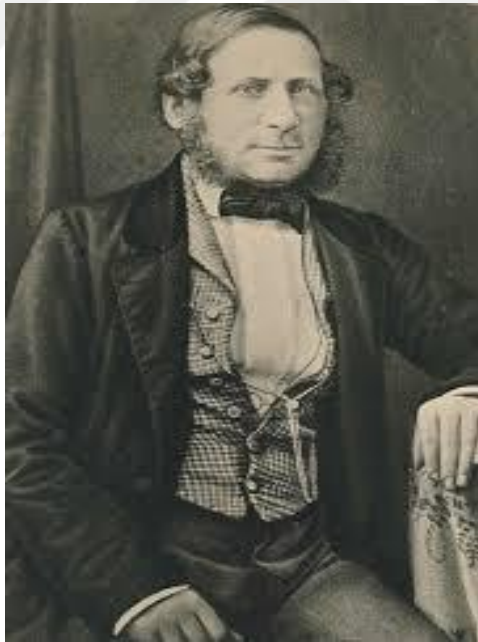
Resim 6: Theodor Benfey