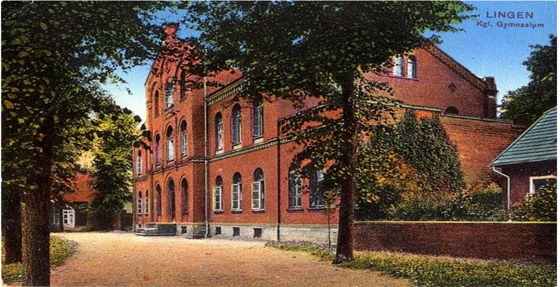
Resim 2: Lingen Lisesi