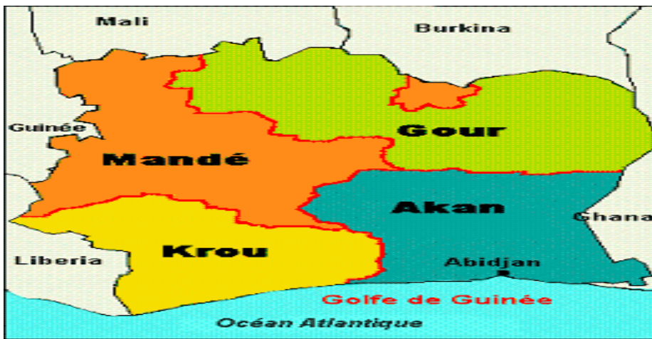
Tableau 186 2 : carte ethnographique de la Côte d'Ivoire en 2000