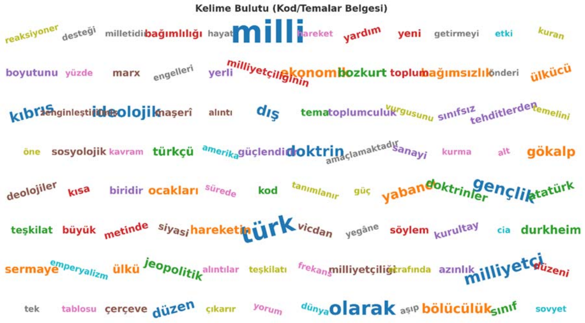
Şekil 3: Kod/Temalar Belgesine Ait Kelime Bulutu

Yukarıdaki görselde ise yapılan içerik analizi sonucunda ortaya çıkan kodların görselleştirilmiş biçimi kelime bulutu ile sunulmuştur. Bu tür görselleştirme, hangi kavramların söylemde baskın olduğunu hızlı ve bütüncül bir şekilde göstermesi bakımından önemlidir. Görselde en yüksek frekansta yer alan “milli”, “Türk”, “doktrin”, “gençlik”, “bağımsızlık” ve “ideolojik” gibi kavramların öne çıkması, milliyetçi söylemin temel eksenlerini açıkça ortaya koymaktadır. Buna karşılık “emperyalizm”, “Kırım”, “bölücülük” ve “jeopolitik” gibi kavramlar ise daha düşük yoğunlukla yer almakla birlikte, dönemin siyasal söylemindeki stratejik öncelikleri yansıtmaktadır.