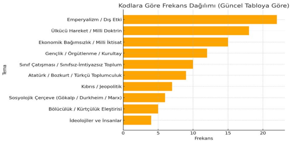
Şekil 1: Kodlara Göre Frekans Dağılımı

Ayrıca aşağıdaki şekilde de belirtildiđi üzere içerik analizi sonucunda ortaya çıkan ana temaların frekanslarını göstermektedir. Analiz sonucuna göre en baskın tema " Atatürk, Türkçülük ve Tarihsel Referanslar " olurken, bunu " Milli Doktrin ve İdeolojik Çerçeve " ile " Ekonomik Milliyetçilik " temaları takip etmektedir. Orta düzeyde " Bağımsızlık ve Anti-Emperyalizm " ile " Anti-Komünizm ve Yabancı İdeolojilerle Mücadele " temalarının öne çıktığı görülmektedir. Daha düşük oranlarla ise " Ülkücü Gençlik ve Kimlik İnşası " ve " Milli Birlik ve Toplumsal Bütünlük " temaları yer almaktadır.