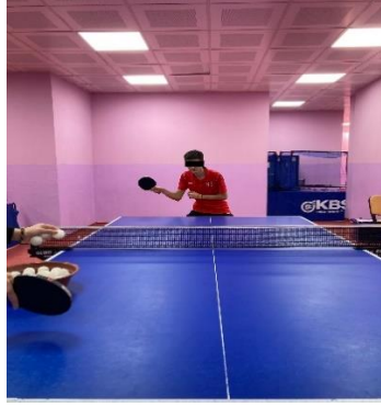
Şekil 5.1. Forehand düz vuruş pozisyonu