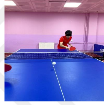
Şekil 5.4. Backhand kesik vuruş pozisyonu