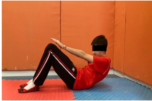
Resim 3.1. Modifiye mekik test ölçümü

Katılımcıların mat üzerinde sırtüstü yatmaları istenmiştir. Dizler bükülü ve ayak tabanları yere temas edecek şekilde bacaklar ise biraz aralık olacak şekilde ölçüm alınmıştır. Uygulayıcı, katılımcının ayağından tutarak, elleri dizinin hizasına gelene kadar vücuduyla hafif öne doğru uzanmasını istemiştir. Uygulayıcı ihtiyaç olması durumunda, elini öğrencinin diz hizasında tutmuş ve katılımcı eliyle antrenörün eline değmeye çalışmıştır. Her doğru uzanışı "1" sayı olarak kaydedilmiştir. Katılımcı başlangıç pozisyonuna dönmediğinde, ayakların yerden teması kesildiğinde veya gerekli uzanma mesafesi sağlanmadığında test sonlandırılmıştır (Winnick ve Short, 2014).