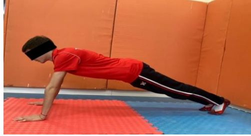
Resim 3.2. İzometrik şınav test ölçümü

çalışmıştır ve vücut pozisyonunun bozulması durumunda test sonlandırılmıştır. Bu pozisyonda kalış süresi saniye olarak kayıt altına alınmıştır. Bel gerginliğinin bozulması, kolda veya dizde bükülme olması durumunda test sona erdirilmiştir. Katılımcılara bir deneme hakkı verilmiştir (Winnick ve Short, 2014).