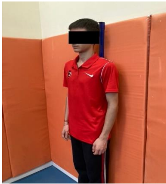
Resim 2.2. Boy uzunluğu Ölçümü

Katılımcıların boy uzunlukları mezura kullanılarak, ölçülmüştür. Ölçüm düz bir zeminde gerçekleştirilmiştir. Katılımcılardan ayakkabıları çıkarılmış şekilde, topuklar bitişik, sırt duvara dönük ve baş karşıya bakacak şekilde dik durmaları istenmiştir. Ölçümler alınırken başlarının üstünde herhangi bir cisim olmamasına dikkat edilmiştir. Sonuçlar metre cinsinden kaydedilmiştir (Tamer, 2000).