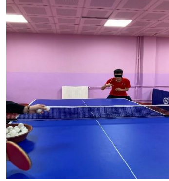
Şekil 5.2. Backhand düz vuruş pozisyonu