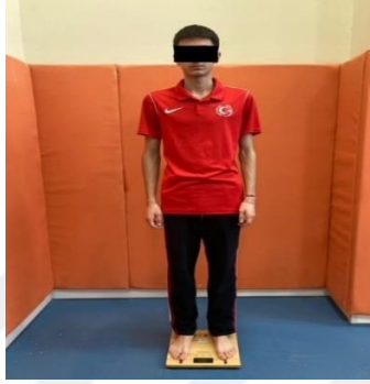
Resim 2.1. Vücut ağırlığı ölçümü

Katılımcıların vücut ağırlıkları taşınabilir bir tartı kullanılarak ölçülmüştür. Ölçümler alınırken katılımcıların vücutlarının dik, ayaklarının çıplak olması ve kolları yanda serbest bırakacak şekilde ölçüm alınmıştır. Ölçüm sırasında katılımcıların üzerindeki metal eşyalarının çıkartılması istenmiştir. Ağırlık ölçümü kilogram cinsinden ölçülmüş ve kaydedilmiştir (Özer, 2013).