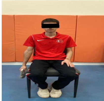
Resim 3.3. Dominant el kavrama test ölçümü

Katılımcı arkası düz olan bir sandalyeye ayakları yere değecek şekilde oturtulmuş, sırtı dik pozisyonda, baş karşıya bakacak şekilde el vücudun yanında ölçüm alınmıştır. Dinamometreyi vücuda temas ettirmemeleri ve dominant kollarını bükmeden dinamometreyi bütün güçleriyle sıkmaları istenmiştir. Ölçüm sonucu kilogram cinsinden kaydedilmiştir. Katılımcıdan, 3 deneme alınmış ve ortanca değer kaydedilmiştir (Winnick ve Short, 2014).