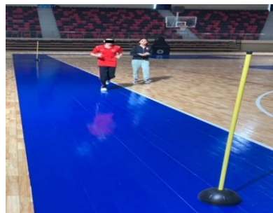
Resim 3.5. 20 m Mekik test ölçümü

Koşu alanı için 20 m uzunluğunda düz bir zemin kullanılmıştır. 20 metrelik aralıkları belirleyen çizgiler katılımcılara tanıtılmıştır. Katılımcı her dakikada tempo artışı yapacak şekilde 20 metrelik mesafeyi gidiş dönüş şeklinde koşmuştur. Katılımcılar 20 metrelik alanın başında ve sonunda bulunan çizgilere sinyal sesi geldiğinde ulaşmak zorunda oldukları söylenmiştir. Katılımcı duyduğu 1. sinyal sesinde koşusuna başlamış, 2. sinyal sesine kadar çizgiye ulaşmaya çalışmıştır. 2. sinyal sesini duyduğunda ise tekrar geri dönerek başlangıç çizgisine dönmüştür. Katılımcılar sinyal seslerine göre koşu tempolarını ayarlamışlardır. Katılımcı sinyal sesinden önce çizgiye ulaşırsa, diğer yöne koşmak için sinyal sesini beklemesi söylenmiştir. Eğer denek koşu temposunu yakalayamadığında ve İki sinyali üst üste kaçırmış ise test sonlandırılmıştır. Tamamladığı koşu sayısı puan olarak kaydedilmiştir (Winnick ve Short, 2014).