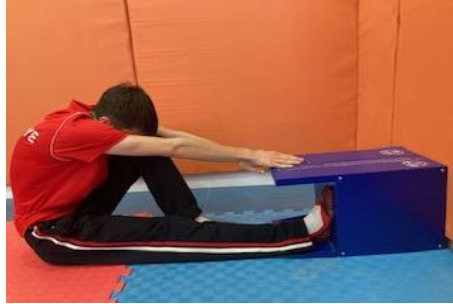
Resim 3.4. Otur - eriş test ölçümü

uzanmada ulaşabildiği en üst noktada pozisyonunu 1 sn. süre ile koruması istenmiştir. Sonra diğer ayak için aynı pozisyon uygulanmış ve katılımcıya, 1 deneme verilmiştir. Sağ ve sol bacak için sonuç cm cinsinden kaydedilmiştir (Winnick ve Short, 2014).