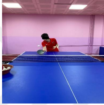
Şekil 5.3. Forehand kesik vuruş pozisyonu