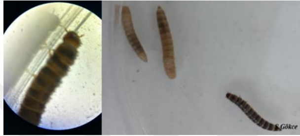
Şekil 2. 2. Denemelerde kullanılan Alphitobius diaperinus larvasının görüntüsü

Larvalar 4-7 gün içerisinde yumurtadan çıkmakta ve yumurtadan yeni çıkan larvalar beyazdır. Daha sonraki dönemlerde açık sarı-kahverengi ve kahverengiyeye dönmektedirler. Larvaların vücut yapıları yumuşak ve üzerinde ufak tüyler mevcuttur (Şekil 2.2). Larvalarda 6-11 larva dönemi görülmekte ve larvalar yaklaşık olarak 1cm boyutlarına ulaşmaktadır. Larvaların gelişimi için optimum sıcaklık 27°C ve bağıl nem %30-40 arasındadır. Larvalar pupa olmak için ahşap, yalıtım malzemeleri gibi korunaklı alanları tercih etmekte ve pupa evresi sıcaklığa bağlı olarak 4 - 14 gün sürmektedir (Dunford ve Kaufman, 2006; Rumbos vd., 2019).