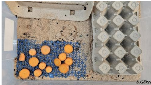
Şekil 2. 3. Denemelerde kullanılan Alphitobius diaperinus kültürünün görüntüsü

Biyolojik testlerde kullanılacak A.diaperinus böcek üretimi Ankara Canlı Yem A.Ş. ticari bir firmadan temin edilmiştir. Böcek kültürlerin devamlılığını sağlamak için un, kepek, mısır unu karışımı kullanılmış ve bu oran sırasıyla 2:1:1 şeklindedir. Ayrıca böceklerin su ihtiyacını karşılamak için elma, havuç gibi besinler besin diskleri halinde ilave edilmiştir. Böcek kültürleri 25°C'de ve %55 nispi nemdeki laboratuvar koşullarında karanlık ortamda saklanmıştır. Bu şekilde yetiştirilen böceklerden elde edilen erginler ayrı bir kaba alınarak yumurtlamaları sağlanmıştır. Böylece yeni larva ve erginler elde edilmiş ve bu ortamdan elde edilen böcekler denemelerde kullanılmıştır (Şekil 2.3).