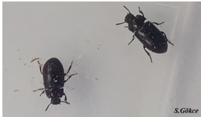
Şekil 2. 1. Denemelerde kullanılan Alphitobius diaperinus ergininin görüntüsü

Bu türün erginleri yaklaşık 7 mm uzunluğundadır. Uzun, oval şekilli vücutları, parlak siyah renktedir. Kısa antenleri, geniş pronotumları ve uzunlukları boyunca sıra sıra küçük delikleri olan elytraları vardır. Elytra üzerinde boyuna çizgiler bulunmaktadır (Şekil 2.1). Baş prognathous'tur, öne doğru uzamış bir biçimdedir. Ağız parçaları ısırıcı çiğneyicidir. Bacak yürüyücü tipte ve bir çift tırnağa sahip olduğu için yüzeylere sıkıca tutunabilmektedir. Ergin bir dişinin yaklaşık 200 ila 400 yumurta bıraktığı, ancak 2000'e kadar yumurta ürettiği bilinmektedir (Rumbos vd., 2019).