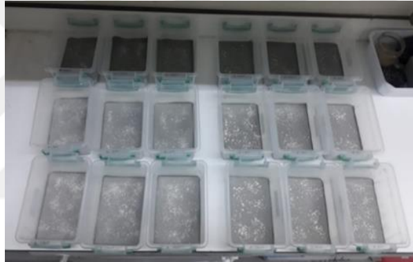
Şekil 2. 5. Detech® ve Silicosec® toz uygulaması yapılan kutuların görüntüsü

Biyolojik testlerde depo ve tavuk kümeslerindeki geniş beton yüzeye uygun bir ortam oluşturmak istenmiştir. Beton yüzeyin pürüzsüz olması için hazır yapıştırma harcı (Kalekim Seramik Yapıştırma Harcı Beyaz C1TE 1052) 0.280 mm çapındaki elekten elenmiş ve 500 g tartılmıştır. Üzerine 160 ml su ilave edilerek homojen bir kıvam elde edilene kadar iyice karıştırılmıştır. Elde edilen karışım 17x12x6 cm ebatlarındaki plastik kutulara dökülmüş ve bir gün bekletilerek kurutulmuştur. Beton yüzeyle kaplanan kutuların kenarlarına sıvı teflon (Polytetrafluoroethylene preparation, PTFE (Teflon®), Sigma Aldrich) çözeltisi şerit halinde sürülerek böceklerin kutuların kenar kısımlarına tırmanması engellenmiştir. Her bir plastik kutudaki beton yüzeye Detech® ve Silicosec® preparatları m 2 'ye 0,25, 0,5, 1, 1,5, 2, 3, 6 ve 9 g toz gelecek şekilde tartılmış ve fırça yardımıyla homojen biçimde dağıtılmıştır (Şekil 2.5). Daha sonra üzerine larva ve erginlerin ağızdan ölmemesi için 0.2 g kepek un karışımı besin olarak konulmuştur.