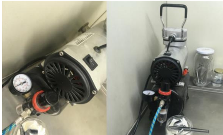
Şekil 2. 7. Biyolojik testlerde yüzey ilaçlaması için kullanılan Airbrush kompresörünün görüntüsü

Çözeltiden pipetle 2 ml alınarak Airbrush kompresörün haznesine konulmuş ve homojen olacak şekilde beton yüzey kaplanmıştır. Yüzey püskürtme uygulamaları için HSENG Airbrush AS18 marka (Ningbo Haosheng Pnömatik Machinery Co., Zhejiang, Çin) kompresör kullanılmıştır (Şekil 2.7).