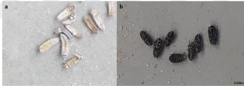
Şekil 2. 9. Denemelerde ölü olarak kabul edilen Alphetobius diaperinus larva (a) ve erginlerinin (b) görüntüsü

Denemeler 3 tekerrürlü olarak yürütülmüştür. Kutuların kapakları kapatılarak 25\pm 1^{\circ}\text{C} sıcaklıkta ve \%55\pm 5 nispi nemdeki inkübatörde karanlık ortamda saklanarak yürütülmüştür. Denemeyi izleyen 1, 3, 5, 7, 9 ve 14. günde yumuşak uçlu fırça yardımı ile ölü larva ve erginler sayılmıştır. Hareket etmeyen böcekler ölü kabul edilmiştir (Şekil 2.9).