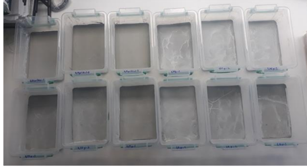
Şekil 2. 8. Yüzey uygulaması yapılan kutuların kuruduktan sonraki görüntüsü

Püskürtme uygulaması yapılan kutular kuruması için 1 gün bekletilmiştir (Şekil 2.8). Daha sonra üzerine böceklerin açlıktan ölmemesi için 0,2 g kepek un karışımı besin olarak ilave edilmiştir. Detech® WP uygulamalarının her birinde 15 adet larva ve ergin kullanılmıştır.