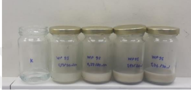
Şekil 2. 6. Hazırlanan Detech® WP 95 sulu çözeltisinin görüntüsü

Beton yüzeyle kaplanan kutuların kenarlarına sıvı teflon (Polytetrafluoroethylene preparation, Merck) çözeltisi şerit halinde sürülerek böceklerin kutuların kenar kısımlarına tırmanması engellenmiştir. Her bir plastik kutudaki beton yüzey için başlangıç dozu olarak 3-6-9 g/m 2 dozu hesaplanmıştır. Bu aşamada sadece Detech® WP 95 preparatı kullanılmıştır. Daha sonra hesaplanan dozlar tartılarak 100 ml cam kavanozlara alınmıştır. Her bir cam şişeye 20 ml saf su eklenmiş ve iyice çalkalanarak çözünmesi sağlanmıştır. Hazırlanan çözeltide bir miktar tortu oluşabileceği için çözelti pipetle alınmadan önce çalkalanmıştır. (Şekil 2.6).