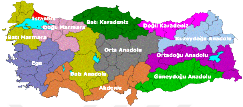
Harita: 4.3. İkinci Düzey 1 Grubunda Yer Alan 12 İstatistiksel Bölge Biriminin Türkiye Üzerindeki Dağılım