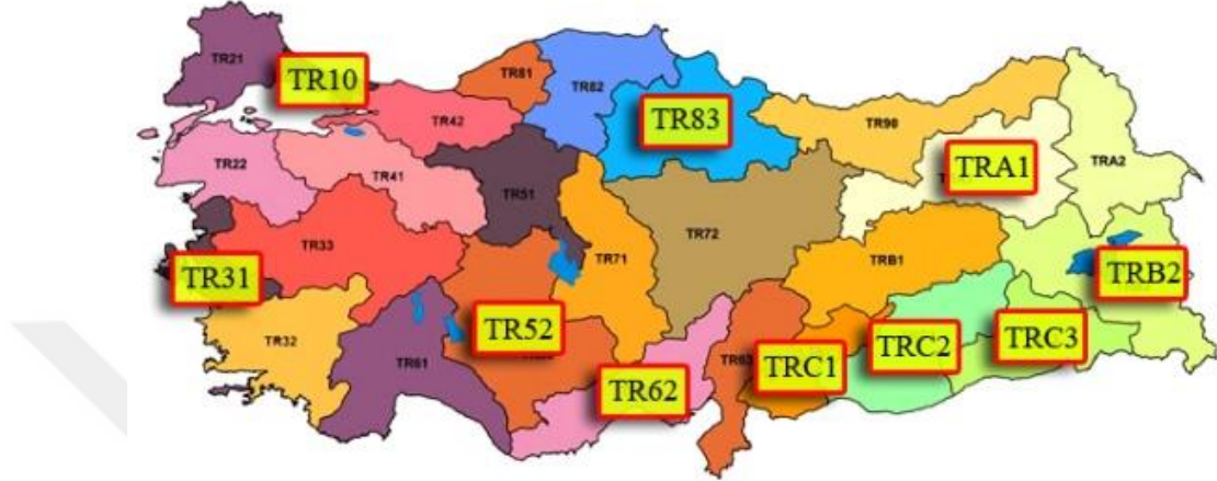
Harita 4.4: Türkiye’de kurulmuş olan Kalkınma Ajansları