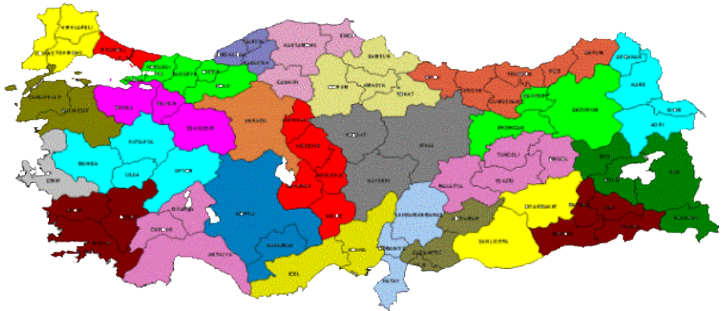
Harita: 4.2. Düzey 2 Grubunda Yer Alan 26 İstatistiksel Bölge Biriminin Türkiye Üzerindeki Dağılımı