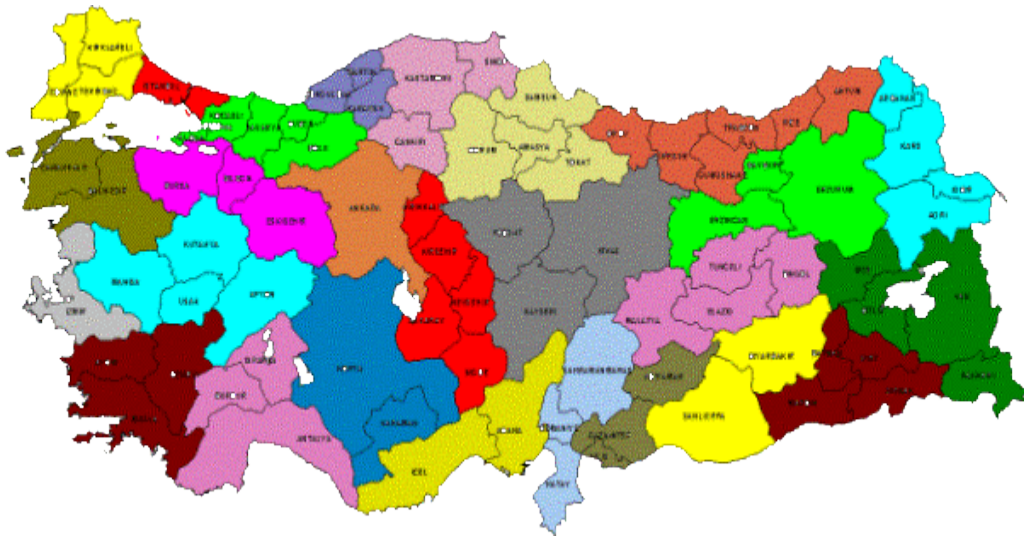
Harita: 4.1. Düzey 2 Grubunda Yer Alan 26 İstatistiksel Bölge Biriminin Türkiye Üzerindeki Dağılımı