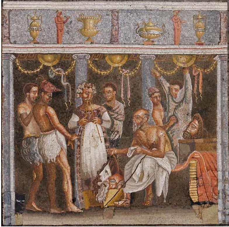
Şekil 2: Antik Roma Mozaïği (Tiyatro Temsili)