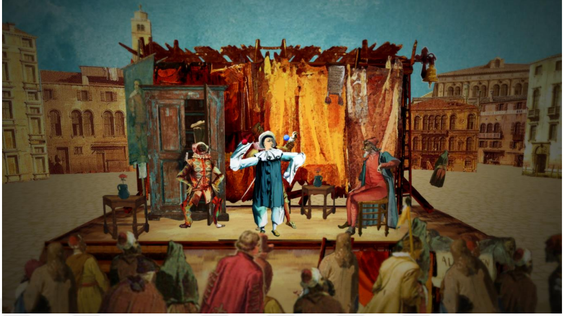
Şekil 4.: Commedia dell'arte Sahne Görseli

Tarihsel sürece bakıldığında ortaçağın sonuna yaklaşıldıkça Hristiyan dininin içinde de fraksiyonlar görülmektedir. Bu anlamda tiyatro seyircisi için en önemli dönüşümü yaratacak olan ve Rönesans'ın gelişini hızlandıran yapı Protestanlık olarak karşımıza çıkmaktadır. Bu yapının gelmesi ile halkta farklı arayışlar ortaya çıkmıştır. Hristiyanlığa farklı bir bakış açısı getirme sürecinde kilise baskısında yapılan dinsel oyunların tam zıttı olarak kendiliğinden ortaya çıkan tiyatro biçimleri olduğunu söylemek mümkündür. Bu türlerden biri Commedia dell'Arte'dır. "Arte komiklerinin, ilk kumpanyalarının 1500'lü yılların ortalarında oluştuğunun, 'doğaçlama', maske ve hayal gücü üzerine kurulu tiyatrolarının tüm Avrupa'ya hakim olduğunun altını çizmek gerekir" (Antonucci, 1995: 37).