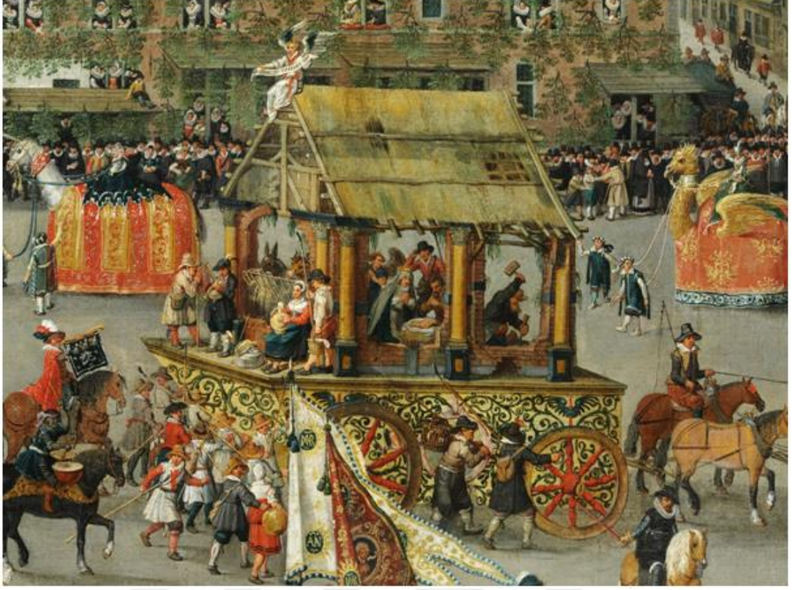
Şekil3: Orta Çağ Dönemi Tekerlekli Sahne