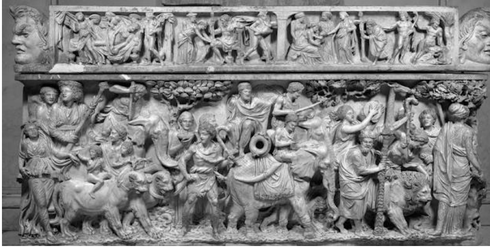
Şekil 1.: Dionysos Şenlik Alayı Lahti (Walters Art Muzesi)