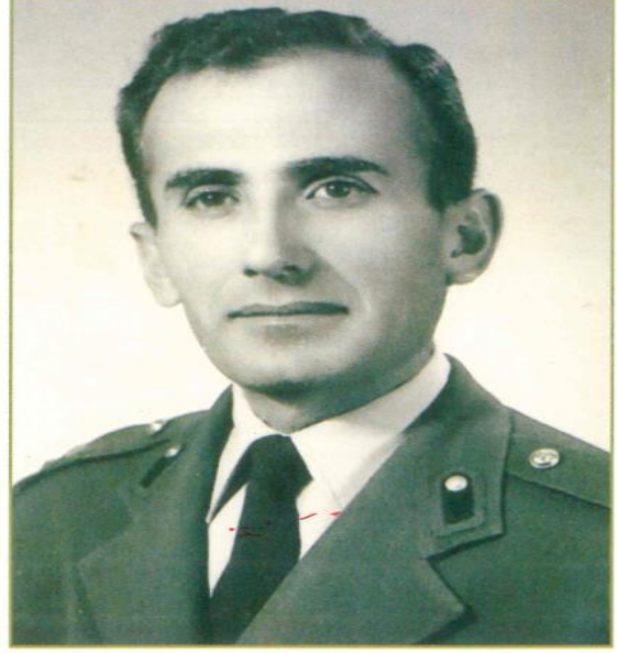
Jandarma Üsteğmen (Roma, 1958)