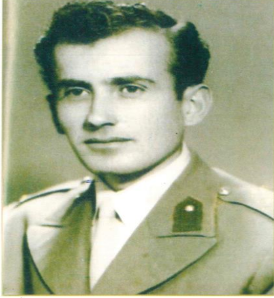
Jandarma Teğmen (1950)