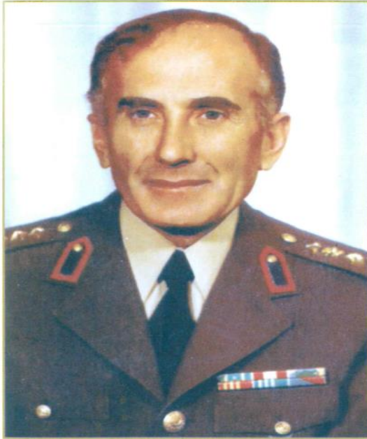
Jandarma Albay (1975)