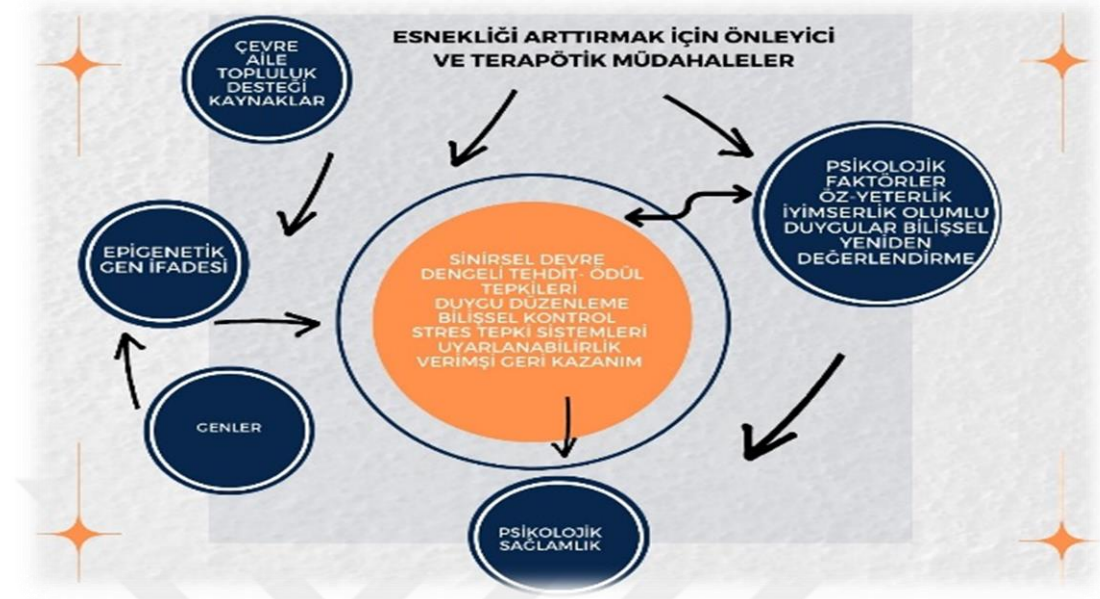
Şekil 1. Biyo-Psikososyal Dayanıklılık Modeli (Feder vd.,2019).

Şekil 1’de belirtilen Biyo-psikososyal esneklik modelinde genlerin, stres tepki sistemlerinin sinirsel devre sistemlerinin daha işlevsel hale gelmesi için çevresel etkilerle etkileşim halinde olduğu görülmektedir. Ayrıca çevresel etkiler genetik yapı üzerinde epigenetik modifikasyonlar aracılığıyla “Nöral” ve “Stres tepki sistemleri” üzerinde kalıcı bir etki oluşturmaktadır. Bu modele göre dayanıklılık, organizmanın olumsuz yaşam deneyimlerinin (kriz, stres kaygı vb.) etkilerini en aza indirmeyi sağlayan ve organizmayı tehditlere karşı koruyan içinde biyolojik süreçleri de içinde barındıran karmaşık ve dinamik yapıdır. Dayanıklılığın özünde, maruz kalınan stres sonrası kendini hızlı ve etkili şekilde toparlama yani psikobiyolojik bir iyi olma durumu söz konusudur (Averill vd., 2018; Feder vd., 2019). Biyo-psikososyal Dayanıklılık Modeline göre beyin devresinin en önemli işlevlerinden biri ödül tepkilerini ve bilişsel kontrolü sağlamaktır. Beyin devresi de iyimserlik esneklik ve bilişsel yeniden değerlendirme kapasiteleri destekleyerek psikolojik sağlamlık temel bileşenlerin temelini oluşturmaktadır.