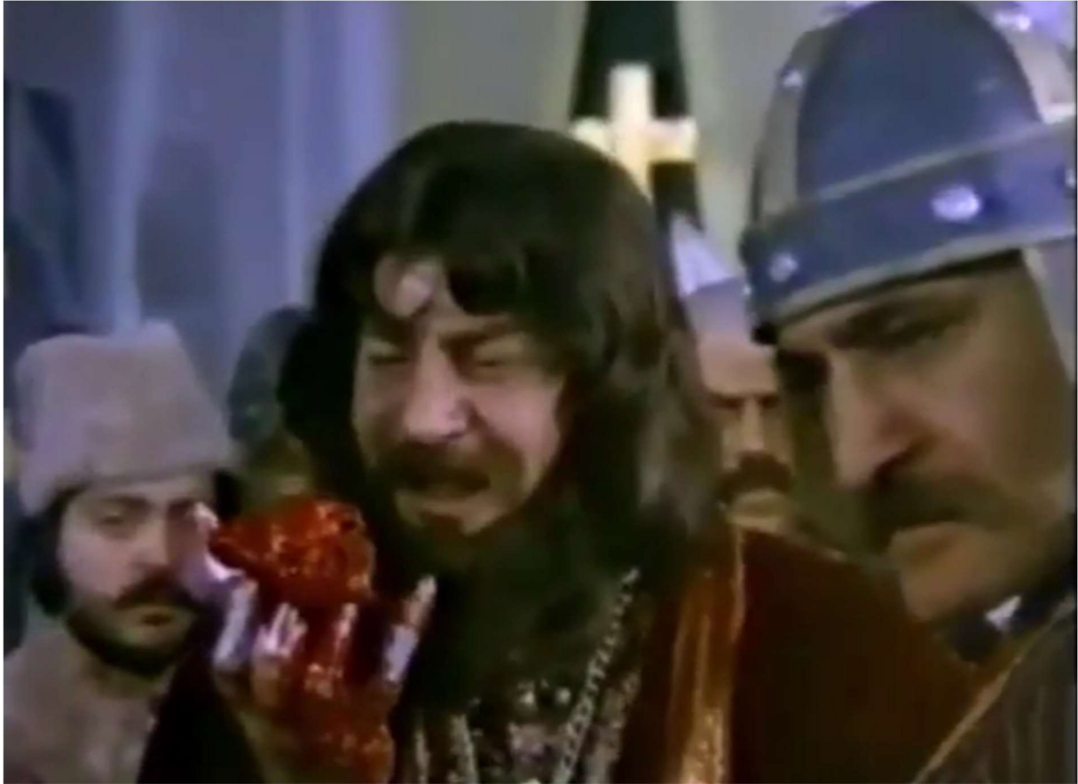
Resim 13: Raspotin

Filmin baş kötü karakteri Rus Raspotin’in bahsi geçen Türk ve Müslüman düşmanlığı, bu karakterin film içindeki görsel sunumundan önce izleyiciyi kötücül bir “öteki”ye hazırlamaktadır. Nitekim, Raspotin, önceki filmlerde görülen kötü Rus karakterlerin hepsinden daha zalim ve vahşi birisi olarak karşımıza çıkar. Parmaklarına yapıştırdığı bıçaklarla Elm Sokağı Kâbusu (1984) filminin baş karakteri Freddie Krueger’ı andıran Raspotin, akli dengesi pek yerinde olmayan vahşi bir Türk düşmanı olarak sunulur.