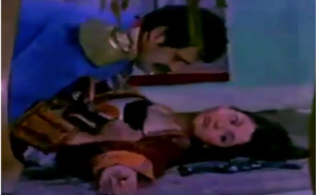
Resim 9: Türk kadının cesedine tecavüz eden General İlyoşin

1968 senesinin bir başka filmi olan ve yönetmenliğini Yavuz Yalınkılıç'ın yaptığı Kafkas Şeytanı Aslan Bey 'de de Hacı Murat (1967) filminde oluşturulan ve devamındaki Dış Türkler konulu tarihi filmlerde kullanılan içerik modeli görülmektedir. Filmde, kötü Rus General İlyoşin'in yüksek miktardaki vergileri ödeyemeyen Kafkas Türklerine yaptığı korkunç muameleler karşısında halkını korumak için mücadeleye girişen kahraman Aslan Bey'in öyküsü anlatılmaktadır. General İlyoşin, daha önceki filmlerde gösterilen Rus karakterlerin hiçbirisinde bulunmayan kötülükte birisidir. Affedip serbest bıraktığını söylediği esirleri arkadan vuracak kadar sözüne güvenilmez ve hain olan İlyoşin, aynı zamanda öldürdüğü bir Türk kadının cansız bedenine tecavüz edecek kadar korkunç bir kişiliğe sahiptir.