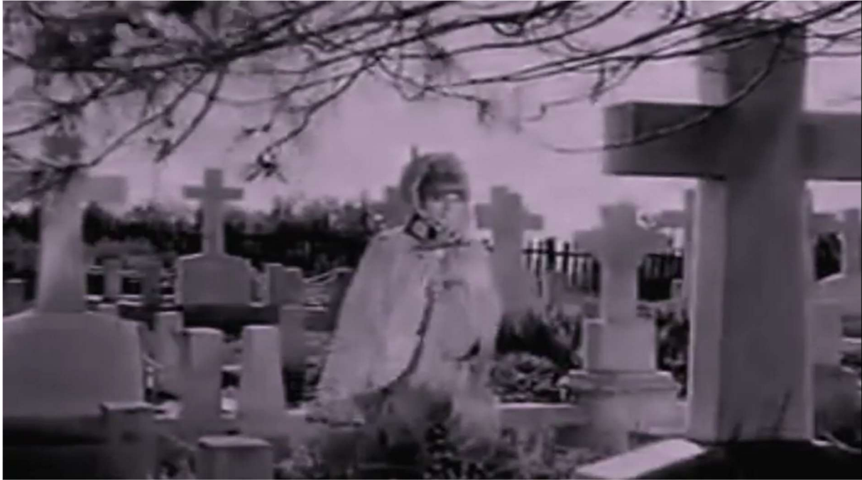
Resim 7: Mezarlıkta dua eden Prenses Maria

Filmde, kolektif kimliğin kültürel unsurlarına da yer verilmek suretiyle Rus ötekinin farklılığı vurgulanmıştır. Daha çok dini kimlik üzerinden yapılan bu vurgu, aşağıda görselleri verilen sahnelerde görüldüğü gibi, farklılıkları izleyiciye hatırlatan sinematik sunumlardır: