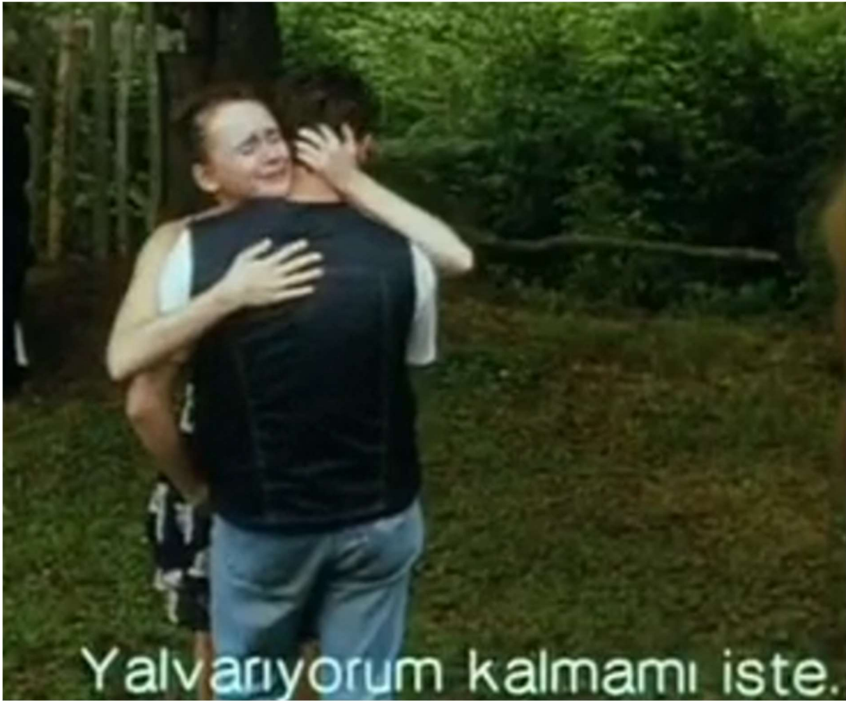
Resim 16: Rus kadın ve kocasının vedalaşması

“Bana gitme de ne olur” diye ağlamaktadır. Ancak kocası, eşine sarılmadan hareketsiz ve sessiz durur. Eşinin para kazanmak için Türkiye’ye gitmesini, yani Nataşalık yapmasını kabullenmiştir. İkinci bir sahnede de tumbul ve neşeli Luba’nın kocası elinde tüfekle otobüsün önünü keser ve Luba’yı otobüsten indirmek ister. Olaya müdahale eden Hasan, adama biraz para vererek “Al bunu, git votka iç” der. Otobüs yoluna devam ederken adam, elindeki para tomarına hazin bir ifadeyle bakıp yere çömelir kalır. Rusya’da yaşanan ekonomik sorunlar sebebiyle eşlerinin para karşılığı fuhuş yapmasını zorunlu olarak kabullenen, paranın gücü karşısında ailenin kutsiyetini bir kenara bırakmak zorunda kalan Rus erkeklerinin dramı, trajik bir şekilde temsil edilir.