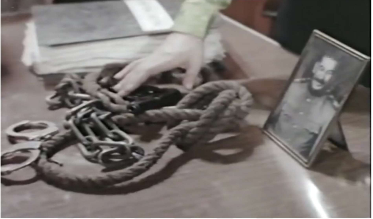
Resim 6: Sovyet gizli polislerinin yemin töreni

Rejimin baskıcı ve zalim yönü, film boyunca sürekli temsil edilmekte ve geçmişe dönüş ( flashback ) sahne ve anlatımlarıyla güçlendirilmektedir. Filmin hikâye akışında, iki ana karakter olan Altunbay'ın babası ve dayısının, Tilda'nın da babası ve iki ağabeyinin rejim düşmanlığı suçlamasıyla kurşuna dizildiği ortaya çıkar. Bu geçmişe dönüşlerin yanı sıra, gizli polisin tutukladığı Azeri Türklerine, her çeşit işkence aletinin olduğu zindanlarda yapılan işkenceler, bir kadın tutsağa Rus askerlerinin tecavüz etmesi, zindanda soğuktan dolayı otların arasına sığınsa da donarak ölen çocuklar gibi sahnelerle Sovyet rejiminin, rejim karşıtlarına uyguladığı zulüm, etnik Rus olmayan Türklere yönelik sistematik bir baskı rejimine dönüştürülerek izleyiciye sunulur. Altunbay'ın şu sözleri de rejimin uyguladığı Türk düşmanlığını onaylamaktadır: