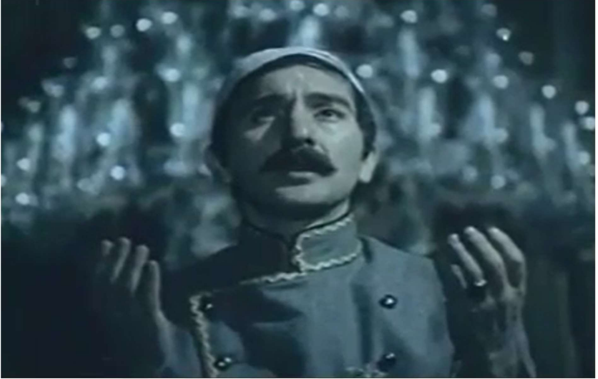
Resim 12: Namaz kılan padişah II. Abdülhamit

Kimlikler üzerinden kurulan ötekilik, düşmanlık ve ötekinin kötü muameleleri ile daha da güçlendirilir. Rusların eline esir düşen Zeynep, Rus kumandanın tacizine uğrar. Kumandana direnince, zindanda çok kötü koşullar altında kalmaya zorlanır. Rusların işgal ettikleri bölgelerdeki Müslümanları esir kamplarına götürme sahneleri ile Rus zulmü teması daha da pekiştirilir. İlerleyen sahnelerde Zeynep'in kocası Ahmet'in aslında ölmediğini ve Seydikof sahte kimliğiyle filmin baş kötü karakteri Prens İgor'un erkanına sızmış bir Osmanlı casusu olduğu ortaya çıkar. Zindandan kurtulan Zeynep ve kocası Ahmet yeniden birbirlerine kavuşur ve Ahmet'e âşık olan Prenses Katyuşka'nın yardımlarıyla Osmanlı topraklarına geri dönerler.