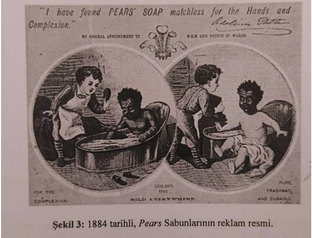
Şekil 3: 1884 tarihli, Pears Sabunlarının reklam resmi.