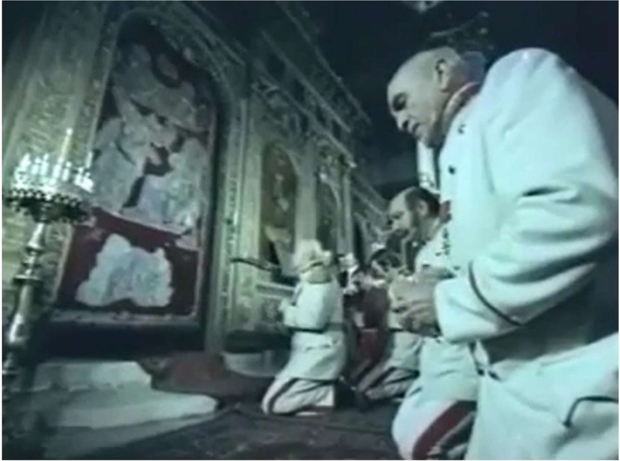
Resim 11: Kilisede dua eden Rus subaylar

Osman Fahir Seden’in yönettiği 1973 yapımı Gazi Kadın adlı film, ana karakterin bir kadın olması ve Dış Türkler teması yerine Rus işgaline uğrayan Doğu Anadolu’daki Türkleri ele alması itibariyle Rus karakterlere yer veren önceki tarihi filmlerden farklıdır. 93 Harbi esnasında cepheye gidip bir daha haber alınamayan kocası Ahmet’i bulmak için zorlu bir yolculuğa çıkan Zeynep’in öyküsünün anlatıldığı filmde, dini semboller üzerinden “biz” ve “öteki” vurgusunun güçlendirildiği kilise ve namaz sahneleri dikkati çekmektedir. Rus subayların kilisede dua ettikleri ve padişah II. Abdülhamit’in namaz kılma sahneleri, izleyiciye dini kimlikler üzerinden karşıtların bir arada anlamlı varlığını gösterir niteliktedir.