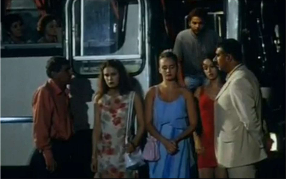
Resim 18: Fuhuş çetesi lideri ve Rus kadınlar