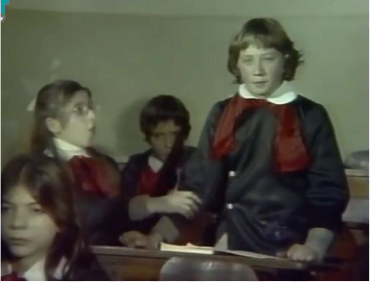
Resim 14: Sovyet rejimini eleştiren Petriç