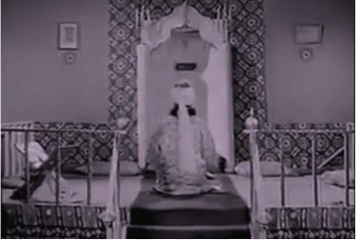
Resim 8: Namaz kılan Şeyh Şamil

Hacı Murat 'ın ardından 1968 senesinde gene Natuk Baytan tarafından çekilen Hacı Murat Geliyor filmi, Rusların temsilleri bağlamında pek çok açıdan ilk filme benzemekle birlikte, bazı farklılıklar da içermektedir. Bir önceki Hacı Murat filmindeki gibi çarlık rejiminin baskıcı ve zalim yönünü simgeleyen Albay İvan ve Teğmen Zorkof gibi askeri karakterlerin Kafkas Türklerine yönelik zulüm, işkence ve nefret söylemlerinin birbiri ardına gösterildiği bu filmde, ilk filmde farklı olarak Rus mağdurlar da vardır. Çarlık rejimine isyan ederek Şeyh Şamil'e sığınan muhalif General Pavlovic ve oğlu Mişel ve kızı Nadya, Çara muhalif bir grubun lideri olan meyhaneci Petro gibi karakterlerin bulunduğu film, ilk filmdekinin aksine çarlık rejiminin baskıcı uygulamalarından sadece Türklerin değil etnik Rusların da rahatsız olduğunu simgelemektedir. Nitekim, filmin kötü karakterleri olan Rus subayların Türklere olduğu kadar bu muhalif Ruslara da infazlar, tutuklamalar ve işkenceler gibi kötü muameleler ettiği görülmektedir. Dolayısıyla bu filmde, "Moskof" yani kötücül öteki Rus'un temsilinde önemli bir ayrışma gözlenmektedir. Rus rejimini temsil eden Moskofların yanı sıra gene rejimin askeri bürokrasisinin içinden çıkma General Pavlovic gibi, haksızlıklara karşı sessiz kalamayan Ruslar da var olabilmektedir. Bunun yanı sıra Nadya,