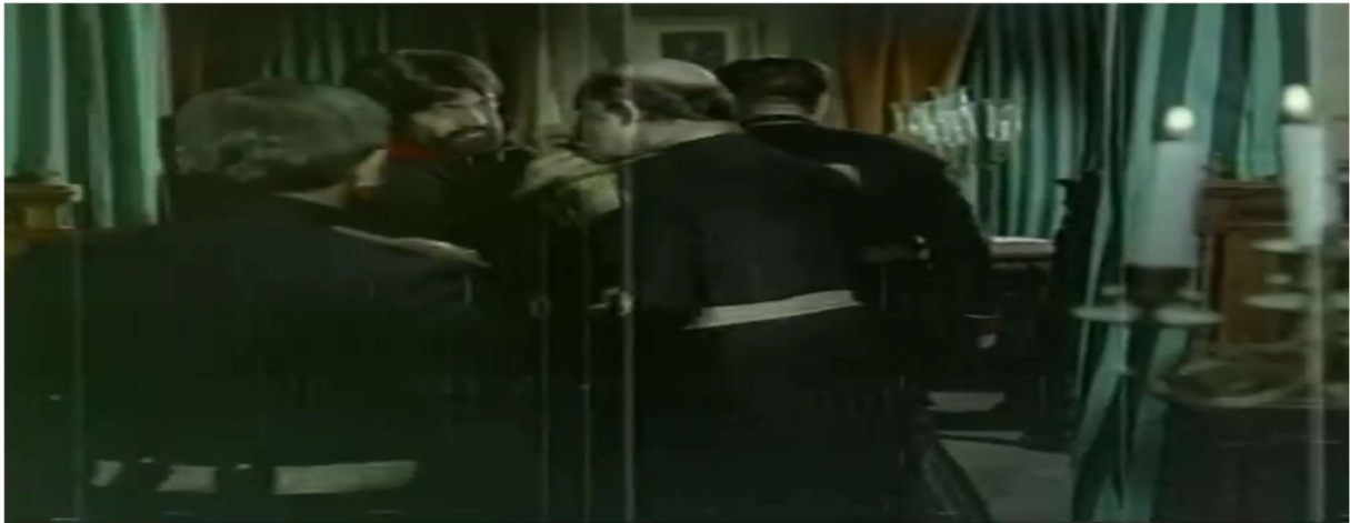
Resim 10: Ortodoks rahibinin elini öpen Rus subaylar