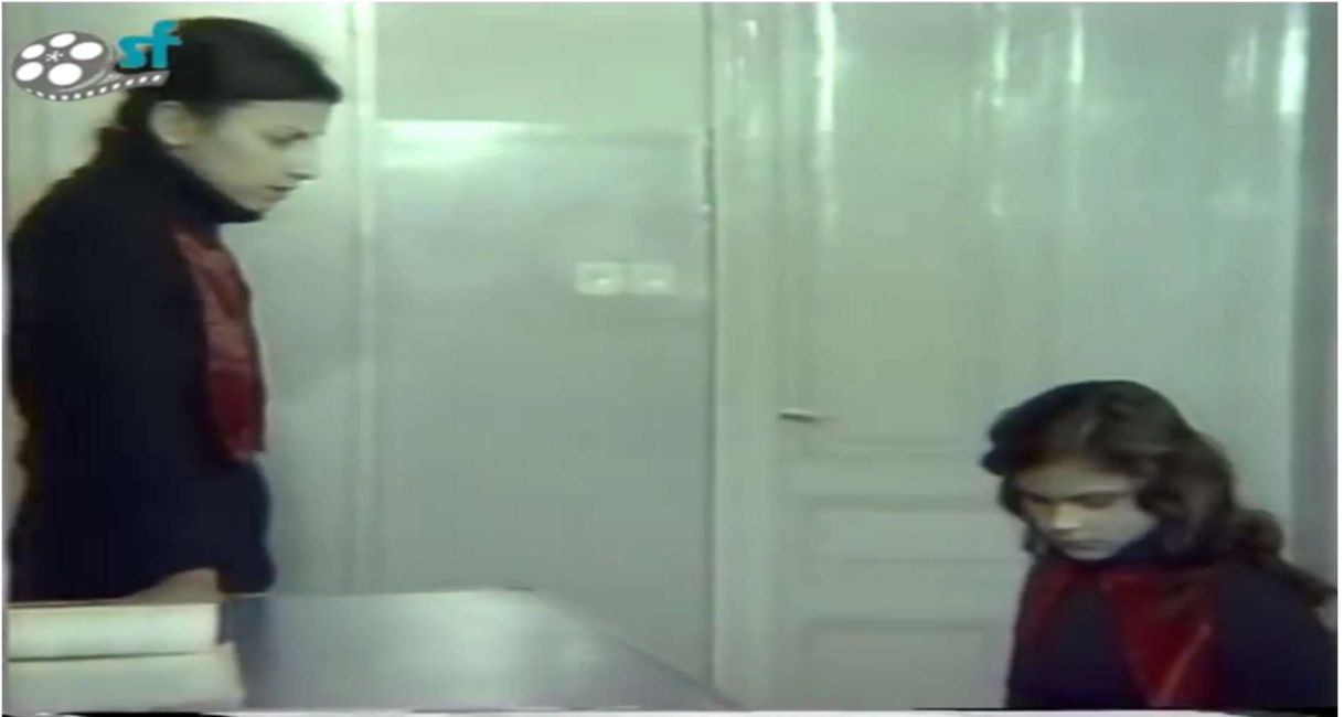
Resim 15: Olgana ve öğretmeni