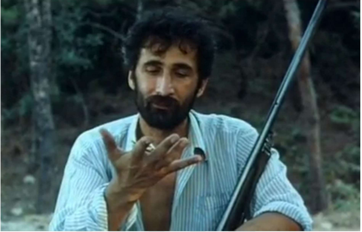
Resim 17: Luba'nın kocası