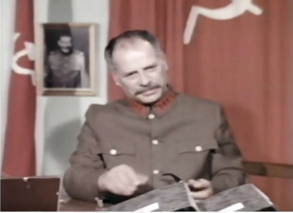
Resim 3: Büyük Şef Mişel, arka planda Stalin portresi ve orak/çekiçli bayrak