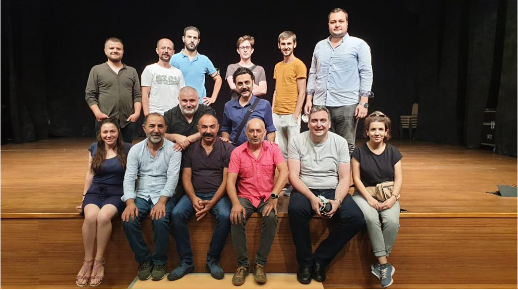
Görsel 6: Sahne 9 Ekip Toplu Çekim