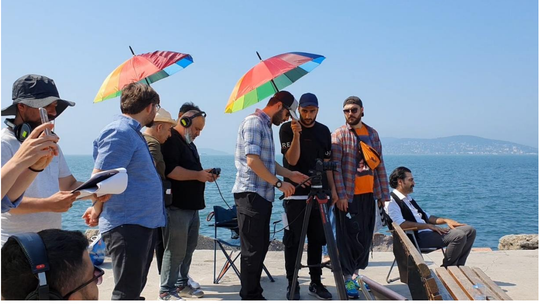
Görsel 5: Sahne 16 Prova