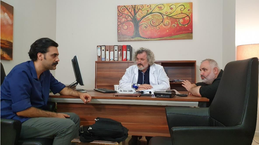
Görsel 4: Sahne 1 ve Sahne 15 Prova