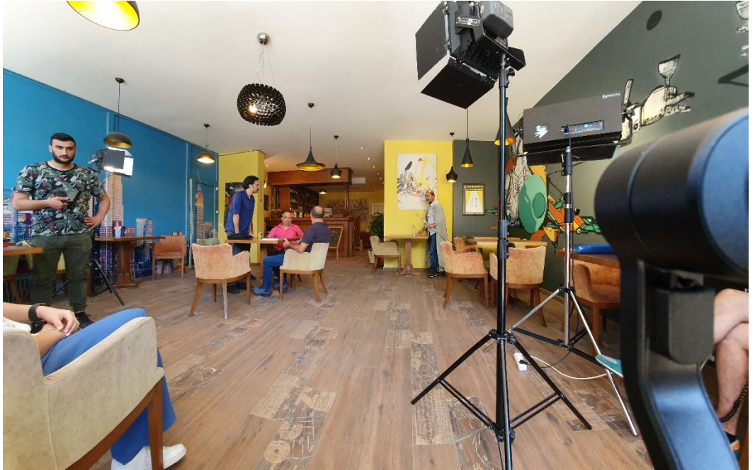
Görsel 2: Sahne 7 Cafe Prova Kayıt