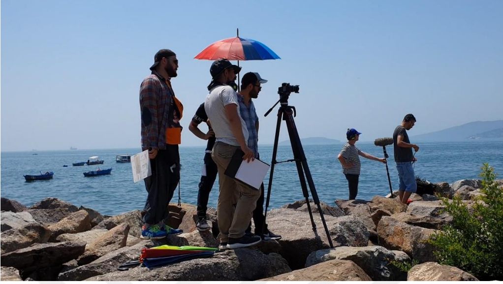
Görsel 3: Sahne 16 Prova Kayıt