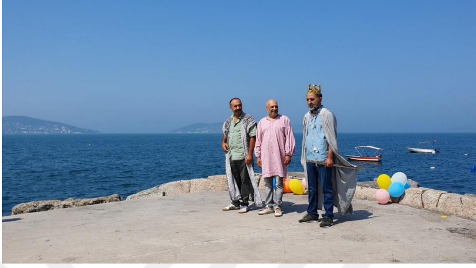
Görsel 1 : Sahne 16 Sahil Dış Gün