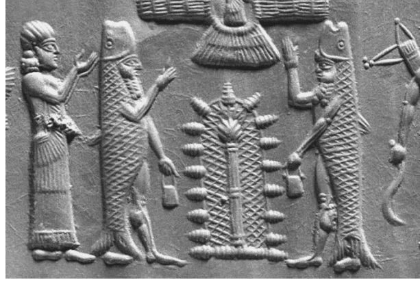
Şekil 2 APGAL, APKALLU