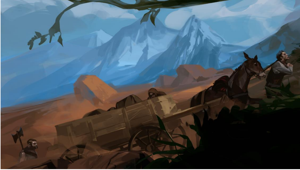
Film Görseli 1

Filmin görsel evreni kurulurken öz ve olay örgüsünden farklı bir yaklaşım belirlenmiştir. Görsel evren, geleneksel yerine, çağdaş tarz ve teknikler ile kurulmuştur. Filmin destansı ve fantastik atmosferini oluşturmak amacıyla konsept resimlerde, genelde daha ekspresyonist sanatta şahit olunan, birkaç renk tonu ve belirgin ışık-gölge etkileri ile yüksek kontrastlı bir görsel film evreni tercih edilmiştir. Filmin görsel dünyasında, hayat ağacı, vakvak ağacı, hayat pınarı, ahu, yılanlar, hüthüt ve yeraltı suları gibi geleneksel anlatı yapılarından gelen imgelemlere yoğun şekilde yer verilmiştir. (Film Görseli 1)