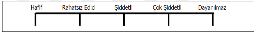
Şekil 1.1. Sözel değerlendirme skalası (Aslan 2002)

sıfatları işaretlemesi istenir. Kullanılan kelimeler hafif, rahatsız edici, şiddetli, çok şiddetli, dayanılmaz şeklinde beş kelime kategorisi ile on beş kelime kategorisi olarak değişiklik gösterebilmektedir (Melzack R 1992). Basit kelimeler barındırması sebebiyle bu tip skalalar hastalar tarafından çoğunlukla kolay anlaşılır (Jensen ve ark 1986). Akut ağrıda kullanılan analjezik etkinliklerinin ölçülmesinde, VRS diğer yöntemlere nazaran daha etkindir (Chapman ve ark 1985). VRS yönteminin ağrıyı değerlendirirken yetersiz olduğu en önemli iki dezavantajı; sıfatlar arasında eş aralıklar olduğu söylenmesine rağmen, kimi zaman bu sıfatların hiçbirinin hissedilen ağrıyı tam olarak betimleyememesi ve toplanan verilerin nonparametrik analizlerin yapılmasına imkan tanımasıdır. Bunlara ilaveten VRS, ağrı hissini betimlenmesinde yeterli özeni gösterememektedir (Ong ve Seymour 2004).