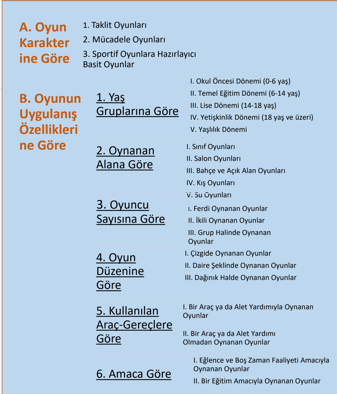
Şekil 3.1. Oyun Çeşitleri

Hazar'a (2006) göre eğitsel oyunlar, oyunun karakterine ve uygulanış özelliklerine göre iki kısımda incelenmektedir (Şekil 3.1).