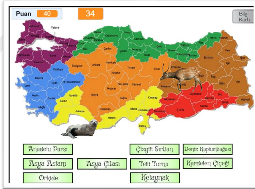
Şekil 4.4. Ben Neredeyim adlı oyunun 3. aşaması ekran görüntüsü