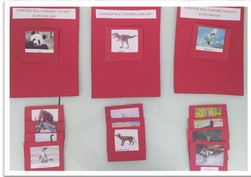
Şekil 4. 5. Canlıları Yerleştir Puanları kazan adlı oyunun görseli

Bu oyunda “Biyolojik çeşitlilik” konusunda öğrenilenlerin tekrarlanması, yanlış bilinen bilgilerin ise düzeltilmesi ve doğru bilgilerin öğrenilmesi amaçlanmıştır. Öğrencilerin oyunu oynarken bilgileri öğrenmesi ve eğlenerek süreçten sıkılmamaları sağlanarak dersler eğlenceli bir sınıf ortamında işlenmiştir. Oyunumuz İnsan ve Çevre ünitesi Biyolojik çeşitlilik konusunu içermektedir. Bu oyunumuzda ise öğrencilerin elinde karışık halde çeşitli canlılardan oluşan kartlar bulunmaktadır. Daha büyük kartlardan oluşturduğumuz bölmelere öğrenciler bu elindeki kartlardan uygun olanları yerleştirecektir. Yerleştirme bölmeleri Dünyada nesli tükenme tehlikesi olan canlılar, Türkiye’de nesli tükenme tehlikesi olan canlılar ve Dünyada nesli tükenmiş canlılar şeklinde düzenlenmiştir (Şekil 4.5). Öğrenciler elindeki kartları belirlenen sürede bölmelere yerleştirerek puanlar kazanır. Her doğru yerleştirmede 5 puan kazanılır, her yanlış yerleştirmede ise 5 puan kaybedilir. Oyunun sonunda da öğrencilerin puanları hesaplanır.