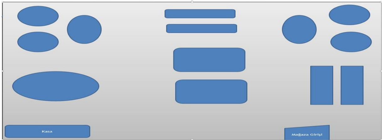
Şekil 3.4: Butik Biçim Mağaza Yerleşim Planı

Butik Biçim: Yukarda bahsettiğimiz iki yerleşim planının karması olan butik yerleşim planı mağazanın kendi alanı içinde ürünlerin bölümlendirilmesi ile oluşur. Örneğin kozmetik, giyim, ayakkabı, çocuk giyim gibi. Ayrılan her bir alanda aynı tasarımcı veya markaya ait ürünler sergilenmektedir (Ceylan, 2015: 32).