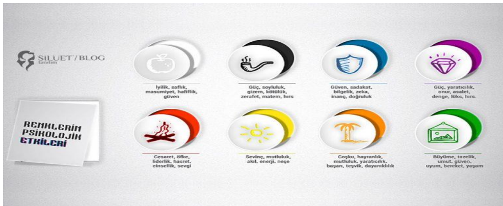
Şekil 3.1: Renklerin duygulara etkisi ile ilgili örnekler

URL1: ( https://blog.siluettanim.com/renklerin-psikolojik-etkileri/amp )