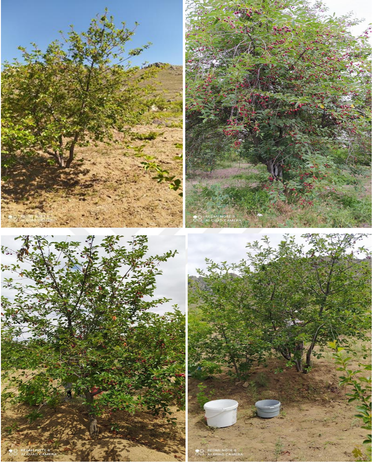
Şekil 3.1. Denemede kullanılan vişne genotipleri