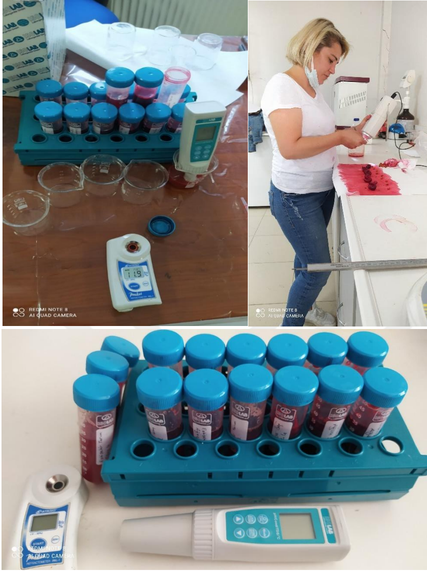
Şekil 3.2. Vişnede yapılan bazı analizler