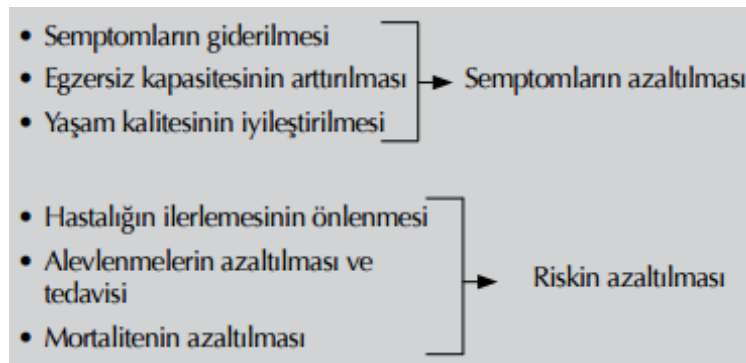
Tablo 5: KOAH tedavisinin amaçları

KOAH'ın oluşması ve doğal seyrini belirleyen en önemli faktör sigara kullanmaktır. KOAH'ta sigaranın bırakılması ile akcięer fonksiyonlarındaki yıllık kayıplar azalmakta ve yıllık FEV1 kaybı hiç sigara içmeyenlerin düzeyine düşmektedir. KOAH'ta sigara içiminin bırakılması dışında hiçbir tedavi giriřimi, akcięer fonksiyonlarındaki hızlı yıllık azalmayı ve hastalığın doğal seyrini önleyememektedir. Etkili bir KOAH tedavisinde başlıca amaçlar; hastanın semptomlarının ve gelecekteki risklerinin azaltılmasıdır.