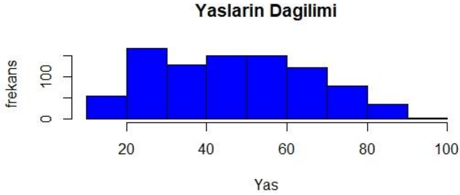
Şekil 1. Yaşların dağılımının histogramı

Cinsiyetlere göre hastaların yaşları arasında fark incelendiğinde, kadın (ortanca=46) ve erkek (ortanca=47) her iki cinsiyetin yaşları arasında bir fark bulunamamıştır ( U(N_{kadın}=370, N_{erkek}=515)=98926, p=0.33 ) (Şekil 2).