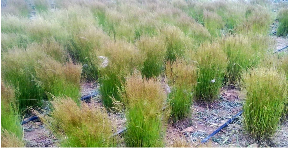
Şekil 1.1. K1 bitkilerinin deneme alanında görünümü

Bu materyaller üzerinde UPOV, USDA, TTSM ölçme ve değerlendirme esasları dikkate alınarak gözlem ve ölçümleri yapılmıştır. Veriler, her bir parseldeki 5 bitkinin tamamında yapılmıştır. Gözlem ve ölçümler yapıldığı zaman hasat dahil bitkilerin yaprakları sağlıklı bir şekilde yeşildi.