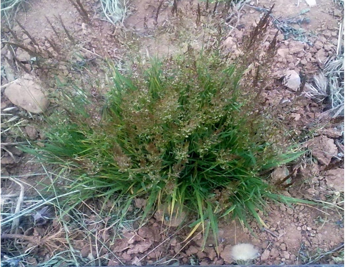
Şekil 1.5. K1 klonunun bitki çapı (kapladığı alan) görünümü