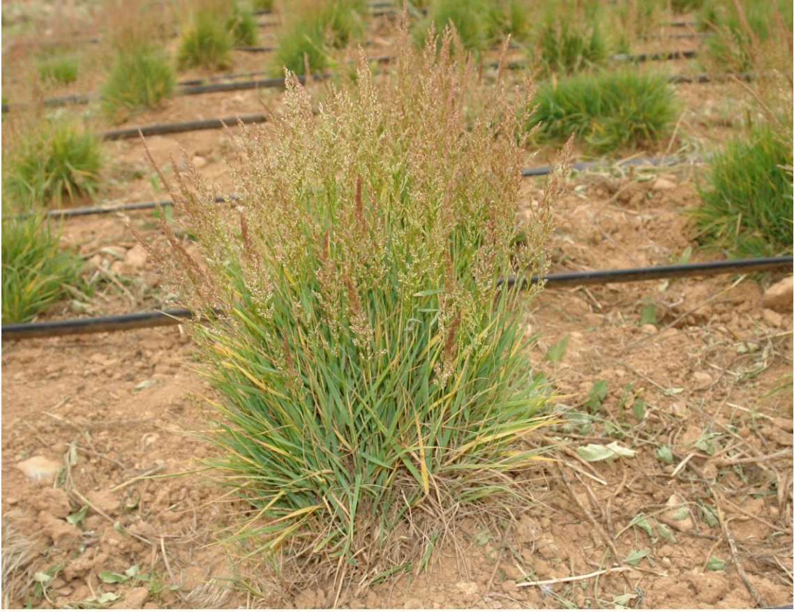
Şekil 1.6. K2 klonunun başak durumu görünümü