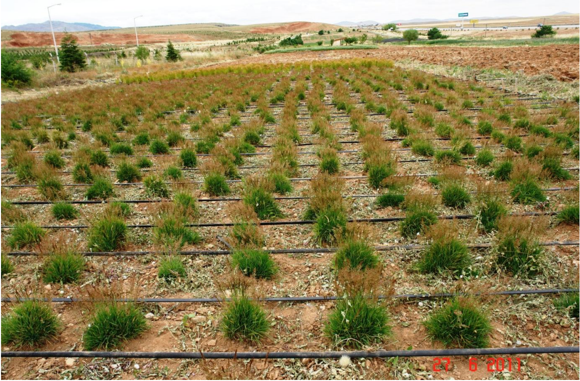
Şekil 1.2. K2 bitkilerinin deneme alanında görünümü