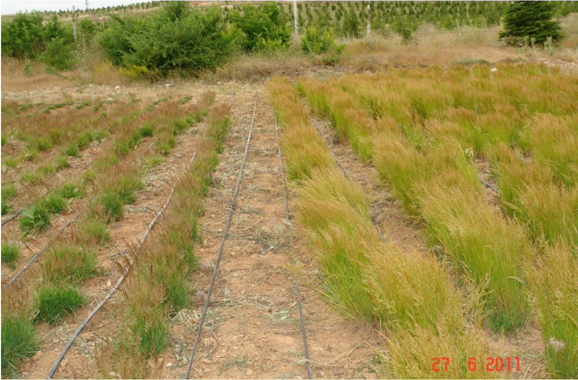
Şekil 1.3. K1(sağda) ve K2(solda) denemesinin genel görünümü