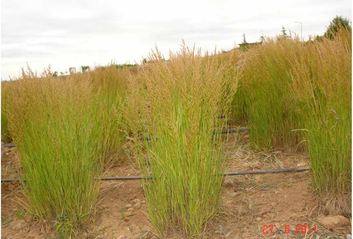
Şekil 1.4. K1 klonlarının habitus görünümü

Her bir bitkinin kapladığı alanın bir birine dik olarak ölçölüp, ortalaması alınarak hesaplanmıştır. Bitkiler tohum hasadı olgunluđuna geldiđi dönem veriler alınmıştır.