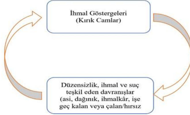
Şekil 3. Fiziksel Çevredeki İhmal Sinyalleri ile İnsan Davranışı Arasındaki Akış

Ayrıca daha önce üretimin azalması davranışı sergileyen çalışanlar da iş akdine son verme ya da karşıt davranışlar ortaya koymaktadırlar. Dolayısıyla yöneticiler kırık camlara müdahalede bulunmadıkça bu davranışlar kısır döngü gibi devam edecektir” (Güven ve Akmeşe, 2021) (bkz. Şekil 3).