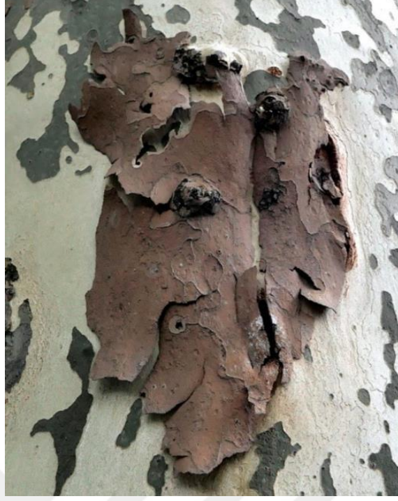
Görsel 4: Çınar Ağacı Gövdesinden Seçilmiş Kompozisyonun Oluşturduğu Soyut Fotoğraf