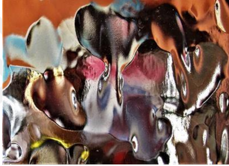
Görsel 13: 'Işık Öyküleri' Portfolyosundan Soyut Fotoğraf

Görsel 13'te, anlık bir değişimin içinde seçilen bir kompozisyonu göstermektedir. "Daha çok hayvan benzeşimli farklı varoluşlara ait suretlerin oluşturdukları mozaik içinde düşsel bir anlatım ile yıldızlarası göksel astral bir buluşma" dan söz edilebilir!