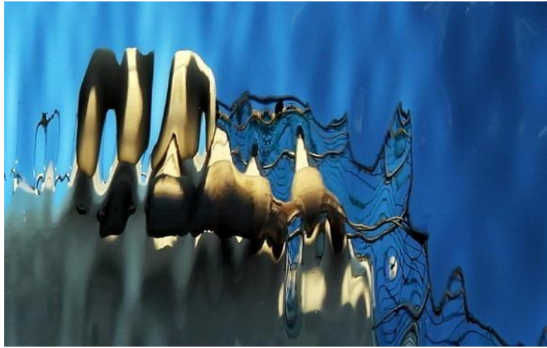
Görsel 12: ‘Sudan Öyküler’ Portfolyosuna Ait Soyut Fotoğraf

‘Sudan Öyküler’ portfolyosundan paylaşılan fotoğraf; deniz, ırmak, dere, göl gibi su yüzeylerinin ışık, dalgalanma, bir kuvvet etkisiyle yayılma vb. gibi etkenlerle hareketlenmesine bağlı olarak Görsel 12’de verilmiştir. Bu fotoğrafta, “ışığın su ile buluşmasıyla nesnelere yansıtmasının verdiği ana mekânda yayılmanın yarattığı etkiyle estetik bir görünüm sergilenmektedir. Fotoğrafın şekil bileşenleri olarak; iki sıralı bir yerleşim düzeninde, ön planda güçleriyle bir anıt gibi duran savaşı, sözü dinlenen donanımlı soyut özneler buldukları yerlere kök salmış gibiler. Arka planda çizgilerle betimlenmiş daha sıradan özneler yer almakta ve güçlü olanlarla daima bağ kurma çabası içinde onlara kul olmuş bir seremoni içinde görülmektedir”. Fotoğrafın estetik yanı sıra bir düş zenginliği sunduğunu da ifade etmek gerekir.