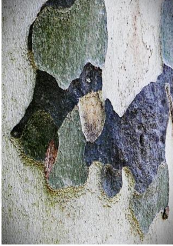
Görsel 8: Çınar Ağacı Gövdesinden Seçilmiş Kompozisyonun Oluşturduğu Soyut Fotoğraf

Diğer örnekler arasında yer alan ‘Duvarlardan Görmek’ portfolyosuna ilişkin soyut fotoğraflar kayıtlanırken; duvar, yer, direk, trafo, vb. yüzeylerine yapıştırılmış ve deforme olmuş resim, afiş, kâğıt, çizim, yazı vb. görseller izlenerek seçilmiş kompozisyonlardan kaynaklanılmıştır.