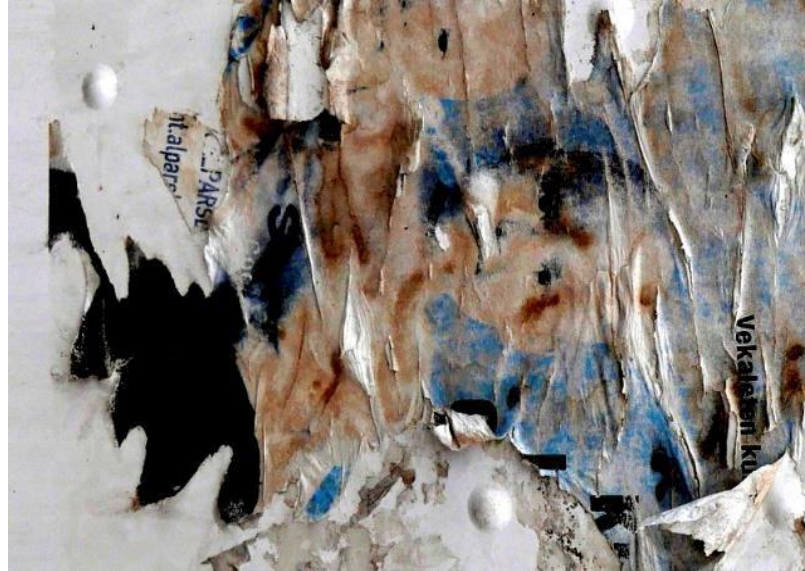
Görsel 10: Görsel 9'daki Yüzeyden Seçilmiş Kompozisyonun Oluşturduğu Soyut Fotoğraf