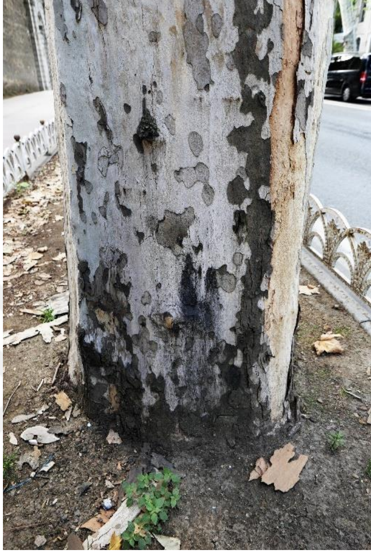
Görsel 1: Çınar Ağacı Gövdesinde Kavlanma Sonucu Oluşmuş Desenli Yüzey