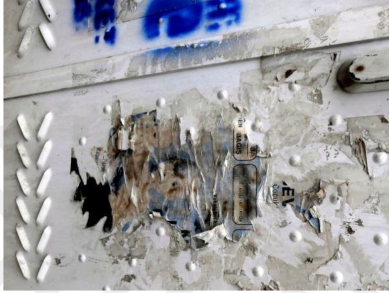
Görsel 9: Çınar Ağacı Gövdesinden Seçilmiş Kompozisyonun Oluşturduğu Soyut Fotoğraf

güçlü varlık ya da tanrı olarak karşılarında duran olası 'Aslan' ile ilişkilendirildiği bir seremoniyi yansıtıyor olabilir. Aslanın önündeki yine varlıklarla bezenmiş pano, onun tarafından yok edilen yaşantı dünyasının geçmiş zamanına ilişkin öznelere ilişkin bir yansıması” olarak değerlendirilebilir.