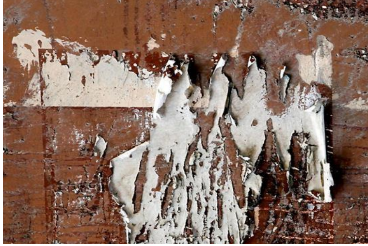
Görsel 11: ‘ Duvarlardan Görmek’ Portfolyosuna Ait Soyut Fotoğraf

‘Sudan Öyküler’ portfolyosundan paylaşılan fotoğraf; deniz, ırmak, dere, göl gibi su yüzeylerinin ışık, dalgalanma, bir kuvvet etkisiyle yayılma vb. gibi etkenlerle hareketlenmesine bağlı olarak Görsel 12’de verilmiştir. Bu fotoğrafta, “ışığın su ile buluşmasıyla nesnelere yansıtmasının verdiği ana mekânda yayılmanın yarattığı etkiyle estetik bir görünüm sergilenmektedir. Fotoğrafın şekil bileşenleri olarak; iki sıralı bir yerleşim düzeninde, ön planda güçleriyle bir anıt gibi duran savaşı, sözü dinlenen donanımlı soyut özneler buldukları yerlere kök salmış gibiler. Arka planda çizgilerle betimlenmiş daha sıradan özneler yer almakta ve güçlü olanlarla daima bağ kurma çabası içinde onlara kul olmuş bir seremoni içinde görülmektedir”. Fotoğrafın estetik yanı sıra bir düş zenginliği sunduğunu da ifade etmek gerekir.