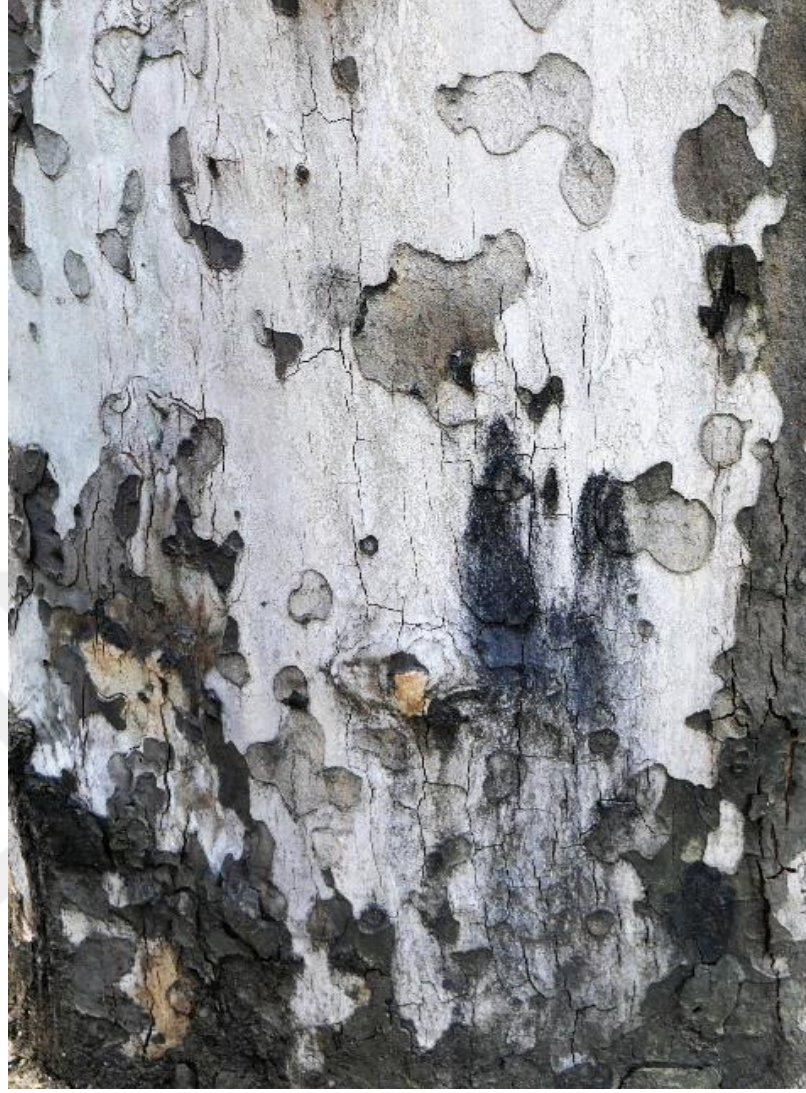
Görsel 2: Görsel 1'deki Çınar Ağacı Gövdesinden Seçilmiş Soyut Fotoğraf

Görsel algının soyut fotoğraf belirleyiciliği, neyin görüldüğü üzerine karar verilip oluşturulan kompozisyonda temsil edilebileceği üzere seçilip ortaya konulmuştur (Görsel 1 ve Görsel 2). Burada yapılan eylem, bir bilişim gereği olup, öncelikle tanımlanan nesnelerin zihinde ne şekilde bir değişime uğradığı ve nasıl ilişkilendirildiği konusunda gören kişinin görüşünün olması gerçeğine dayalıdır. Söz konusu bu süreç içinde kişiler, görülenleri anlama çabası içinde nesnelere irdeleyerek ve yaratıcılıklarını kullanarak farklı yaklaşımlarda bulunup bakış açılarını oluşturacaklardır. Soyut fotoğrafın ortaya konulmasında sözü edilen bilişim, gözlemlenen nesne ya da nesnelere bütününe aynı zamanda soyutlanmasını da getirmektedir. Bunu yaparken de fotoğrafçı, görülenleri çekip çıkararak kendilerini olduğu gibi görme yoluna gidebileceği gibi fotoğrafta sunulan bütün ilişkileri bir bütün