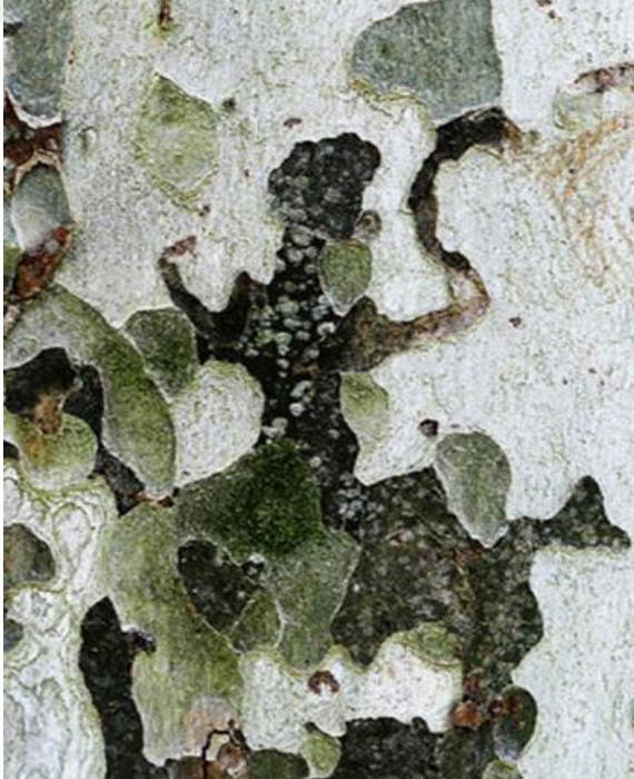
Görsel 5: Çınar Ağacı Gövdesinden Seçilmiş Kompozisyonun Oluşturduğu Soyut Fotoğraf