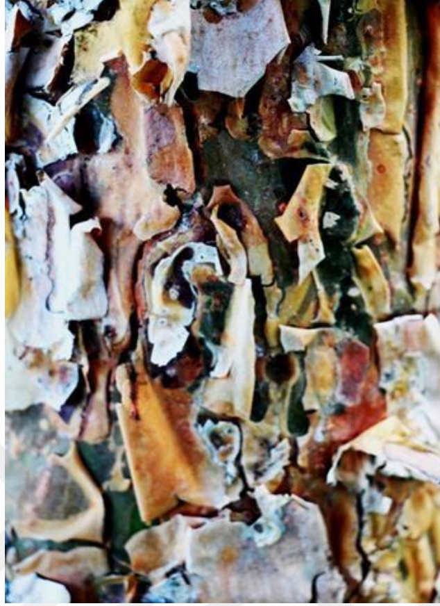
Görsel 7: Çam Ağacı Gövdesinden Seçilmiş Kompozisyonun Oluşturduğu Soyut Fotoğraf

Görsel 7’de Çınar ağacı gövdelerindeki örneklerden farklı olarak Çam ağacı gövdesinde kavlanarak kabuk parçalarının oluşturduğu yüzeyden seçilmiş kompozisyonda, bir portre algısından söz edilebilir. “ Merkezi odakta yer alan burun ve göz bütünlüğü soyut bir insan portresini anımsatıyor. Sağa bakış yönelimi ve farklı renk çeşitliliğinde ortaya çıkan bu tabloyu, soyut resim ustalarının eserlerini örtüşürmek olanaklı” gözükmektedir. Vurgulamak gerekirse diğer örneklerde de göze çarpan, doğada gözlemlenen somut nesnel oluşumlardan gören göz tarafından algılanarak kameranın aktarımıyla imgenin soyut fotoğrafa dönüşümü gerçekleşmektedir.