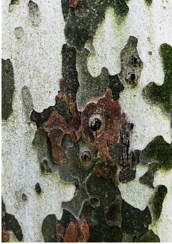
Görsel 6: Çınar Ağacı Gövdesinden Seçilmiş Kompozisyonun Oluşturduğu Soyut Fotoğraf

Görsel 6’da temsil edilen Çınar ağacı gövdesinden seçilmiş kompozisyon için; “kahverengi ve yeşil tonlarının egemen olduğu dengeli renk düzeni içinde merkezi odakta yerleşik gözlerle anlam kazanan bir kuş ya da kuşbakışı bakılan yönelimle görmede derinlik öğesinin kullanılabileceği yönüyle, yukarıya bakan yürüyen bir insan imgesinin çevresinde onu izleyenlerle bütünlendiği” bir betimleme düşünülebilir. Ayrıca bu fotoğraf için, yaratıcılık vasfıyla farklı varoluşların gerçeküstü ve kübist sanat anlayışlarında değerlendirilmesine olanak sağlayacağını da göz ardı etmemek gerekir.