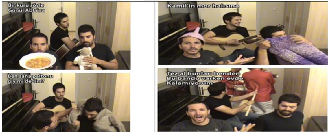
Görsel 2: Ah Anam Lahanam İsimli Viral Reklama İlişkin Görsel