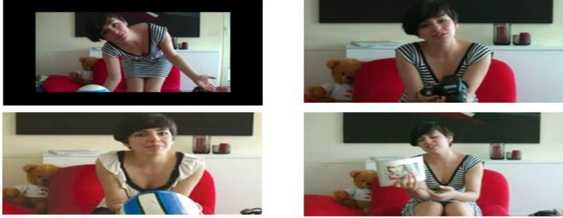
Görsel 1: Eski Sevgiliye Kapak İsimli Viral Reklama İlişkin Görsel