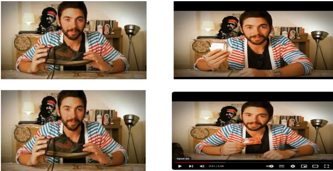
Görsel 3: İnanılmaz Evlenme Teklifi İsimli Viral Reklama İlişkin Görsel