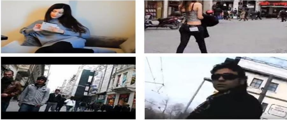
Görsel 5: İstanbul'da Hoş Bir Kız Olmak İsimli Viral Reklama İlişkin Görsel