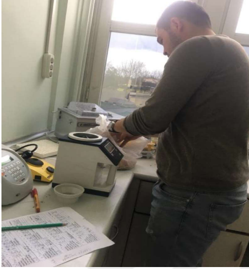
Şekil 3.5. Hektolitre ağırlığının belirlenmesi

Her parselden elde edilen üründen 250 ml'lik hektolitre ölçme aletinde (Şekil 3.5) tanelerin ağırlığı ölçülmüş ve 400 ile çarparak kg cinsinden belirlenmiştir (Aktaş, 2010, Ergün ve Geçit, 2008).