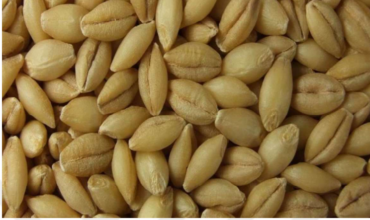
řekil 3.1. Kavuzsuz Arpa Tanesi

Denemede kullanılan iki sıralı kavuzsuz arpa eşidi (Yalın) Tarla Bitkileri Merkez Arařtırma Enstitüsü'nden saėlanmıřtır (řekil 3.1).