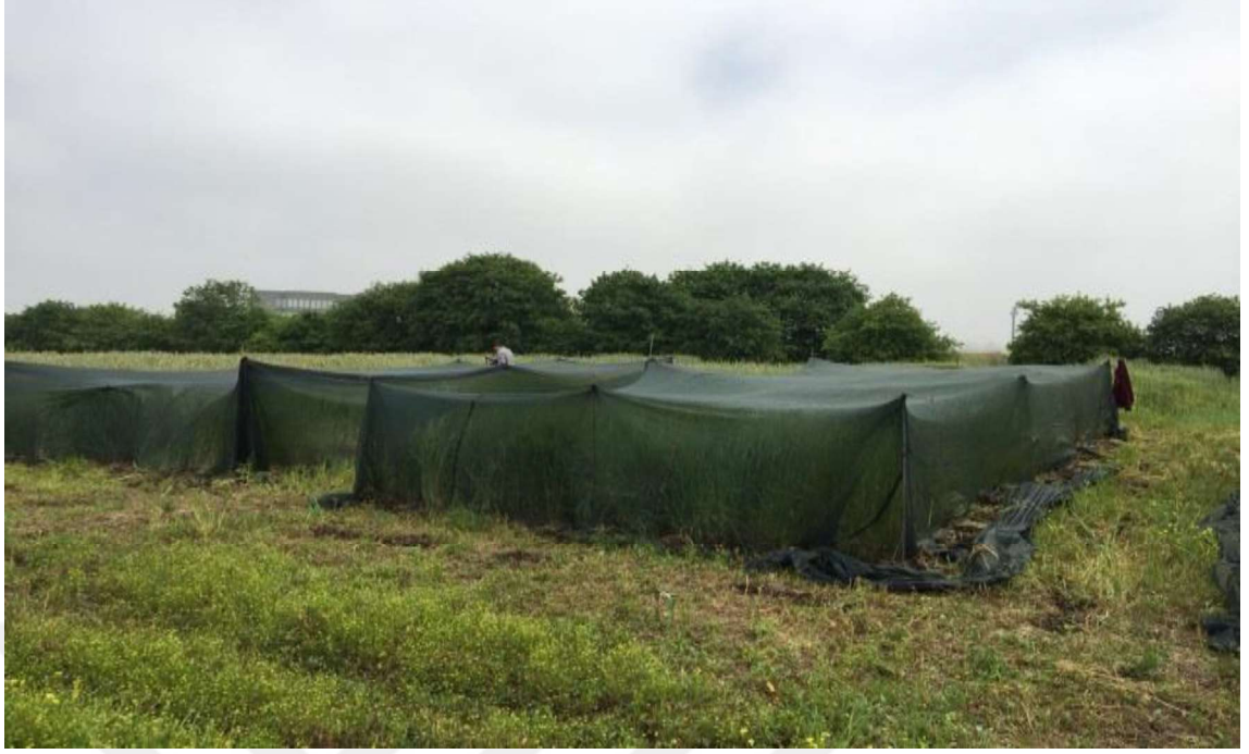
Şekil 3.3. Arpa parsellerinin kuş zararına karşı korunması

Denemede iki sıralı kışlık Yalın kavuzsuz arpa çeşidi ile 6 farklı azot dozu (0, 50, 100, 150, 200 ve 250 kg/ha) seviyeleri ele alınmıştır. Araştırmada ekim öncesinde deneme alanı için hesaplanmış triple süper fosfat her parsel eşit miktarda ayrı ayrı verilmiştir. Azotlu gübre olarak amonyum sülfat (%21 N) kullanılmıştır. Arpanın azotu kullanma durumu dikkate alınarak, azotlu gübrelerin 1/2'si ekimden hemen sonra, 1/2'si ise sapa kalkma devresi başlangıcında verilmiştir. Hasat, Bursa koşullarında Hege 125 parsel biçer döveri ile Balıkesir/Manyas koşullarında ise her parsel orakla ve çeşitlerin fizyolojik hasat olgunluğuna ulaştığı haziran ayı sonlarında biçilerek yapılmıştır (Şekil 3.4).