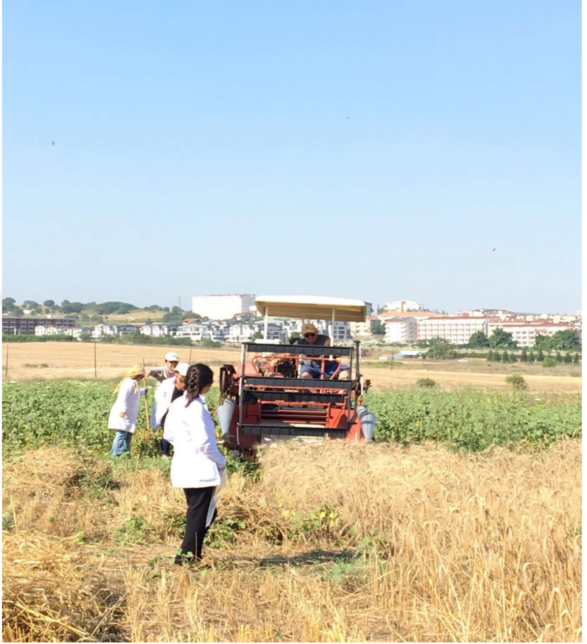
Şekil 3.4. Kavuzsuz arpa deneme parsellerinin hasadı

Denemede kullanılan arpa çeşidinde aşağıda verilen gözlem ve ölçümler yapılmıştır.