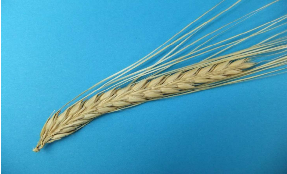
Şekil 3.2. Kavuzsuz Arpa başağı

https://arastirma.tarimorman.gov.tr/tarlabitkileri/Sayfalar/Detay.aspx?SayfaId=141