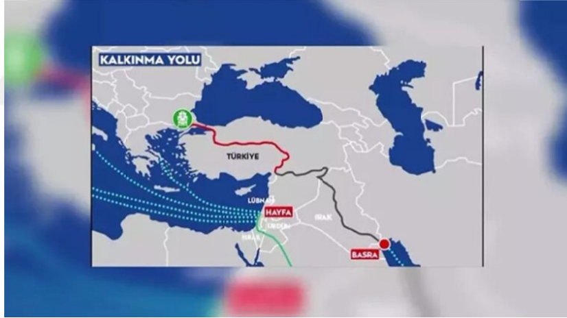
Şekil 2.2. Kalkınma Yolu