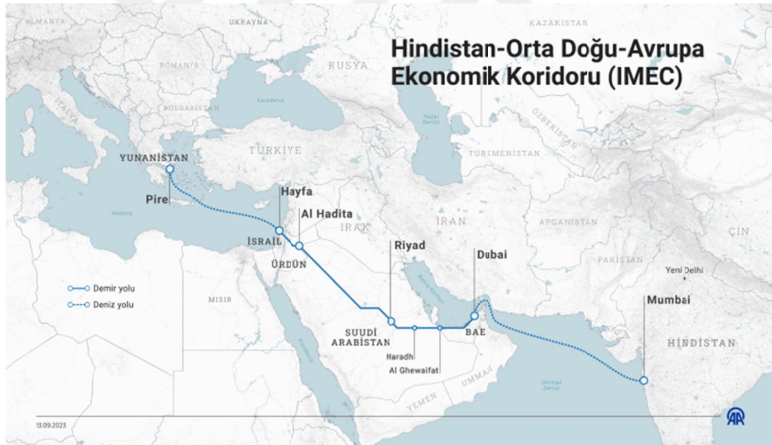
Şekil 2.3. Hindistan-Orta Doğu-Avrupa Ekonomik Koridoru ( IMEC)

Koridor bölümü gibi büyük küresel projelerle birleştirerek bu şekilde hakimiyet ana ticaret rotası olmayı ve dünya ticaretinde ve siyasetindeki rol artırmayı hedefliyor. Ancak, Türkiye'nin 21. yüzyılda barışçıl, terör ve savaşa karşı bölgesel bir güç olma vizyonuna uygun ve uyumludur. Nitekim Hamas -İsrail ve Ukrayna-Rusya çatışmaları gibi başka konularda da , Türkiye, her zaman barışçıl ve tarafları uzlaşmaya ve uluslararası hukuka davet eden yaklaşımlarıyla dünya kamuoyunda takdir toplamakta ve toplamaya devam etmektedir (Ezgi Akın, 2024).