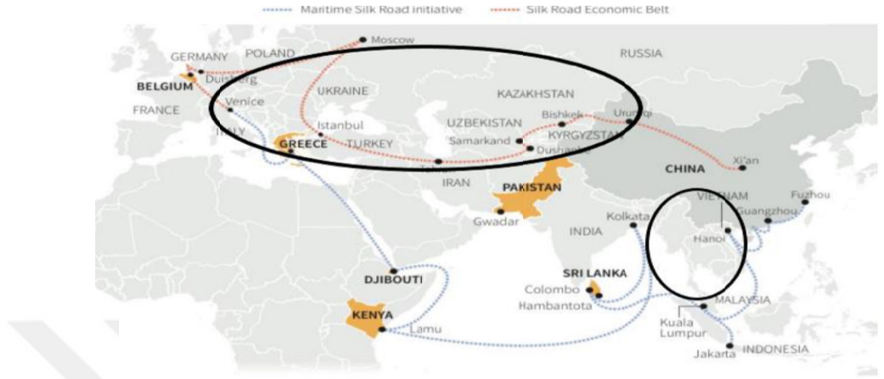
Şekil 3.2. BKBY Projesinin Deniz ve Kara Yolu Güzergahı ve Ekonomik Bölgeleri

Kaynak: Bocutoğlu, 2017: 266, HSBC, 2017; 2