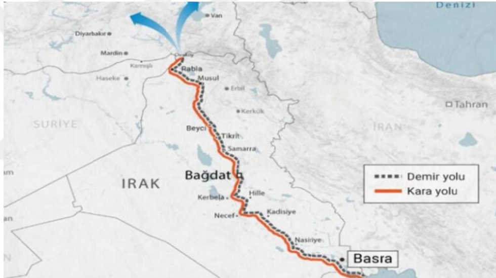
Şekil 2.1. Kalkınma Yolu Projesi'nin Demir ve Karayolu Güzergâhları

Cumhurbaşkanı Erdoğan'ın oğlu Irak'ın ziyaretinde Kalkınma Planı'na açıklanan kalkınma yolu projesi, Irak, Türkiye, Katar ve BAE arasında imzalanan dördü anlaşıma kapsamında hayata geçirilen yeni bir ulaşım ve kalkınma projesidir. Projenin İngilizce adı "Kalkınma Yolu" veya "Irak Kalkınma Yolu" olarak ilan edilmiştir (Ylenia Gostol, 2024). Cumhurbaşkanı Erdoğan ve Dışişleri Bakanı Hakan Fidan, projeyi ilk kez Eylül 2023'te Yeni Delhi'd düzenlenen G20 toplantısında kamuoyuyla paylaşmıştır.