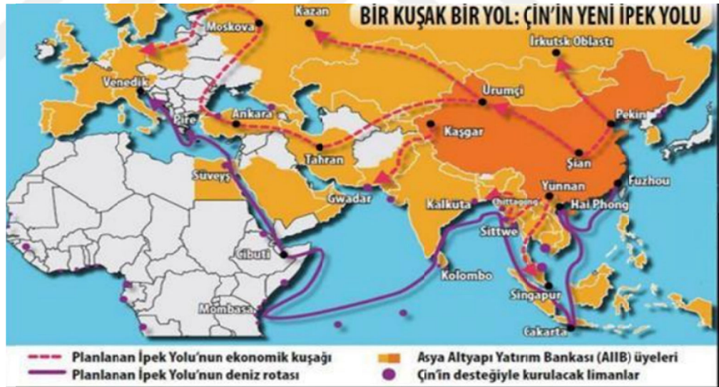
Şekil 2.4. : Kuşak v Yol İnisiyatifinin Kara ve Deniz Rotaları

mülkiyetine sahip çıktığına inandığı politik kurallara uyanlar "Kuzey-Güney" sloganıyla Afganistan'ı yeniden düzenliyor ve Afganistan'ı geliştirmeyi amaçlıyor "Doğu-Batı" sloganıyla yönlendirmeyi planlamaktadırlar. Çin Cumhurbaşkanı'nın 2013'te Endonezya Parlamentosu'nda yaptığı konuşmada, 21. yüzyılda Asya, Hint Okyanusu, Basra Körfezi ve Akdeniz'e yönelik baskı olayları dan bahsedilmiştir (Baylins, J., Steve, S., & Owens, P, 2016). Bazıları İpek Yolu'nu inşa etmeye hazırladıklarını, özellikle de Çin'in yeniden canlandırılması girişiminin kara olduğunu söylemektedir. Kara-deniz bağlantısına "Tek Kuşak, Tek Yol" adı verilmiştir (Tekir ve Demir, 2018: 192).