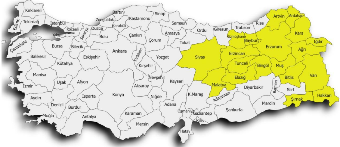
Şekil 4. 2. Kırmızı et üretim havzaları

Tarım ve Orman Bakanlığı tarafından üretim planlaması kapsamında kırmızı et üretimi için 19 il belirlenmiş olup üretimi artırmak için herhangi bir havza planlanmamıştır. Şekil 4.2’de Türkiye haritasında mevcut kırmızı et üretimi havzaları görülmektedir.