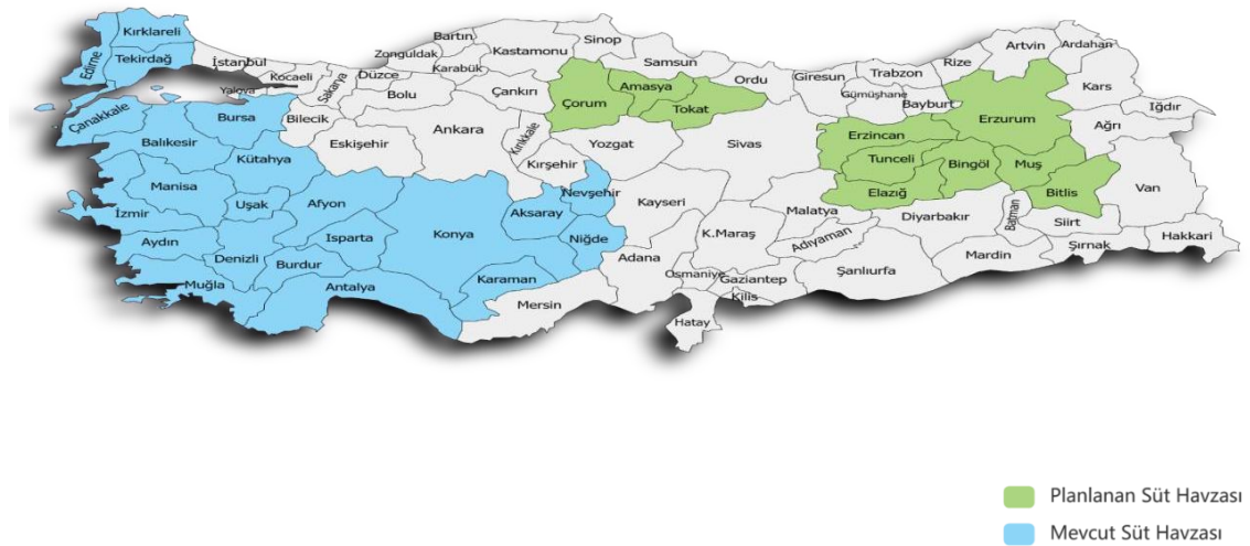
Şekil 4. 1. Çiğ süt üretim havzaları

Tarım ve Orman Bakanlığı tarafından üretim planlaması kapsamında çiğ süt üretimi için 22 İl belirlenmiş olup 18 İl ise üretimi artırmak için planlanmıştır. Konya ili mevcut süt havzası içinde bulunduğu için Karapınar ilçesi de aynı havza içinde değerlendirilmektedir. Şekil 4.1’de gösterilen Türkiye haritasında mevcut çiğ süt havzaları ile planlanan çiğ süt havzaları görülmektedir.