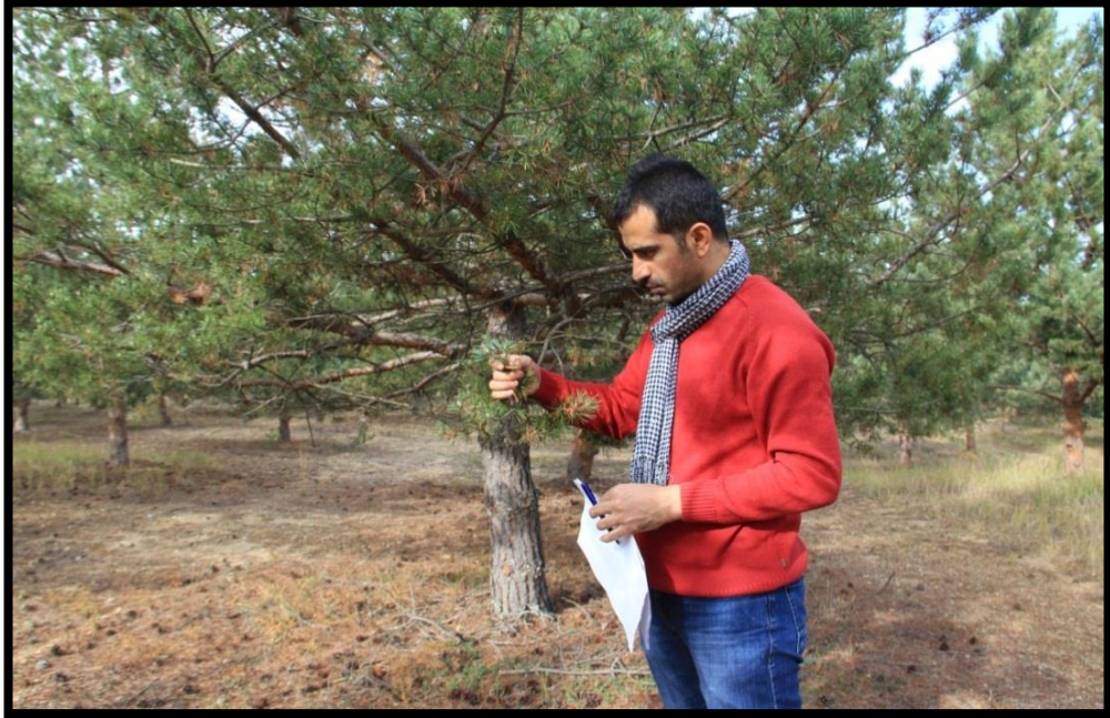
Fotoğraf 3.14. Tohum bahçesinde böceğin verdiği zararları incelerke