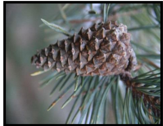
Fotoğraf 3.4. Kıvrık değil böcekli deformasyon sınıfı 5 (solda), sağlam deformasyon sınıfı 6 (sağda) yer alan kozalaklar