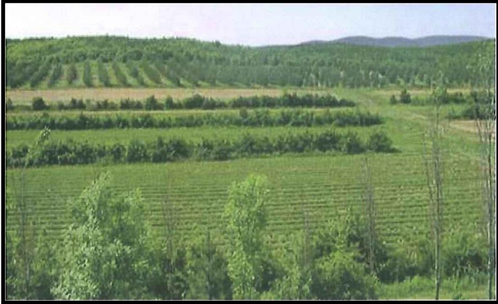
Fotoğraf 3.1. Taşköprü-Tekçamklonal tohum bahçesinin genel görünüm

Türkiye'de, sarıçam ( Pinus silvestris L.) ağaç türü ile kurulmuş 21 adet tohum bahçesi bulunmaktadır. Bu çalışmada materyal olarak seçilen Taşköprü-Tekçam klonal tohum bahçesi (Bahçe No: 151) bunlardan birisi olup, tohum bahçesinin Kastamonu şehir merkezine uzaklığı 65 km, denizden yüksekliği 1160 m'dir. Tohum bahçesi 41° 24' 14" - 41° 24' 34" kuzey enlemi ile 30° 22' 20" - 34° 23' 04" doğu boylamı arasında yer almaktadır. Tohum bahçesi Araç- Dereyayla sarıçam tohum meşceresinden fenotipik seleksiyonla seçilen 30 adet plus ağaçtan üretilen, toplam 1987 adet aşı yaşı 2 olan aşıllı fidanlarla 6x6 m aralık-mesafe ile 1995 yılında kurulmuştur (Fotoğraf 3.1) (Ek-1). Orman idaresi tarafından tohum bahçesinden 2003 yılında kozalak hasadına başlanmıştır. Materyal olan tohum bahçesi Sarıçam türünün doğal yayılış alanı içerisinde "Birinci ana ıslah zonu, ikinci alt ıslah zonunda" yer almaktadır (URL- 1, 2008).