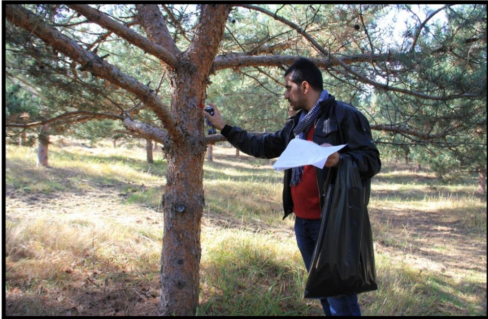
Fotoğraf 3.7. Tohum bahçesinde krokide işaretlenmiş ağaçların işaretlenmesi