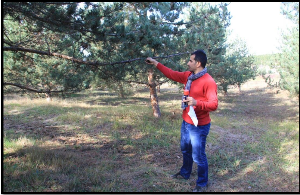
Fotoğraf 3.6. Arazi çalışmalarında tohum bahçesinde kozalak toplarken