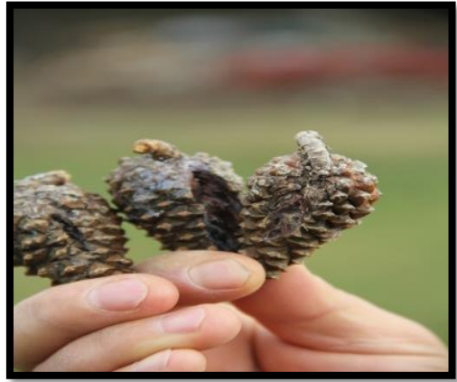
Fotoğraf 3.2. Az kıvrıklı böcekli deformasyon sınıfı 1 (solda), az kıvrıklı böceksiz deformasyon sınıfı 2 (sağda) yer alan kozalaklar