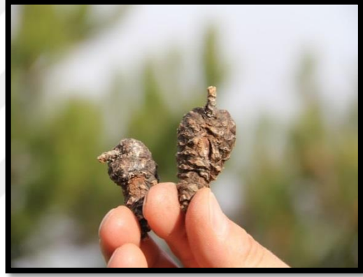
Fotoğraf 3.3. Çok kıvrıklı böcekli deformasyon sınıfı 3 (solda), çok kıvrıklı böceksiz deformasyon sınıfı 4 (sağda) yer alan kozalaklar