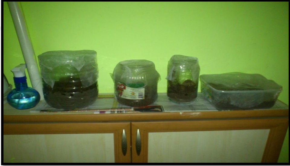
Fotoğraf 3.5. Bulunma dönemleri ve ergin çıkışlarının izlendiği kültür kavanozları

Zararluların biyolojik dönemlerini ve ergin çıkışlarını saptamak amacıyla toplanan kozalak örneği, ağzı beyaz organze kumaş ile kapatılmış plastik kültür kavanozlarına teker teker konulmuştur. Kavanozlar, kozalak örneklerinin alındığı bahçe, kozalağın gelişim dönemi, kozalağın alındığı tarih ve kavanoz numarasını taşıyan etiketlerle etiketlenmiştir. Bu kavanozlar haftada en az üç kez kontrol edilerek kayıtlar tutulmuştur. Böylece, laboratuvar koşullarında kozalak zararlılarının buldukları dönemler ve ergin çıkışları saptanmıştır. Elde edilen böceğin tanı ve doğrulamalarını Doç. Dr. Sabri ÜNAL tarafından gerçekleştirilmiştir.