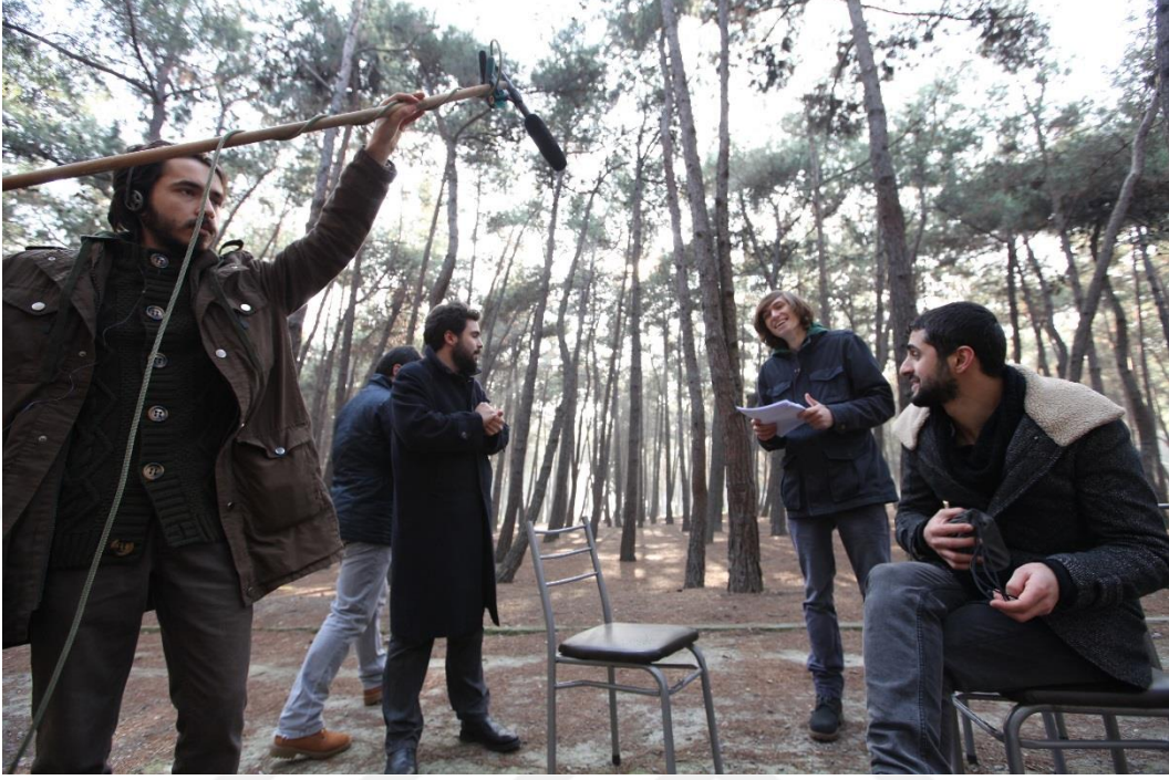
Resim 1.3. Ses denemeleri