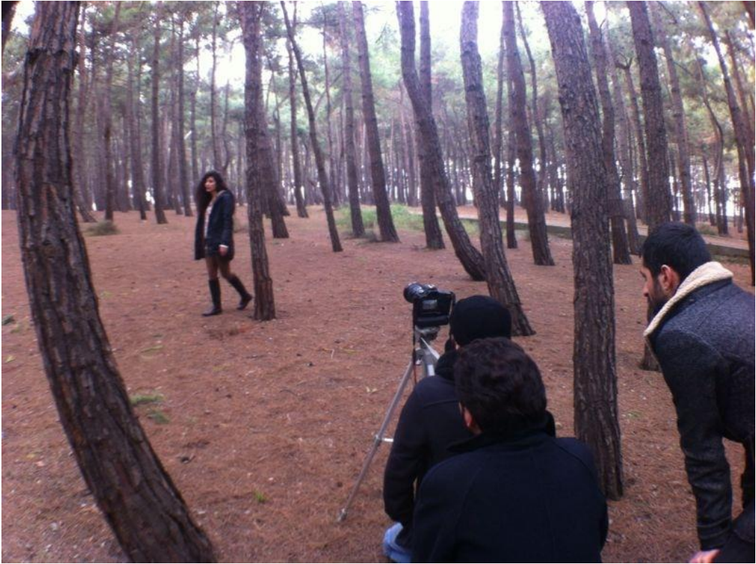
Resim 1.4. Sahne çekim anı