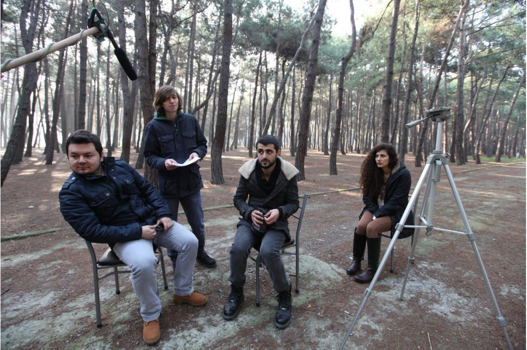
Resim 1.2. Senaryo okuma ve tekrar süreci