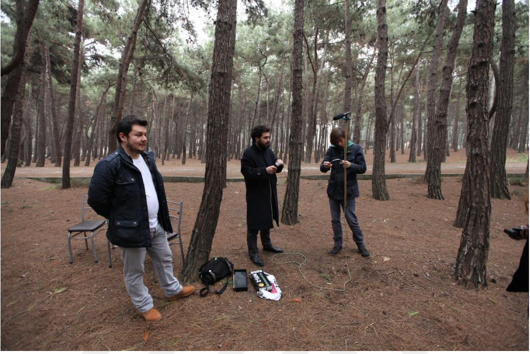
Resim 1.1. Çekim hazırlık süreci