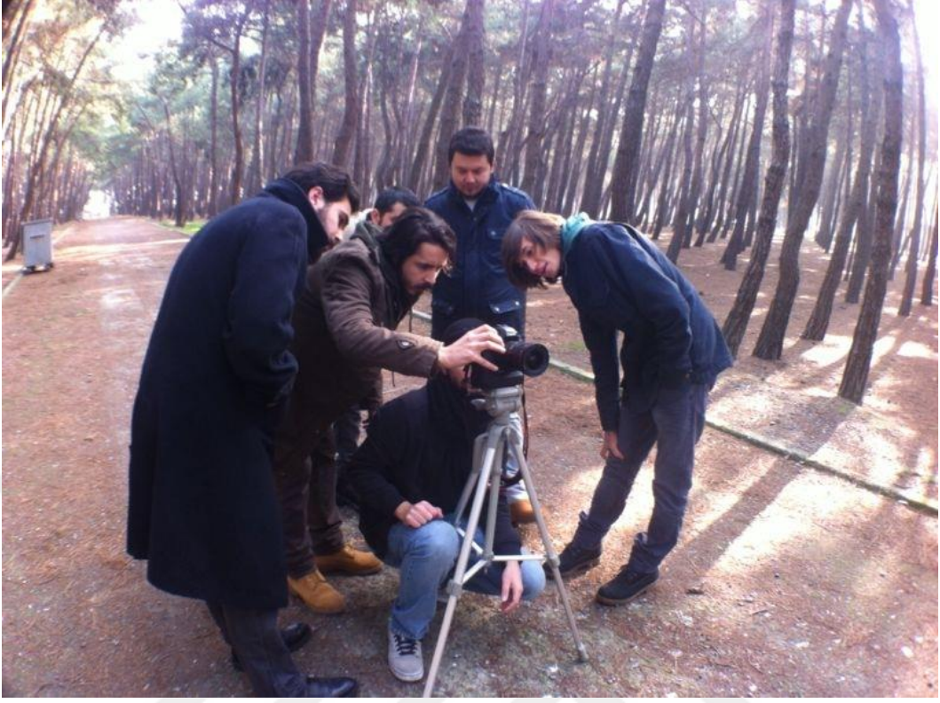
Resim 1.5. Çekimleri tekrar izleme