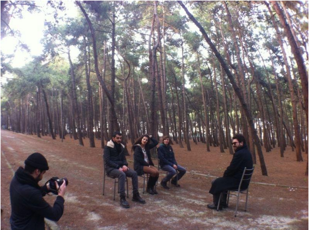
Resim 1.6. Deneme çekimi anı