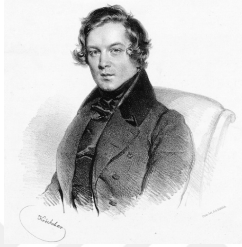
Görsel 1.1. Robert Schumann, Viena 1839