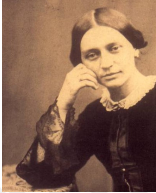
Görsel 1.2. Clara Schumann 1853