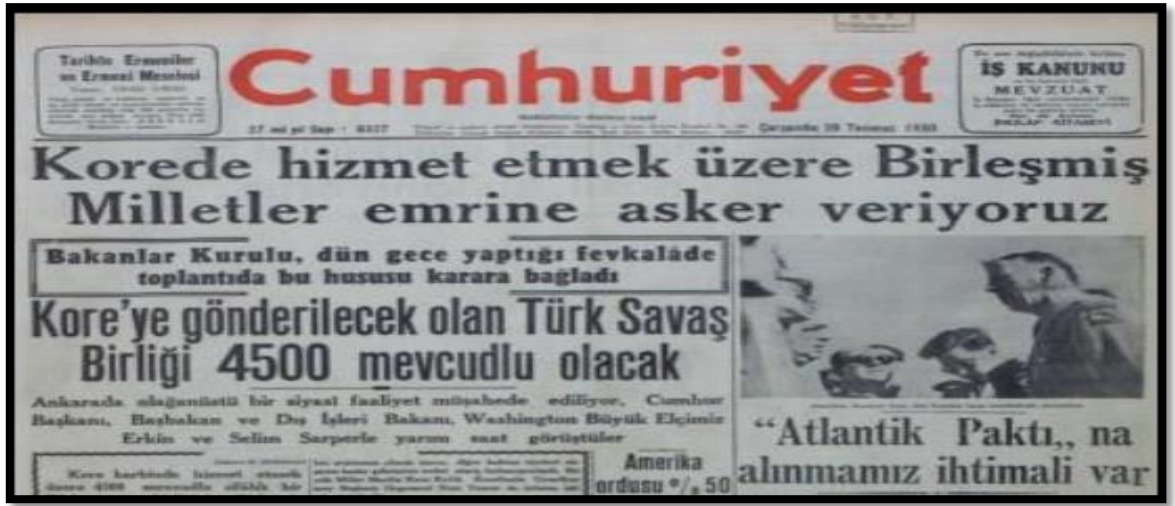
Resim-15. 26 Temmuz 1950 Cumhuriyet Gazetesi

26 Temmuz 1950 tarihli Cumhuriyet Gazetesi ilk sayfasında “Kore’de hizmet etmek üzere Birleşmiş Milletler emrine asker veriyoruz” başlığıyla Türkiye’nin savaşa katıldığını kamuoyuna duyurmuştur. Hükümet tarafından alınan asker gönderme kararı TBMM onayı olmadan alındığı için muhalefet tarafından sert bir dille eleştirilmiştir. Haberin içeriğinde Bakanlar Kurulu tarafından alınan bu kararın ehemmiyetine değinilmiş ve 4500 askerin Kore’ye gideceği bildirilmiştir.