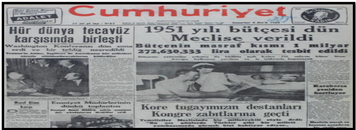
Resim-18. 9 Aralık 1950 Cumhuriyet Gazetesi

Gazete 5 Aralık 1950 tarihli yayınında da Türk birliğinin başarılarını ön plana çıkarmıştır. Haberde “Dünya gazeteleri ve radyoları hâlâ birliğimizin efsanevi başarılarını övmekle meşgul” denilmiştir. Cumhuriyet Gazetesi sürekli Türk birliğinin başarılarını ve diğer ülke basını tarafından yapılan övgüleri haberleştirerek Kore Savaşını gündemde tutmaya ve bu karar lehinde bir kamuoyu oluşturmaya çalışmıştır.