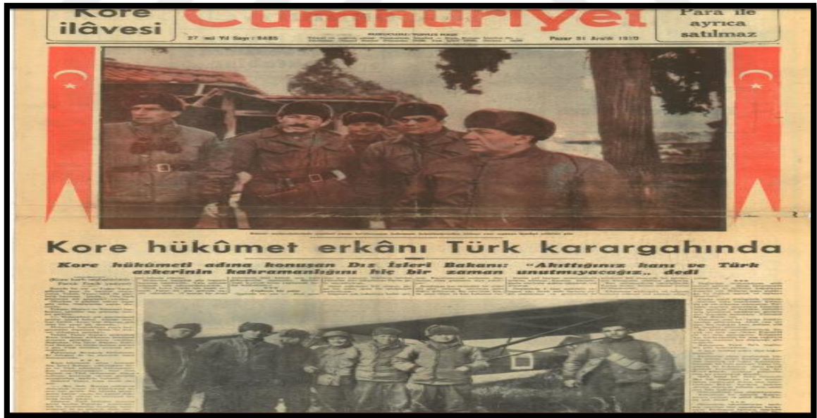
Resim-21. 31 Aralık 1950 Cumhuriyet Gazetesi

13 Aralık 1950 tarihli Cumhuriyet'te manşetten verilen " Kahraman Tugayımız Seul'u Müdafaa Edecek " haberi Türk birliğinin savaşta aktif rol oynadığına ve önemli başarılar kazandığına vurgu yapmıştır. Savaş muhabiri Fenik, " Türkler gibi dövüştüler " sözünün Kore'de yaygın şekilde diğer milletler tarafından kullanıldığını belirterek Türk birliğinin başarılarını ön plana çıkarmıştır.