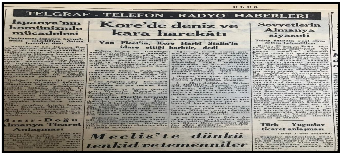
Resim-26. 27 Şubat 1953 Ulus Gazetesi

Ulus Gazetesi'nde yer alan “Rus notasına cevabımız bir hafta içinde hazırlanacak” başlıklı haberde, Türkiye'nin NATO'ya üyeliği ve NATO ülkeleri ile ileri seviyede ilişkiler kurması Rusları rahatsız etmiş ve Türkiye'ye muhtıra göndermiştir. Bu durum Türk-Rus ilişkilerini germiştir ve Türkiye'yi daha da çok ABD güdümüne sokmuştur.