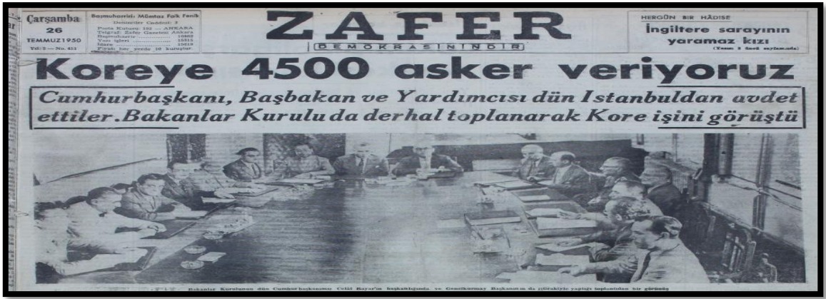
Resim-6. 26 Temmuz 1950 Zafer Gazetesi

26 Temmuz 1950'deki Zafer Gazetesi'nde Türkiye'nin savaşa katılacağı "Kore'ye 4500 asker veriyoruz" başlığıyla duyurulmuştur. Haber "Cumhurbaşkanı, Başbakan ve yardımcısı dün İstanbul'dan avdet ettiler. Bakanlar Kurulu da derhal toplanarak Kore işini görüştü" şeklinde verilmiştir. Zafer Gazetesi haberde bakanlar kurulunun olduğu bir fotoğraf kullanmıştır. Zafer Gazetesi Türkiye'nin savaşa katılma kararı almasından önce bunun alt yapısını oluşturmuştur.