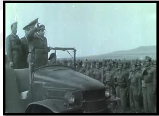
Resim- 64 Şimal Yıldızı- Kore’de Türk Birliği

Filmde yeşilçamın Kore Savaşı’na bakışı Üsteğmen Kemal’in “ Bu harp dünya kuruluşu beri yapılan harplerin en manalıdır. Burada vatanımız için, çocuklarımızın namusu için, insanlık ideali için, iyinin kötüyü yenebilmesi için, ebedi hürriyet ve gerçek değerler için dövüşüyoruz ” şeklindeki sözlerinden anlaşılabilir.