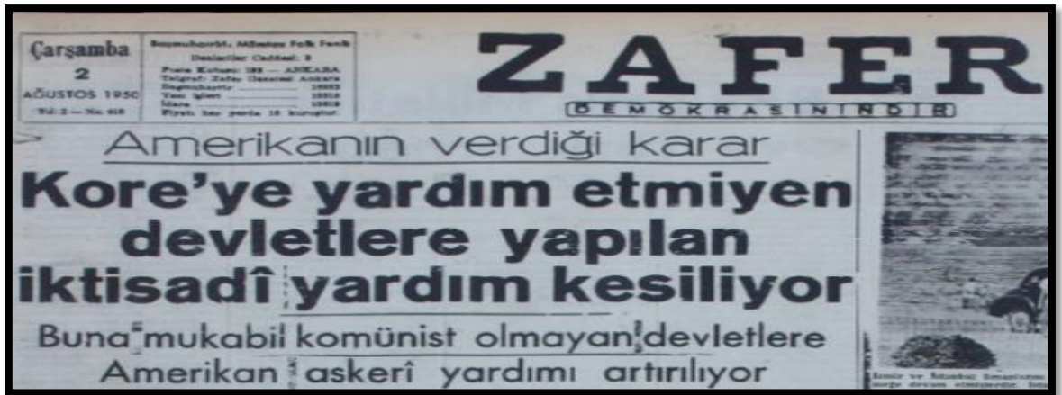
Resim-7. 2 Ağustos 1950 Zafer Gazetesi

Zafer Gazetesi adına Kore haberleri yapan Faruk Fenik "Türkiye'ye yapılacak yardımlar" başlıklı yazısında ABD'nin Türkiye'ye yapacağı yardımlardan bahsederek Senatör Cain hakkında övgü dolu söylemlerde bulunmuştur. Habere göre Senatör Cain'in, ABD Kongresinde Türkiye'nin NATO'ya alınması için yoğun bir çaba harcadığı belirtilmiştir. Görüldüğü üzere basın kullandığı ifadelerle, senatörü Türk halkı nezdinde değerli ve güvenilir hale getirmiştir. Bu ise senatörün Türkiye adına göstereceği çabalar için halk nezdinde inanılır olmasına yardımcı olmuştur.