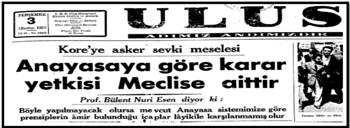
Resim-24. 3 Ağustos 1950 Ulus Gazetesi

Ulus, 28 Temmuz tarihli baskısında “ Hükümet son kararı ile anayasayı ihlal etmiştir ” başlığı ile verdiği haberde, hükümetin aldığı karara tepki göstermiştir. Türkiye ilk defa kendi topraklarından uzak bir coğrafyaya asker gönderme kararı almıştır. Hükümetin bu kararı muhalefetle tartışmadan ve meclisten geçirmeden alması anayasaya aykırı bir hamle olarak değerlendirilmiş ve muhalefet tarafından sert bir dille eleştirilmiştir. Gazetede bu konuyu destekleyen Hukuk Profesörü Nihat Erim’in “ Anayasa karşısında hükümetin kararı ” başlıklı yazısı yayınlanmıştır. Erim, yazısında özetle Birleşmiş Milletler’in anayasası ile Türk anayasasını karşılaştırarak, harp ilan etme yetkisinin Meclis’te olduğunu belirtmiş ve hükümetin aldığı kararın anayasaya aykırı olduğunu savunmuştur. Yine aynı tarihte Feridun Osman Menteşoğlu “ Bir olupbittiden sonra ” başlıklı köşe yazısında kullandığı “ Türk milleti için tam bir emrivaki şekilde tecelli etmiş... ” şeklindeki ifadelerle böylesine önemli bir kararın Meclis’ten geçirilmemiş olmasını benzer cümlelerle eleştirmiştir.