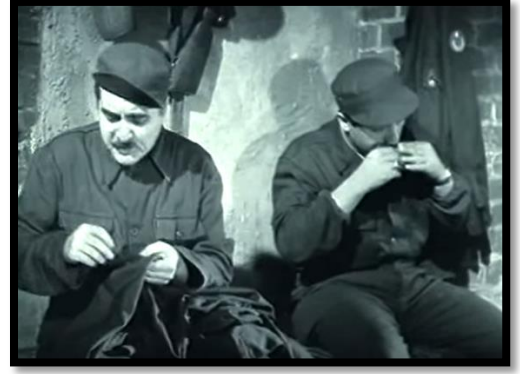
Resim- 66 Şimal Yıldızı- Askerlerin Eğlencesi

Çalışma kapsamında değerlendirilen bir diğer film olan Kore’de Türk Süngüsü filminde olduğu gibi, Şimal Yıldızı ’nda da Türk askerlerinin dinlenirken mızıka eşliğinde şarkılar söyleyip eğlenmesi, savaş ortamındaki rahatlığını ve kendine güvenini gösterir. Bu tarz örneklerle savaş, genç adaylar için cazip hale getirilmeye çalışılmıştır. Filmde esir alınan askerler ve Can Bey’in torunları, filmin ana karakteri Üsteğmen Kemal tarafından kurtarılmaya çalışılır. Kahraman Türk askeri vurgusu ön plandadır ve filmin sonunda Yıldızhan ve Üsteğmen Kemal birlikte özlenen anavatana yani Türkiye’ye dönerler.