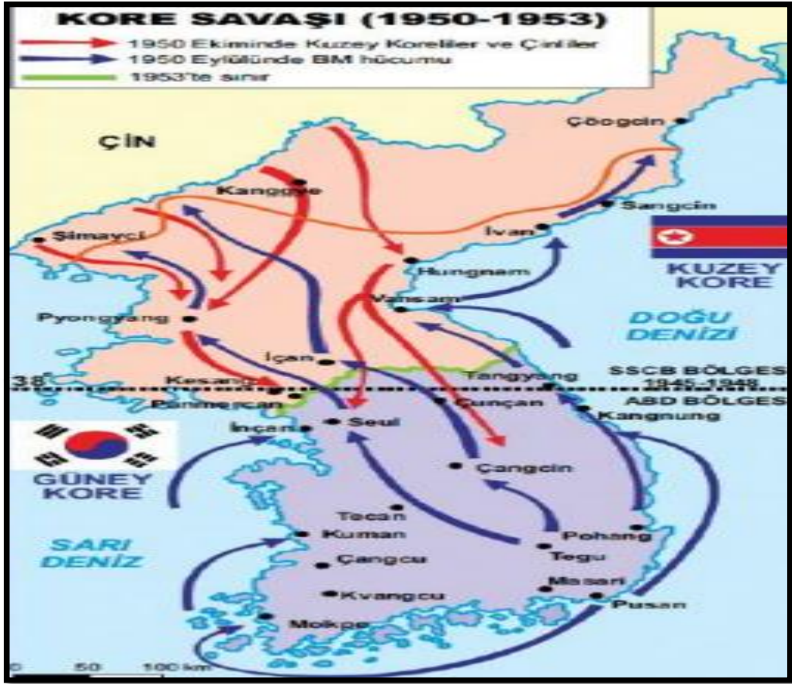
Resim-2. Kore yarımadası ve 38. Paralel

Planlama aşamasında geçici süreliğine güvenliği sağlamak amacıyla kuzey ve güney olmak üzere ikiye ayrılrsa da Rusya hâkimiyeti altına aldığı yarımadanın kuzeyini yabancı bir toprak haline getirmiş, güneyle irtibatını bütünüyle koparmıştır. 38. Paralel boyunca sınırda oluşturduğu kontrol, bir anlamda, iki tarafın ilişkilerini kopartarak savaş ortamını andıran bir durum meydana getirmiştir (Gökmen, 2014: 63-64).