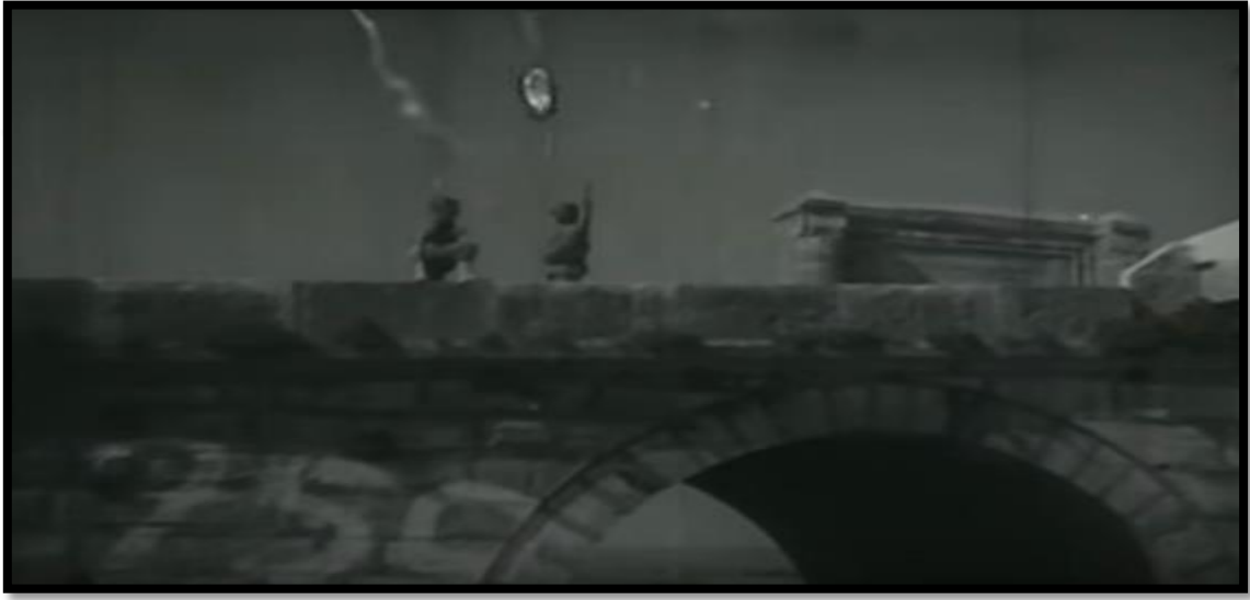
Resim-54 Zafer Güneşi- Türk Askerinin İmha Ettiği Köprü

Film içerisinde Kore’de savaşan Türk askerlerinin Kuzey Kore ordusu için çok önemli olan bir köprüyü başarı ile imha etmesi üzerinden yine kahramanlık vurgusu yapılmıştır. Filmde Kuzey Kore için Kızıllar denilmiş ve bu söylem yönetmenin savaşa bakış açısını açık bir şekilde göstermiştir.