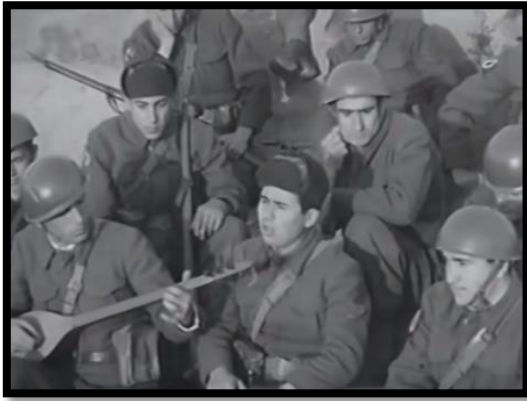
Resim-40 Kore'de Türk Süngüsü- Türk Askeri

Filmde Türk askerinin Kore yolculuğuna ait görüntüler kullanılmış ve Türk askerine övgüler düzülmüştür. Aynı şekilde Kore'ye gelip savaşa katılan Türk askerlerinin yaptığı talimlere ve mücadeleye yer verilmiştir. Filmde Türk askerlerinin Kore'de eğitimler ve çatışmalardan arta kalan zamanda cümbüş eşliğinde şarkılar söyleyip eğlenmesi yine Türk halkının askerlik ve savaş konusundaki rahat ve istekli bakış açısını destekler mahiyettedir. Bu sahnelerle Türk askerinin savaş ortamında ne kadar rahat ve kendine güvendiğine vurgu yapılmaktadır.