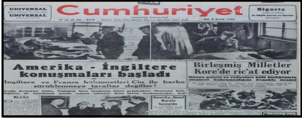
Resim-17. 5 Aralık 1950 Cumhuriyet Gazetesi

2 Aralık 1950 tarihli Cumhuriyet Gazetesi Türk birliğinin gösterdiği başarıları “Birliğimizin Gösterdiği Kahramanlık Bütün Dünyada Heyecan Yarattı” başlığı ile duyurmuştur. Türk birliğinin 10 bin düşman askerine karşı 2 bin kişi ile verdiği mücadele destansı bir üslupla anlatılmış ve iktidarın savaşa katılma kararının haklılığı pekiştirilmeye çalışılmıştır. Haberde Türk askerinin olduğu bir görsel de kullanılmıştır.