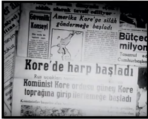
Resim-37 Kore'de Türk Süngüsü- Kore Haberleri

Filmde sık sık Türk basınında Kore Savaşı ile ilgili haberlerin olduğu kesitler kullanılmıştır.