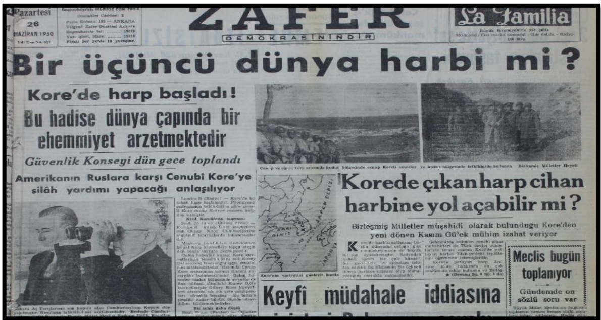
Resim-3. 26 Haziran 1950 Zafer Gazetesi

Türkiye'nin Kore Savaşı'na katılması konusu Zafer Gazetesi tarafından manşetten verilmiş ve üzerine birçok haber yapılmıştır. Çalışmanın bu aşamasında Zafer Gazetesinin Kore Savaşı haber başlıkları incelenmiştir.