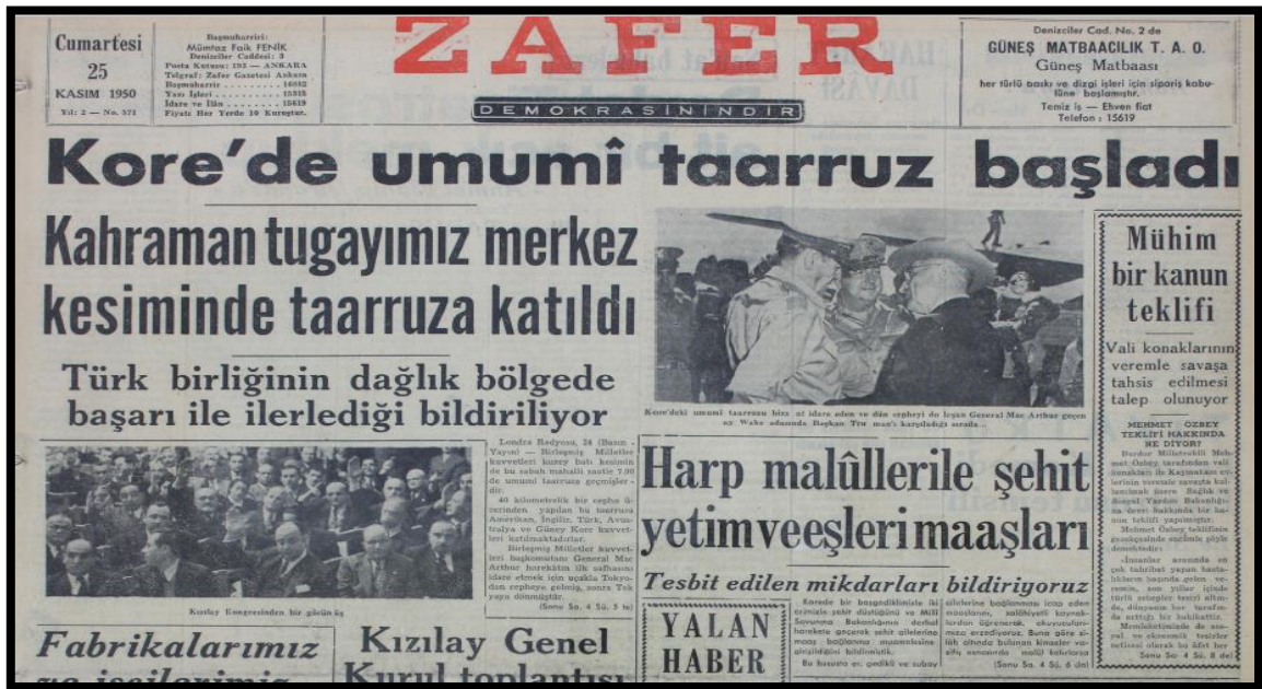
Resim-10. 25 Kasım 1950 Zafer Gazetesi

Zafer Gazetesi'nin 22 Kasım 1950 tarihli "Tugayımızın Kore'de yeni başarıları" başlığıyla verilen haberde Türk tugayının başarılarından bahsedilmiştir. Türkiye'nin savaşa girmesinin haklılığı ve gösterdiği başarılar ön plana çıkartılarak, muhalefetin haksızlığına gönderme yapılmıştır. Haberin devamında büyük zorluklara rağmen Türk birliğinin, düşman saldırılarını boşa çıkardığı ve bununla da yetinmeyip düşmana zayıf verdiğine vurgu yapılmıştır. Haberde kullanılan görselde Türk sancağını taşıyan askerler okuyucuya sunulmuş ve Türk askerinin güçlü duruşu gösterilmeye çalışılmıştır.