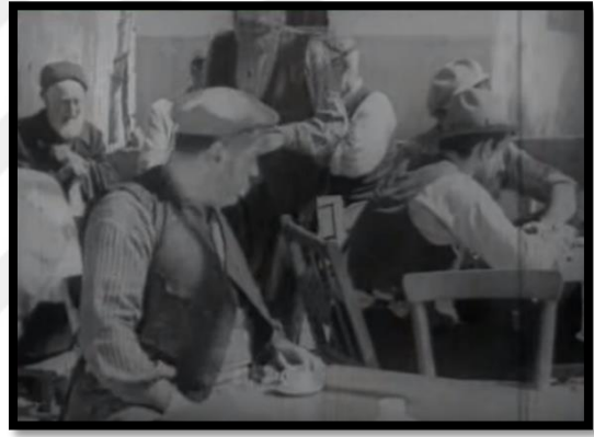
Resim-45 Yurda Dönüş- Köy Kahvesi