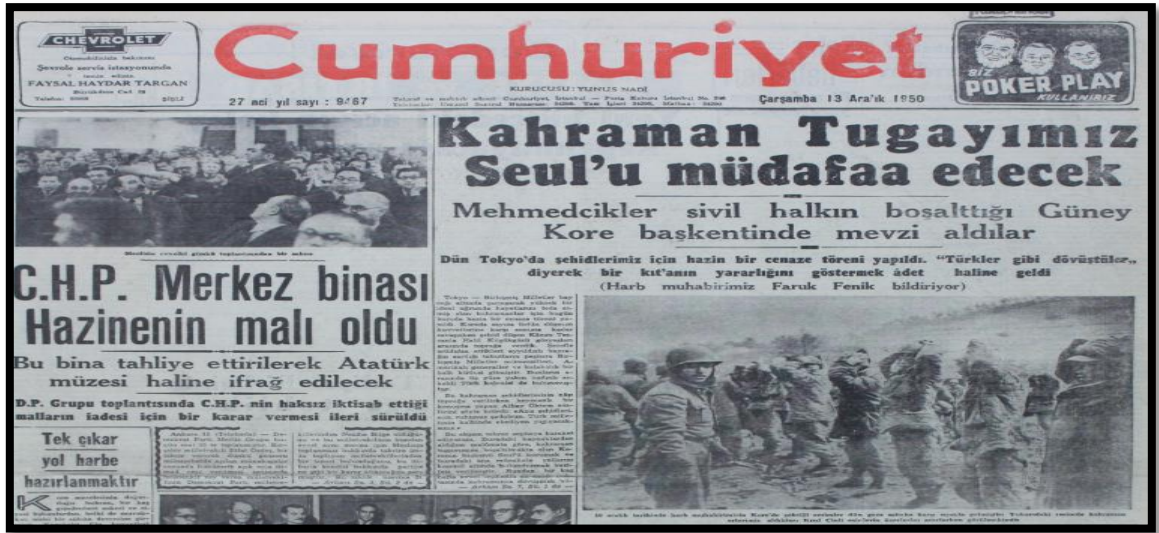
Resim-20. 13 Aralık 1950 Cumhuriyet Gazetesi

13 Aralık 1950 tarihli Cumhuriyet'te manşetten verilen " Kahraman Tugayımız Seul'u Müdafaa Edecek " haberi Türk birliğinin savaşta aktif rol oynadığına ve önemli başarılar kazandığına vurgu yapmıştır. Savaş muhabiri Fenik, " Türkler gibi dövüştüler " sözünün Kore'de yaygın şekilde diğer milletler tarafından kullanıldığını belirterek Türk birliğinin başarılarını ön plana çıkarmıştır.