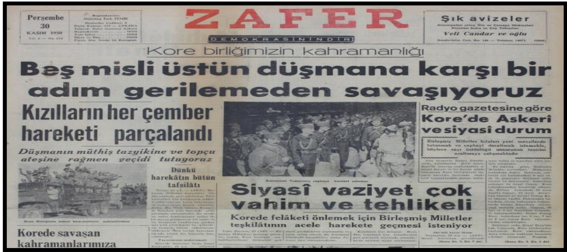
Resim-12. 30 Kasım 1950 Zafer Gazetesi

Zafer'in 30 Kasım 1950 tarihli baskısında Türk ordusunun üstün başarıları "Beş misli üstün düşmana karşı bir adım gerilemeden savaşıyoruz" başlığı ile verilmiştir. Haberin alt başlığında "Kızılların her çember hareketi parçalandı" şeklinde verilen haberde Türk tugayının başarıları verilerek cephe gerisindeki halkın zafere olan inancını yüksek tutmak amaçlanmıştır.