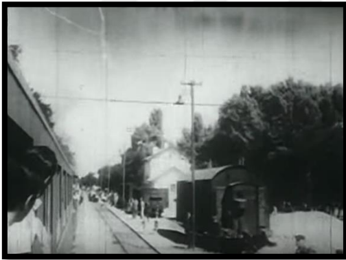
Resim-52 Zafer Güneşi- Askerlerin Uğurlandığı Tren Garları

Filmde kullanılan askeri karargâhlar, cepheler ve savaşın etkisiyle yıkılmış şehirler ana mekânları oluşturur. Çalışmada değerlendirilen diğer filmlerde olduğu gibi savaşın yaşandığı coğrafyanın da özelliklerini barındırır. Yer yer geniş bozkırlar, akarsular da izleyiciye sunulur. Filmin hemen girişinde kullanılan Kore'ye askerlerin gittiği tren garları da önemli mekânlardandır.