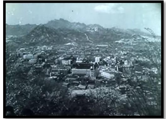
Resim- 62 Şimal Yıldızı- Şehir Genel Görüntüsü