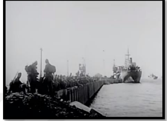
Resim-34 Kore'de Türk Süngüsü- İskenderun Limanı

Filmde kullanılan bir başka önemli mekân da camiidir. İnsanlar Kore'de savaşan Türk askerleri için dua etmek için camilerde toplanmaktadır. İnsanların din olgusu üzerinden milliyetçilik duygularına hitap edilmiştir. Türk bayrağı önünde Kur'an okuyan insanlar camii çıkışlarında Kore Savaşı ile ilgili haberleri tartışıp yorumlamaktadır. Filmdeki karakterlerin söylemlerinde milliyetçilik ve vatanseverlik duygusu ön plandadır. Bu durumda yönetmenlerin Kore Savaşı'na bakış açısını yansıtmaktadır. Bu mekân Türk toplum yapısını yansıtmaya amacını desteklemektedir. Türk insanının dinine ve vatanına bağlılığı, dolayısıyla görevine yüklediği kutsallık vurgulanarak, Kore Savaşı'na katılmanın vatanseverlik ve dindarlıkla ilişkisi kurulmaktadır.