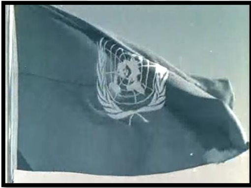
Resim-63 Şimal Yıldızı- Kore’de Birleşmiş Milletler Bayrağı

Filminde Kuzey Kore’nin, Güney Kore’ye haksız gerekçelerle nasıl saldırdığı ve Birleşmiş Milletler’in Güney Kore’nin yanında savaşa girmesinden övgü ile bahsedilmiştir ve Türk askerinin Birleşmiş Milletler’le birlikte savaşa katılmasına değinilmiştir. Bu hususla ilgili “ Türk topçusu düşman hatlarında taş üstünde taş bırakmıyor. Hâlâ ateşe hizmet eden küstah düşman askerlerini susturuyor ” denilmiştir.