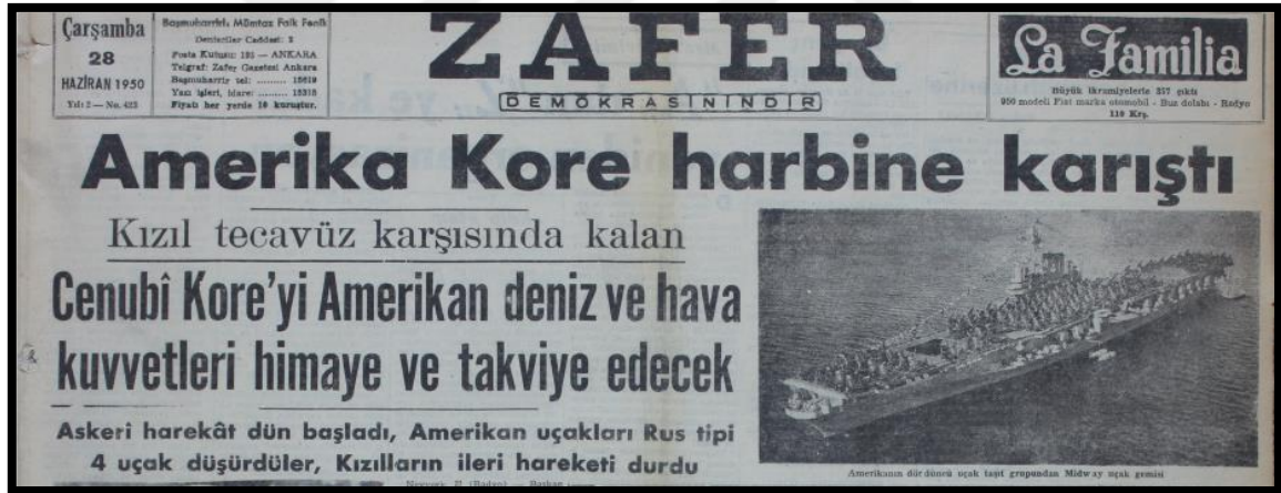
Resim-4. 28 Haziran 1950 Zafer Gazetesi