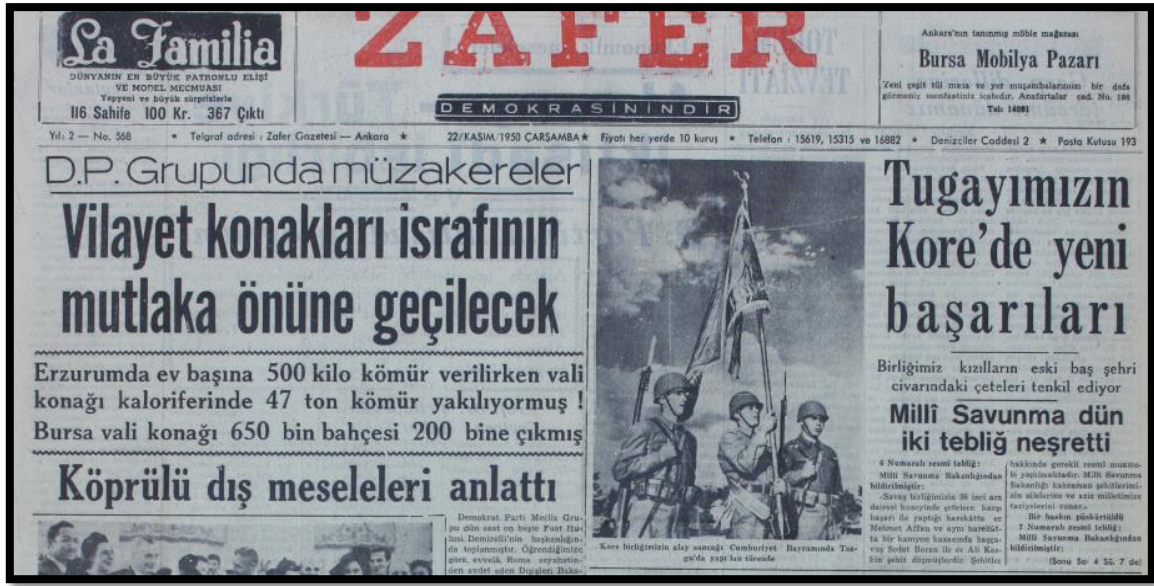
Resim-9. 22 Kasım 1950 Zafer Gazetesi

Zafer Gazetesi'nin 22 Kasım 1950 tarihli "Tugayımızın Kore'de yeni başarıları" başlığıyla verilen haberde Türk tugayının başarılarından bahsedilmiştir. Türkiye'nin savaşa girmesinin haklılığı ve gösterdiği başarılar ön plana çıkartılarak, muhalefetin haksızlığına gönderme yapılmıştır. Haberin devamında büyük zorluklara rağmen Türk birliğinin, düşman saldırılarını boşa çıkardığı ve bununla da yetinmeyip düşmana zayıf verdiğine vurgu yapılmıştır. Haberde kullanılan görselde Türk sancağını taşıyan askerler okuyucuya sunulmuş ve Türk askerinin güçlü duruşu gösterilmeye çalışılmıştır.