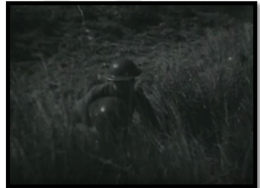
Resim-53 Zafer Güneşi- Kore'de Türk Askeri