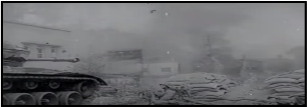
Resim-32 Kore’de Türk Süngüsü- Kore Kentleri (Arşiv Görüntüsü)

Kore’de Türk Süngüsü filminde konusu gereği Kore Savaşına ait cepheler, mevziler, Kore kentlerinin savaş yüzünden harabeye dönmüş binaları ve Türk halkının Kore’ye giden Türk askerleri için dua ettiği cami filmin temel mekânsal görüntüsünü oluşturmaktadır. Bu görüntüler Kore Savaşı muhabirlerinin edindiği arşiv görüntüleridir.