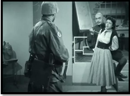
Resim-65 Şimal Yıldızı- Karakol Baskını

milletimi kırdıracaktınız” der. Bu söylem Can Bey’in bakış açısını görmek açısından önemlidir.