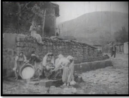
Resim- 46 Yurda Dönüş- Köylü Kadınların Çamaşır Yıkaması