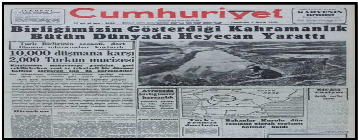
Resim-16. 2 Aralık 1950 Cumhuriyet Gazetesi

Katılma kararının alınmasında NATO’ya üyelik hususunun etkili olduğu “Atlantik Paktı’na alınma ihtimalimiz var” başlıklı haberde görülmektedir. Cumhuriyet Gazetesi, muhalefet tarafından eleştirilen Kore Savaşı’na katılma konusunda hükümete açık destek vererek, savaş süresince sürekli Kore ile ilgili haberler, köşe yazıları, ek bültenler ve fotoğraflarla kamuoyu oluşturmaya çalışmıştır.