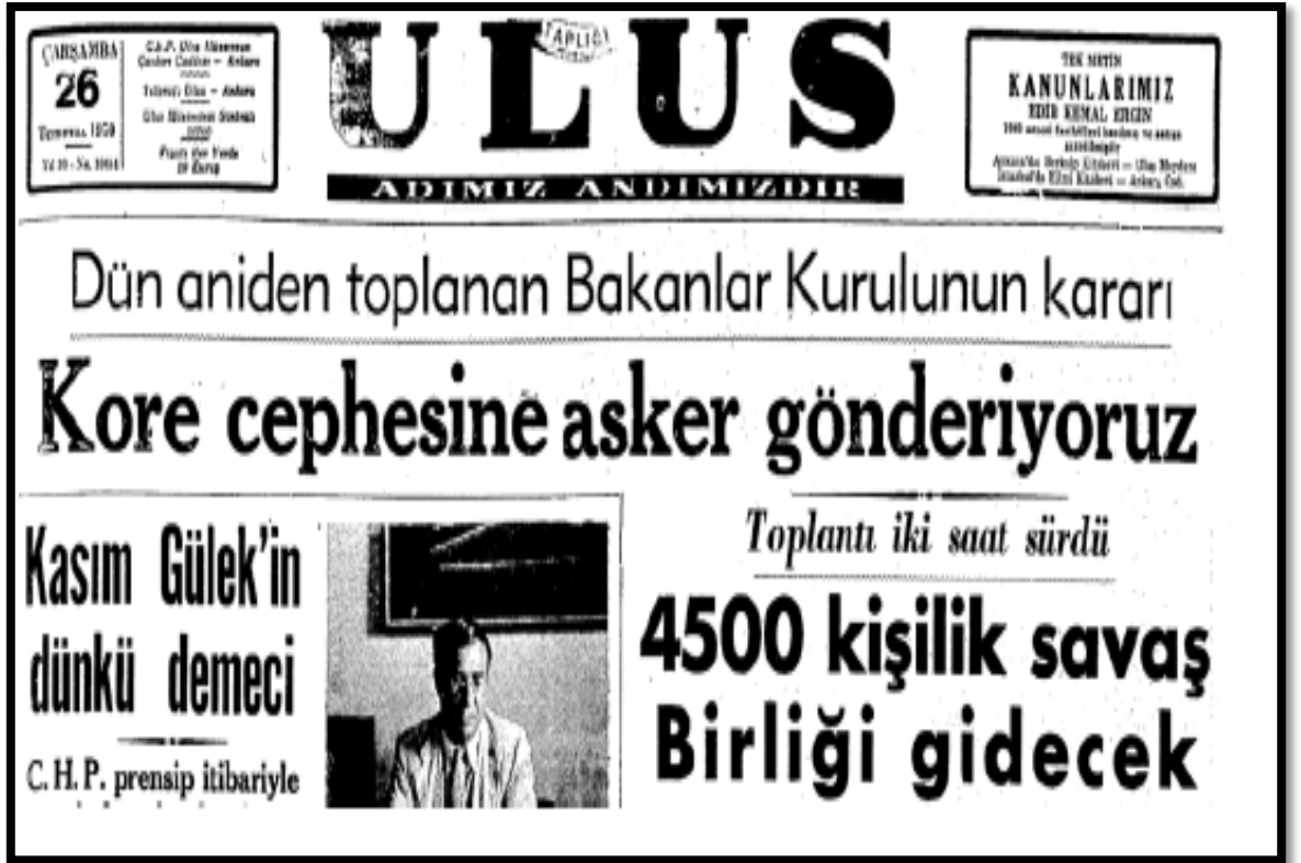
Resim-22. 26 Temmuz 1950 Ulus Gazetesi

1950’li yıllarda siyasi partiler kendi ideolojilerini yaymak ve kendi lehlerine kamuoyu oluşturmak için dönemin en etkin iletişim aracı olan gazetelerden yararlanmışlardır. Ulus Gazetesi yayın politikasını CHP’nin ideolojileri ve menfaatleri doğrultusunda şekillendirmiş ve muhalefetin yayın organı olmuştur.