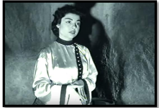
Resim-56 Şimal Yıldızı- Yıldızhan