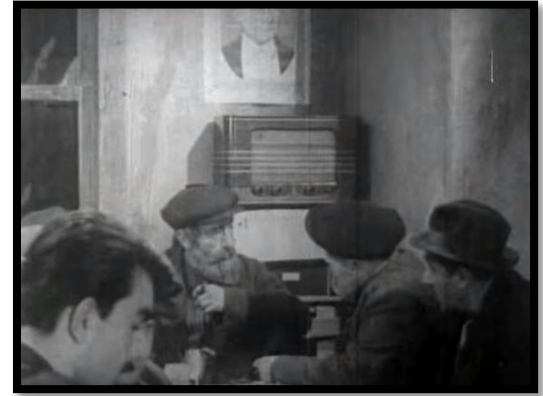
Resim-49 Yurda Dönüş- Köy Kahvesinde Radyo Dinleyenler