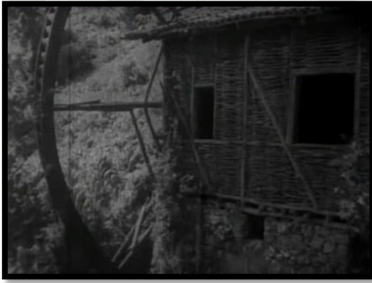
Resim-44 Yurda Dönüş- Değirmen

Film Anadolu'da bir köyde geçmektedir. Filmde köy yaşantısında karşılaşılabileceğimiz tüm mekanlar kullanılmıştır. Bunlara, kahvehane, eski köy evleri, tarım arazileri, değirmen gibi taşra yaşantısında görülen mekanlar örnek verilebilir. Bu mekanlar dönemin yaşantısı hakkında fikir vermektedir.