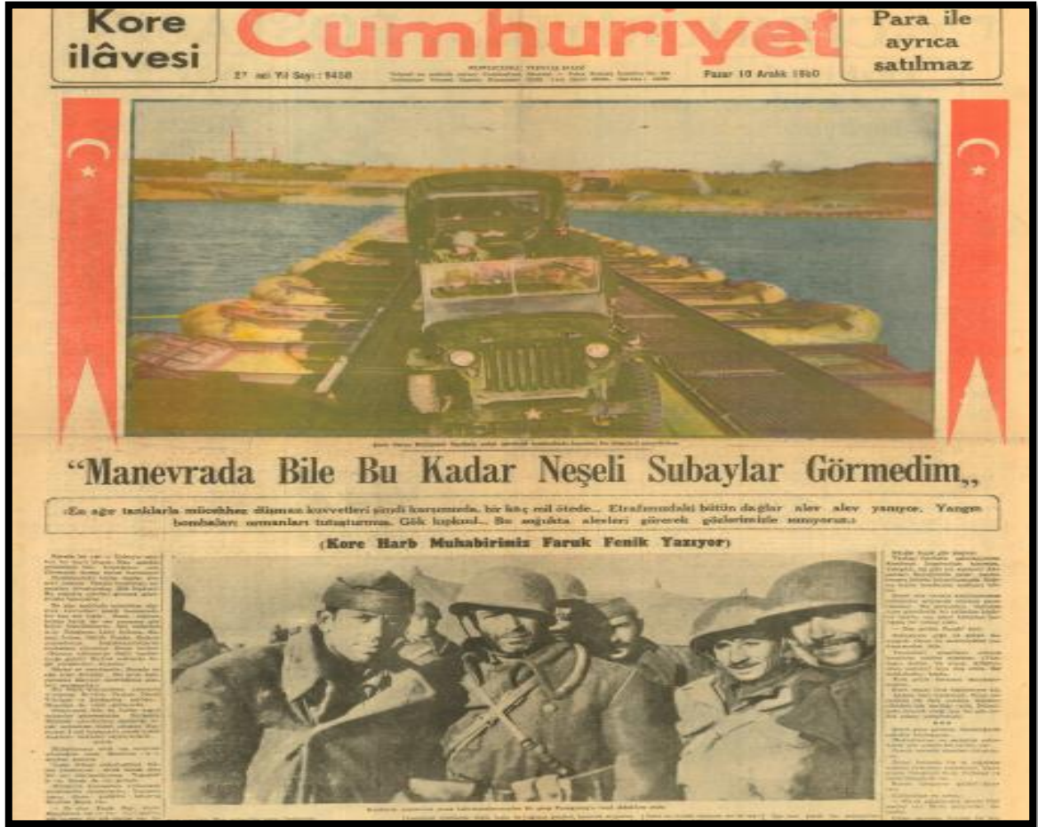
Resim-19. 10 Aralık 1950 Cumhuriyet Gazetesi

okuyuculara duyurulmuştur. Gazetenin üçüncü sayfası tam sayfa Kore Savaşı'na ayrılmıştır. Faruk Fenik, Zafer Gazetesi'ne olduğu gibi Cumhuriyet Gazetesi'ne de yazılar yazmış ve savaş ile ilgili insanları bilgilendirmiştir. Faruk Fenik'in yazısında Türk askerinin başarıları ayrıntılı bir şekilde okuyucuyla buluşmuştur. Cumhuriyet'in uyguladığı bu politika Demokrat Parti tarafından takdirle karşılanmış ve desteklenmiştir.