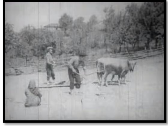
Resim- 47 Yurda Dönüş- Tarla Süren İnsanlar