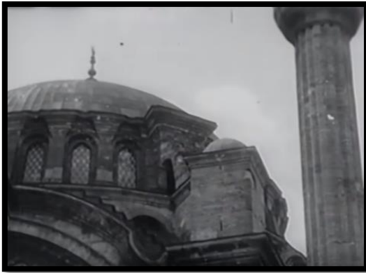
Resim-35 Kore'de Türk Süngüsü-Cami

Filmde kullanılan bir başka önemli mekân da camiidir. İnsanlar Kore'de savaşan Türk askerleri için dua etmek için camilerde toplanmaktadır. İnsanların din olgusu üzerinden milliyetçilik duygularına hitap edilmiştir. Türk bayrağı önünde Kur'an okuyan insanlar camii çıkışlarında Kore Savaşı ile ilgili haberleri tartışıp yorumlamaktadır. Filmdeki karakterlerin söylemlerinde milliyetçilik ve vatanseverlik duygusu ön plandadır. Bu durumda yönetmenlerin Kore Savaşı'na bakış açısını yansıtmaktadır. Bu mekân Türk toplum yapısını yansıtmaya amacını desteklemektedir. Türk insanının dinine ve vatanına bağlılığı, dolayısıyla görevine yüklediği kutsallık vurgulanarak, Kore Savaşı'na katılmanın vatanseverlik ve dindarlıkla ilişkisi kurulmaktadır.