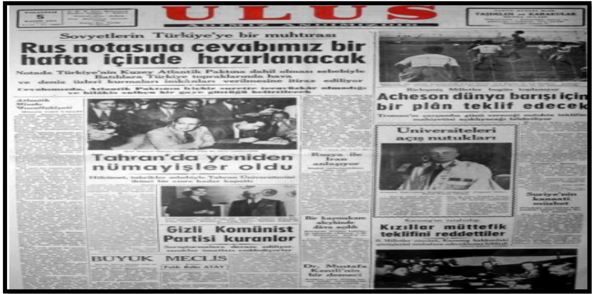
Resim-25. 5 Kasım 1950 Ulus Gazetesi