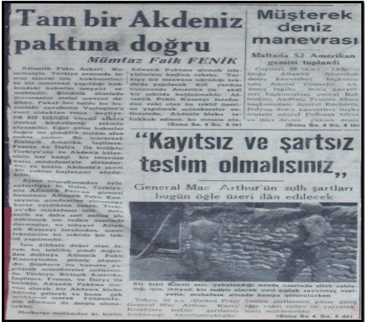
Resim-8. 1 Ekim 1950 Zafer Gazetesi

Zafer Gazetesi'nin 2 Ağustos 1950 tarihli haberinde "Kore'ye yardım etmeyen devletlere yapılan iktisadi yardım kesiliyor" haberini manşetten vermiştir. Haberde Türkiye'nin savaşa katılmaması durumunda aldığı yardımların kesileceğine ve daha zor günlerin ülkeyi beklediğine vurgu yapılmaya çalışılmış ve hükümetin savaşa katılma kararının haklılığı ön plana çıkarılmaya çalışılmıştır. Ayrıca haberin devamında ABD'nin yanında savaşa dâhil olmayan ülkelerin komünist damgası yiyeceği belirtilmiştir.