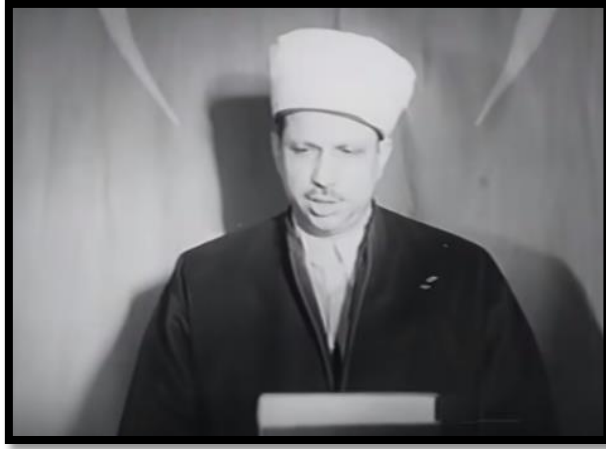
Resim-39 Kore'de Türk Süngüsü- Cami

ve askerler için Kur'an okuma sahneleri yönetmenin olaya manevi bir bakış açısı ile yaklaştığını ortaya koyar.