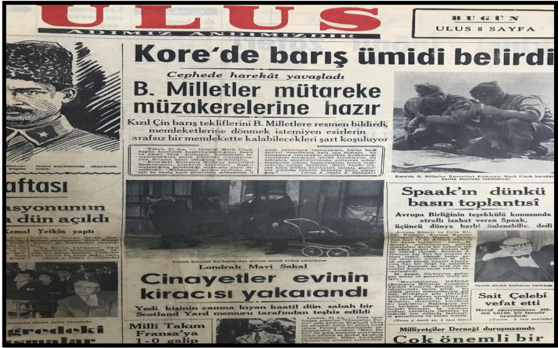
Resim-27. 1 Nisan 1953 Ulus Gazetesi

Ulus Gazetesi'nin 27 Şubat 1953 tarihli baskısında, Kore Savaşı esnasında yaşanan çatışmalar "Kore'de deniz ve kara harekâtı" başlığı ile duyurulmuştur. Haberin içeriğinde harekâtla ilgili ayrıntılı bilgiler verilmiştir.