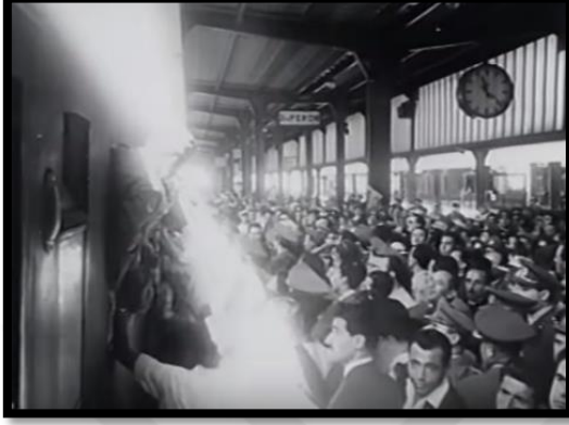
Resim- 33 Kore'de Türk Süngüsü- Tren Garı

Filmde insanların askerleri uğurladığı tren garı ve İskenderun Limanı da önemli mekânlardır. Halk burada askerleri büyük bir coşku ve sevinçle Kore'ye uğurlamaktadır. Askerler büyük bir mutluluk içinde önce tren garından trene biner, ardından da İskenderun Limanı'ndan Kore'ye doğru yola çıkarlar. Bu görüntülerle Türk halkının, söz konusu vatan ve asker olunca, nasıl coşkulu ve istekli olduğu vurgulanmıştır.