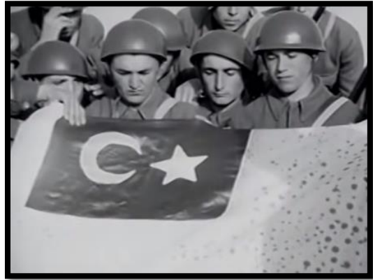
Resim-41 Kore'de Türk Süngüsü-Türk Bayrağını Öpen Türk Askerleri

Türk askerlerinin kahramanlık ve başarılarının dünya tarafından takdirle karşılandığı film boyunca sık sık tekrarlanmıştır. Kore'de savaşan Türk askerlerinin Türk bayrağını öpmesi milliyetçi söylemleri desteklemektedir.