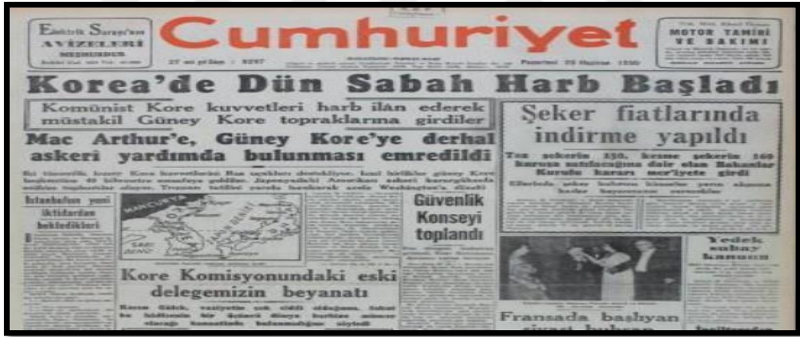
Resim-14. 26 Haziran 1950 Cumhuriyet Gazetesi