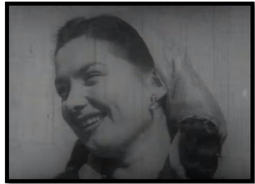
Resim-43 Yurda Dönüş - Güllü