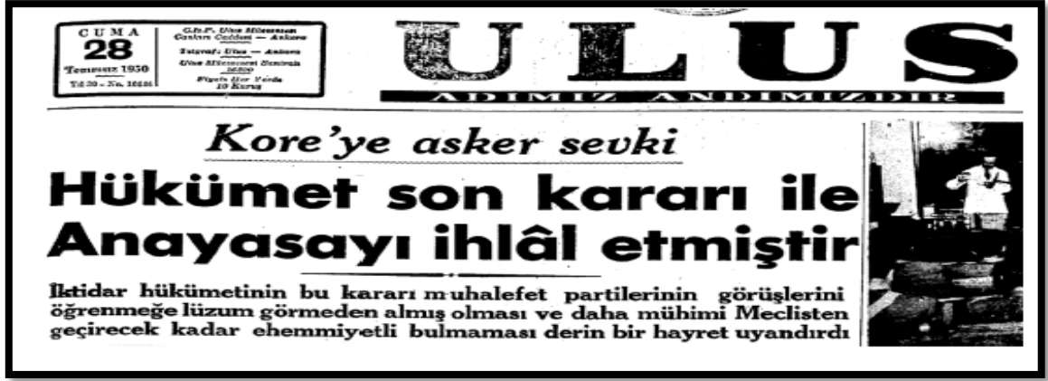
Resim-23. 28 Temmuz 1950 Ulus Gazetesi

Ulus, 28 Temmuz tarihli baskısında “ Hükümet son kararı ile anayasayı ihlal etmiştir ” başlığı ile verdiği haberde, hükümetin aldığı karara tepki göstermiştir. Türkiye ilk defa kendi topraklarından uzak bir coğrafyaya asker gönderme kararı almıştır. Hükümetin bu kararı muhalefetle tartışmadan ve meclisten geçirmeden alması anayasaya aykırı bir hamle olarak değerlendirilmiş ve muhalefet tarafından sert bir dille eleştirilmiştir. Gazetede bu konuyu destekleyen Hukuk Profesörü Nihat Erim’in “ Anayasa karşısında hükümetin kararı ” başlıklı yazısı yayınlanmıştır. Erim, yazısında özetle Birleşmiş Milletler’in anayasası ile Türk anayasasını karşılaştırarak, harp ilan etme yetkisinin Meclis’te olduğunu belirtmiş ve hükümetin aldığı kararın anayasaya aykırı olduğunu savunmuştur. Yine aynı tarihte Feridun Osman Menteşoğlu “ Bir olupbittiden sonra ” başlıklı köşe yazısında kullandığı “ Türk milleti için tam bir emrivaki şekilde tecelli etmiş... ” şeklindeki ifadelerle böylesine önemli bir kararın Meclis’ten geçirilmemiş olmasını benzer cümlelerle eleştirmiştir.