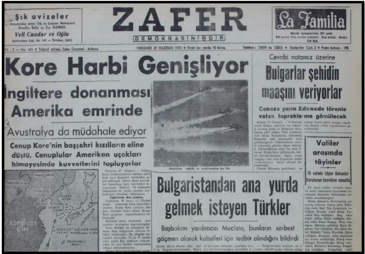
Resim-5. 29 Haziran 1950 Zafer Gazetesi

Bu düşünceyi haberde verilen fotoğraf da desteklemektedir. Verilen fotoğraf silahlarla donatılmış ABD'ye ait bir uçak gemisidir. Haberin içeriğinde Amerikan savaş uçaklarının Ruslara ait 4 uçağı düşürdüğü belirtilmiş ve haberde verilen bu ayrıntılarla savaşın seyrinin değişeceği izlenimi okuyuculara verilmeye çalışılmıştır.