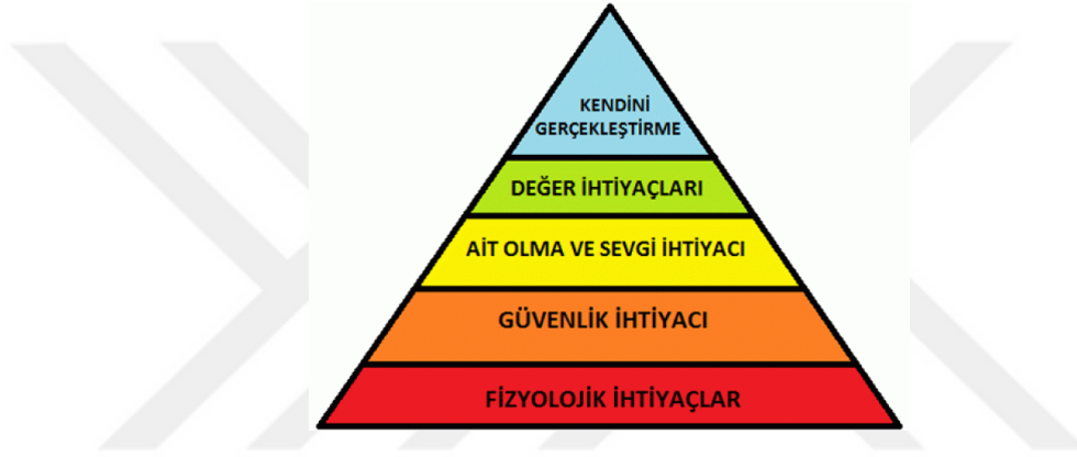
Resim-1. “Maslow’un İhtiyaçlar Piramidi”

dünyanın her yerinde ihtiyaçlarını temin edemediğinde bu durumun çatışmaya yol açtığı görüşünü savunmuştur (Malthus, 2018: 211). Burton'a göre terörizm ve savaş gibi tüm toplumsal eylemlerin temelinde ihtiyaçları karşılama düşüncesi yatmaktadır. Temel insani ihtiyaç teorisi, Aristo'dan Marks'a, Freud'a kadar birçok düşünür ve bilim insanı tarafından ihtiyaç mahrumiyetinin insanlar arası ilişkilerdeki olumsuz etkilerinden bahsetmiştir. Ama insanların ihtiyaçlarının ve bu ihtiyaçlardan mahrum kalmanın meydana getireceği sonuçları sistemli bir yapı haline getiren de Abraham Maslow'dur. Maslow ihtiyaçlar hiyerarşisi kavramını ortaya atmıştır. Bu kavrama göre, insanın yaşamı boyunca motivasyonunu meydana getiren güdülerinin kendi içerisinde bir sistemi vardır. Bunlar da 5 başlıkta toplanmaktadır.