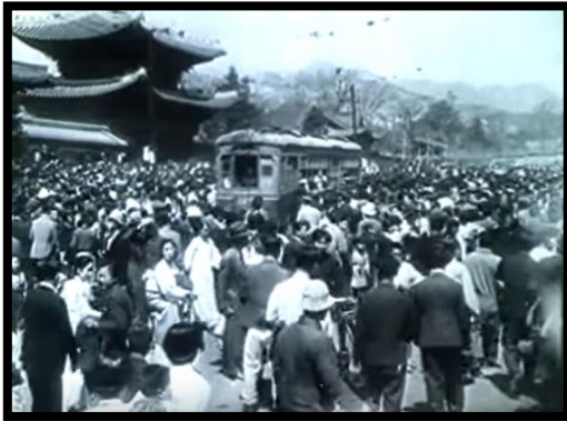
Resim-61 Şimal Yıldızı- Kore Sokakları

Ayrıca filmin devamında bombalanmış sokaklar ve askeri kamplar izleyiciye gösterilmektedir. Yine Kore'de Türk Süngüsü filminde olduğu gibi Türk askerlerinin Kore'ye gönderildiği Tren Garı ve İskenderun Limanı'na ait gerçek görüntüler filmde kullanılmıştır.