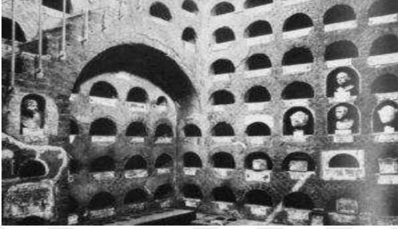
Resim 3.9. Roma Vigno Codini'deki bir yerlatı oda mezarı http://www.romeacrosseurope.com/?m=20161008#sthash.UEUC64xk.dpbs

inhumasyon gömülme biçiminden vazgeçmediğinden bahseder Plinius. İ.Ö. 78'de Sulla'nın ölümünün ardından hiçbir gömü kanıtı kalmamıştır 99 ,