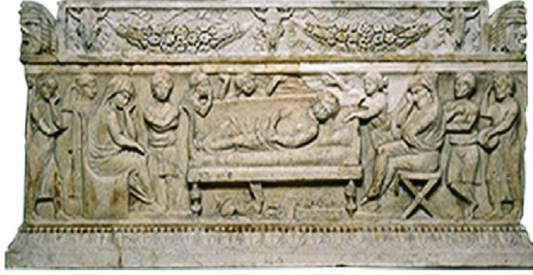
Resim 3.5. Lectus Funebris üzerine yatırılmış ölü (Akçay, 2017:126)

Ölü temizlendikten sonra ise başına bir çelenk konulmuştur. Ölülerin kayıkçısı olarak bilinen Kharon'a verilmek üzere sosyal statüsü yüksek ölüye ağzının içerisine metal bir para yerleştirilerek togaya sarılıp en güzel giysileri giydirilmiştir 77 .