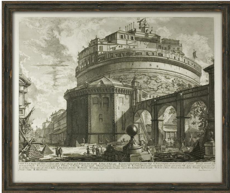
Resim 7.2. Hadrian mozolesi arkadan görünümü

Roma'nın ölüm ritüelleri, modern psikoloji ve sosyal bilimler açısından da önemli bulgular sunmaktadır. Antik Roma'da yapılan ritüeller, bireylerin kayıplarını kabul etmesine ve yas sürecini daha sağlıklı bir şekilde yönetmesine yardımcı olmuştur. Bu ritüeller, toplumdaki dayanışmayı pekiştirirken, bireylerin yas sürecini anlamalarına ve kabullenmelerine de katkıda bulunmuştur 319 .