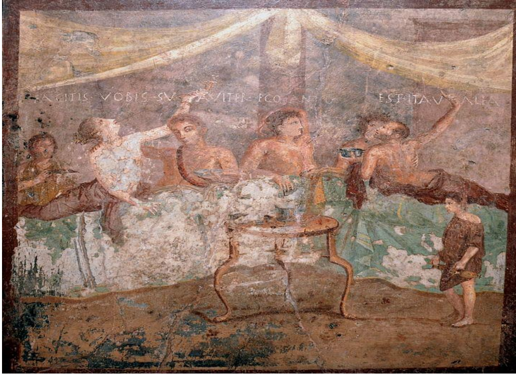
Resim 7.1. Pompeii'den bir fresk

atalarının mezarlarını ziyaret ederek adaklar sunar, bu da aile içi bağları güçlendirir ve toplumsal birlikteliği pekiştirirdi 304 .