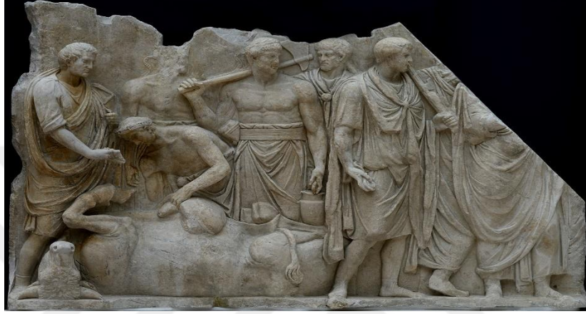
Resim 3.4. Kurban görevlileri (victimarius)

Victimarius, bu görevi özenli bir şekilde yerine getirerek ritüelin kutsal doğasına saygı duyan önemli bir kriterdi. Önemli olmasının sebebi Roma toplumunda kurban törenlerinin dini ve sosyal yaşamın mekezinde yer almasıdır 68 .