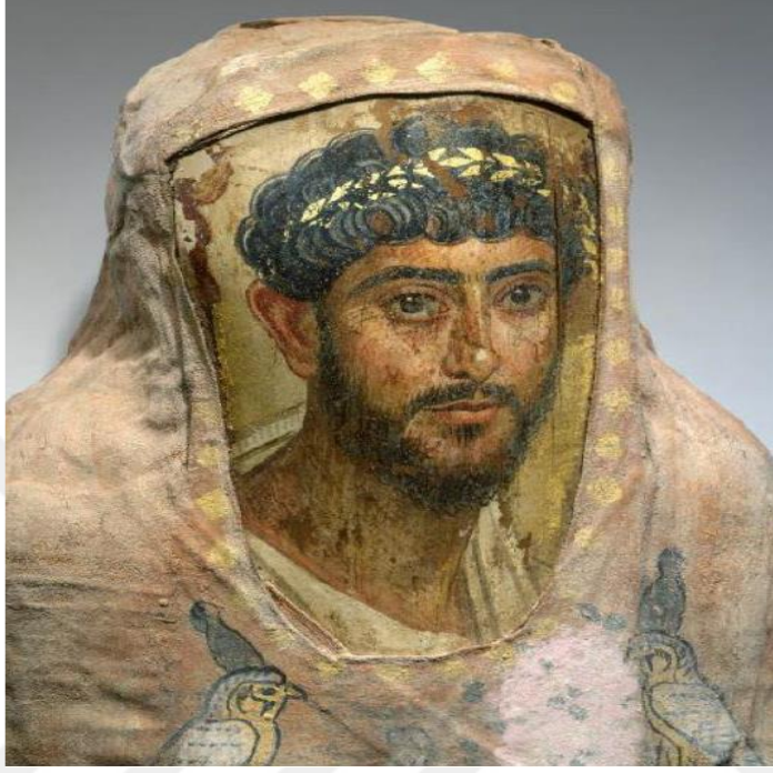
Resim 3.10. Fayyum Portreleri

tanesi ankostik olarak adlandırılan sıcak balmumu tekniğidir. Bu teknikte balmumu az da olsa yağ ile karıştırılarak fırça darbeleriyle resim tamamlanır. Diğer bir teknik olan temperada ise yumurta, su, balmumu, tutkal bağlayıcı olarak kullanılır. Bu teknik hızlı kuruması ve uzun ömürlü olması dolayısıyla daha çok tercih edilmiştir 105 .