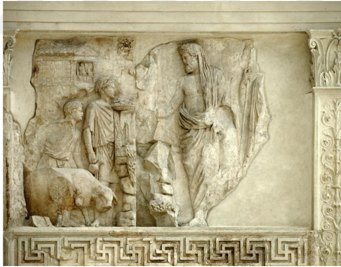
Resim 3.3. Ara Pacis'in kabartmalarındaki Aeneas'ın betimi https://rdc.reed.edu/i/cce679b1-40b3-4c1a-b7e4-4d702b9d3938/full

Roma kurban ritüeli hakkında bilgi edinilmesini sağlayan bir diğer örnek ise Roma'daki Capitol Müzesi'ndeki, Ara Pietatis Augustae adı ile bilinen bir altar üzerindeki kabartmalar verilebilir 66 . Altarın birinci kabartmasında toga giymiş, geleneksel başaklı başlık takmış kahinler sahnelenmiştir. İkinci ve üçüncü kabartmalarda ise iki tapınak cephesinin önünde kurban sahneleri betimlenmiştir. İkinci kabartmada yer alan görevli victimariuslar kurban baltası taşımaktadırlar. Üçüncü kabartmada ise balta darbesi ile başı kesilecek kurbanı hazırlayan bir victimarius görülmektedir 67 .