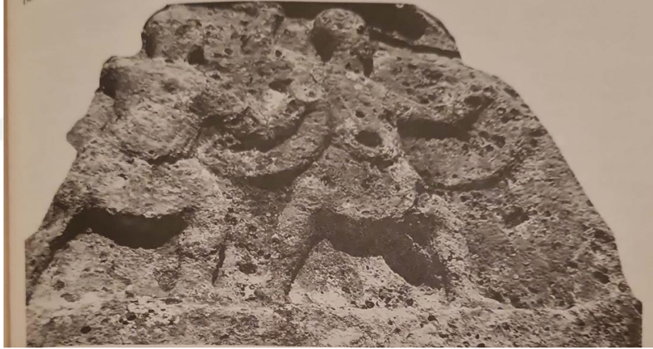
Resim 3.2. Olba'daki asker kabartması (Akçay T. 2017:123)

Roma kültürünün etkisi altında olan bölgelerde kenotaph uygulaması görülmektedir. Cilicia kentlerinden birisi olan Olba'da Tırnak Tepesi Mezarlık Alanı Batı kesiminde dikdörtgen bir nişin üzerinde yer alan kaya yüzeyine işlenmiş asker kabartması yer almaktadır. Bu kabartmada bulunan benzersiz kaya düzenlemesi, kentte bu uygulamanın varlığını doğrular niteliktedir. Başlarında miğfer bulunan iki asker kabartmada benzer duruş içerisinde sağa dönmüş ileriye doğru hamle yapar bir vaziyettedirler. Her ikisinin de sağ kolları dirsekten yukarıya kaldırılmış mızrak tutmaktadır. Göğüs zırhının altında khiton giydikleri görülmektedir. Antik Yunan'da hem günlük yaşamda hem de dini törenlerde kullanılan temel bir giysi türü olan khiton Roma'da ise Yunan kültürümü benimseyen kesimlerde kullanılmıştır. Askerler aynı zamanda sol ellerinde birer yuvarlak kalkan taşımaktadırlar 39