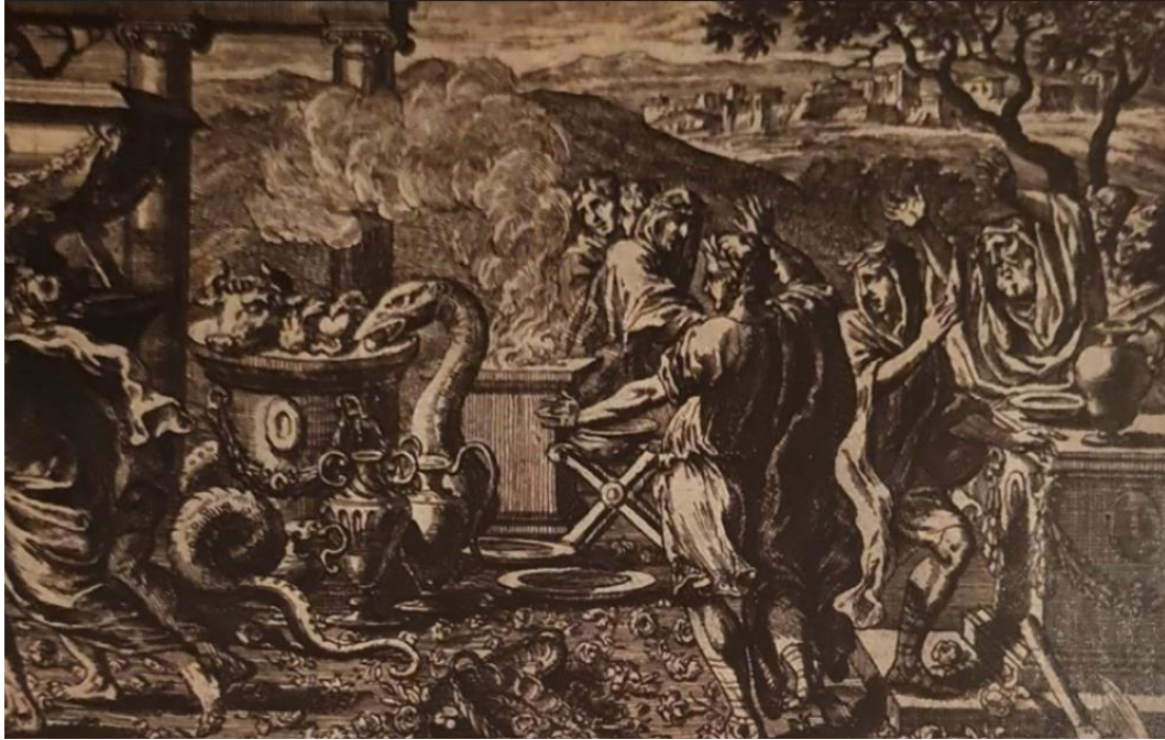
Resim 4.1. Ankhies'in mezarın başında Aeneas'ın sunular yapması (Akçay,2017:18)

Vergilius'un destanında anlatılan bu mitolojik olaylar, Roma toplumunun ölüm sonrası yaşam ve ahiret inançlarının bir yansımasıdır. Aeneas'ın ölümler diyarına yaptığı bu yolculuk, Roma'da ölüm sonrası hayatın toplum üzerindeki etkilerini anlamamıza da yardımcı olur. Vergilius'un bu tasvirleri, Roma'da ölüm sonrası yaşamın yalnızca dini bir kavram olmadığını, aynı zamanda devletin ve toplumun yapısının korunmasında da önemli bir rol oynadığını gösterir. Ölüm sonrası yaşam inancı, Roma'nın sosyal ve politik düzeniyle iç içe geçmiş bir kavramdır. Ölülerin düzgün bir şekilde anılması ve ritüellere uygun gömülmesi, toplumda barış ve düzenin devam etmesi için gerekli görülüyordu 151 .