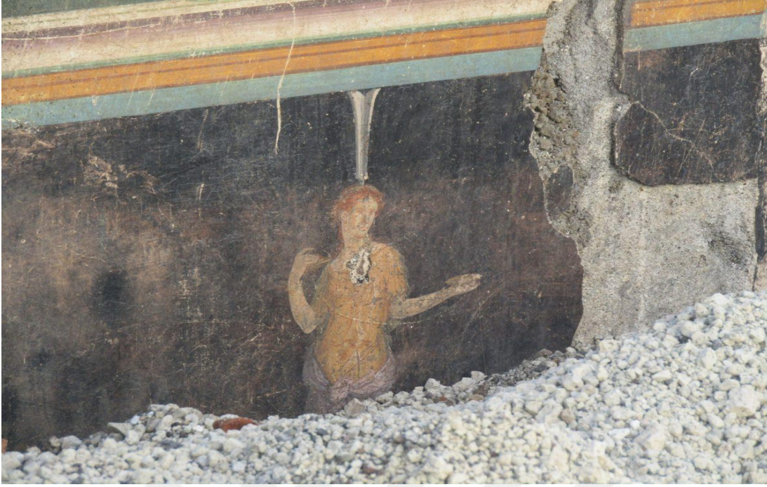
Resim 6.1. Pompeii’de keşfedilen fresklerden bir örnek https://aktuelarkeoloji.com.tr/kategori/aktuel/sicpa-turkiye-arkeoloji-ogrencilerini-kesfe-cikariyor

Mezar eşyaları, Roma toplumunda ölülerin yanında gömülen kişisel eşyalar ve adaklar, ölen kişinin sosyal statüsünü, mesleğini ve dini inançlarını yansıtmaktadır. Örneğin, asker mezarlarında bulunan silahlar ve zırhlar, askerin yaşamı ve toplumsal rolü hakkında bilgi verirken; kadın mezarlarında bulunan mücevherler ve ev eşyaları, kadının sosyal statüsünü ve aile içindeki rolünü göstermektedir. Bu tür arkeolojik buluntular, Roma'nın cenaze ritüellerinin sosyal ve kültürel boyutlarının anlaşılmasına büyük katkı sağlamaktadır 259 .