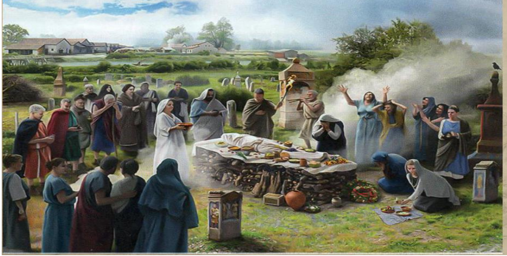
Resim 3.8. Kremasyon uygulaması

https://avys.omu.edu.tr/storage/app/public/kasim.oyarcin/135174/5.%20hafa.pdf