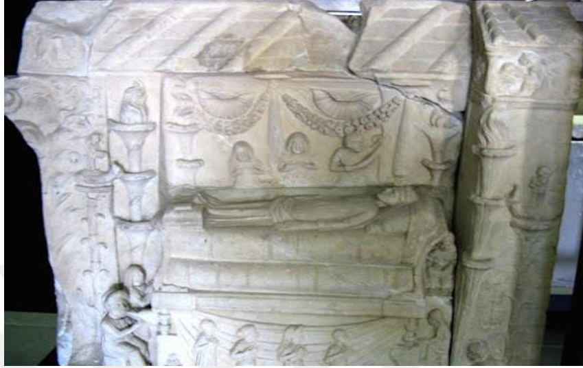
Resim 3.6. Haterii Aile Mezar Kabartması (Tyonbee 1971:9)

Bunun ölünün çenesini bağlamak içindir. Erkeğin yanında yer alan iki kadın figürünün ellerini göğüslerinde birleştirmiş olmalarından dolayı yas sürecinin başladığını ve ağıt yaktıkları anlaşılır 81 .