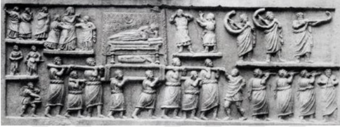
Resim 3.7. Aquila Müzesinde yer alan Amiternum Kabartması Cenaze Alayı Sahnesi (Taş, 2016: 183)

Aquila Müzesinde yer alan, Geç Cumhuriyet – Erken Augustus Dönemi'ne ait olan ve Amiternum'da bulunan bir mermer kabartma Roma cenaze alayını anlatması açısından oldukça önemlidir 85 .