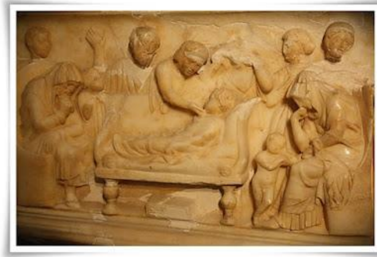
Resim 3.11. Lahit yas sahnesi

Kanunlarda gösterilen ve belli kurallara bağlanan cenaze törenlerinin düzenlenmesinde özellikle cenaze harcamaları sınırlanmaya çalışılmıştır. Ölen bir Romalının mirası, başta karısı olmak üzere çocuklarına eğer çocuğu yoksa, erkek tarafından gelen torunlara daha sonrasında baba soyundan gelen akrabalara, öncelikle erkek kardeşlere ve evlenmemiş kız kardeşlere kalırdı 111 .