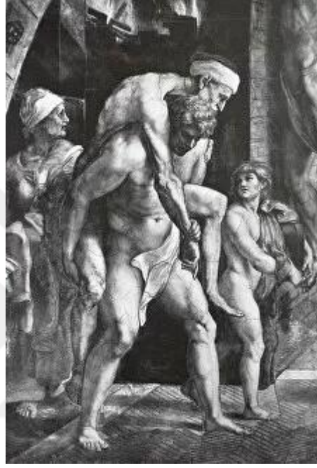
Resim 2.1. Aeneas'ın Troia'dan sırtında taşıdığı babasıyla birlikte kaışı. https://grandearte.net/raphael/flight-aneas

tarafından emzirilen çocukları bir çoban büyötmüştür. Çocuklar büyödükten sonra Amulüus'u öldürmüştür. Daha sonrasında büyödükleri yer olan Palatium Tepesi'nde yeni bir şehir kurmaya karar vermişlerdir. Romulus bir çift sığırın koşulduğıu sabanla kentin sınırını çizemeye çalışırken kardeşi Remus ile bir fikir ayrılığına düştükten sonra bir anlık öfke ile kardeşini öldürmüştür. M.Ö. 753 yılında kurulan Roma'nın yöneticisi Romulus olmuştur 14 .