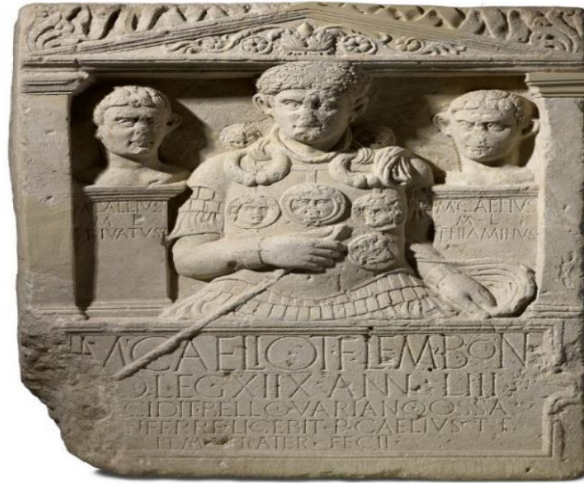
Resim 3.1. Bonn'daki Rhenisches Landesmuseum bulunan bir mezar steli https://landesmuseum-

Roma geleneğinden önemli bir yere sahip olan mezarlar, her ne olursa olsun ölünün ruhunun rahata kavuşması ve akrabaların sorumluluklarını belirlenen günlerde yerine getirmeleri için önemli bir işlev görmektedir. Bu sebeple ölü kültü ritüelleri genellikle mezar başlarında gerçekleştirilir. Bu ritüellere ölünün ruhunun da eşlik ettiğine inanılır. Örneğin bir kişi denizde boğulmuşsa veya bir savaşta hayatını kaybetmişse bu nedenle de bedeni geri gelmemişse genel kurallara göre ölen kişinin ruhu için mutlaka bir mesken diğer adıyla kenotaph yapılması gerekmektedir 37 . Yapılan bu mezarın önünde, ölen kişinin ruhunun mezara girmesi için ismi üç kez okunarak çağrıda bulunmaktadır. Buna verilebilecek örnek ise bir mezar steli olan Bonn'daki Rhenisches Landesmuseum verilebilir. Marcus Caelius'un M.S. 9'daki Varion seferi sonrasında ölü bedenini geri gelmemesi üzerine dikilen bu stelde askeri giysilerle tasvir edilen Marcus Caelius'un her iki yanında azat ettiği iki adamı da yer almaktadır. 38