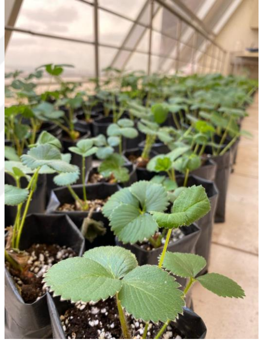
Resim 3.1.1 Denemede kullanılan çilek çeşidi