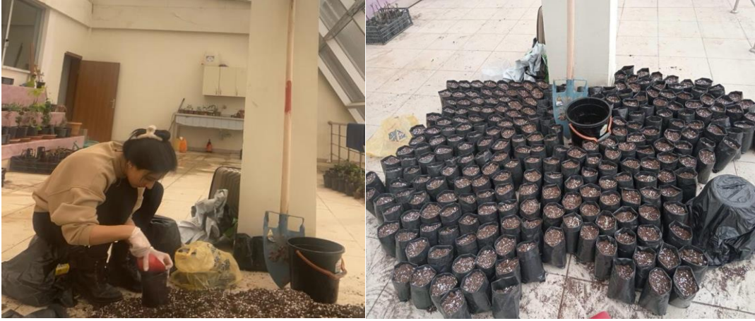
Resim 3.1.3 Yetiştirme ortamlarının hazırlanması