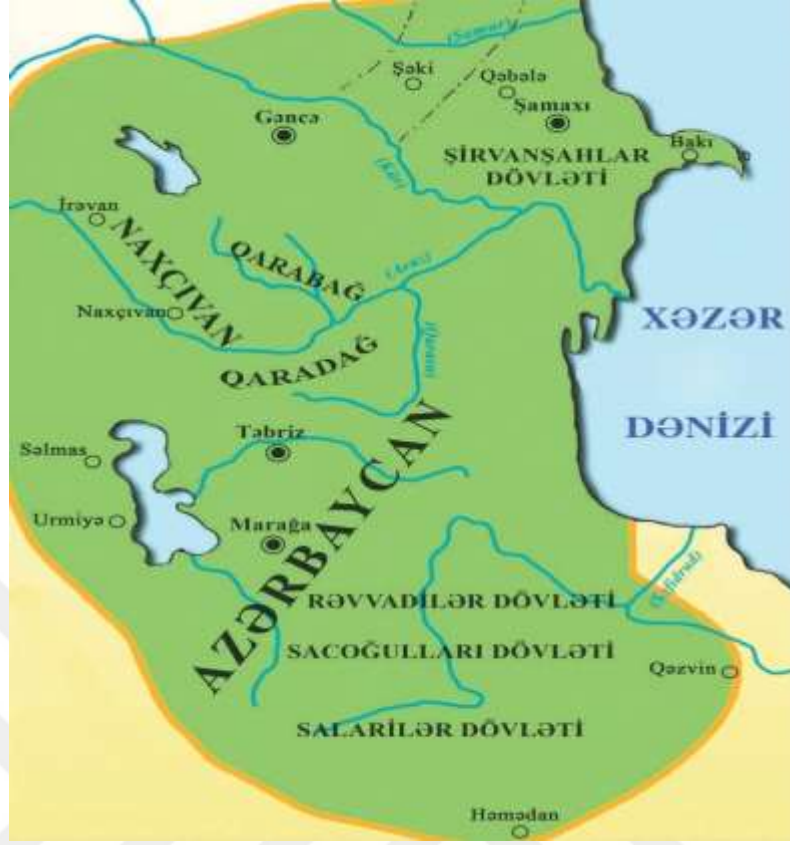
Şəkil 1.1. Gence'nin coğrafi konumu