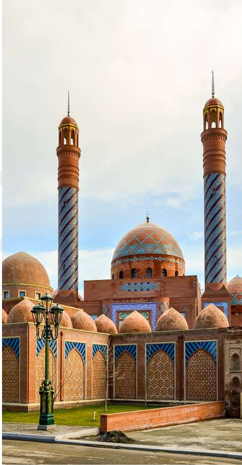
Ek 2: Gence İmamzade Türbesi