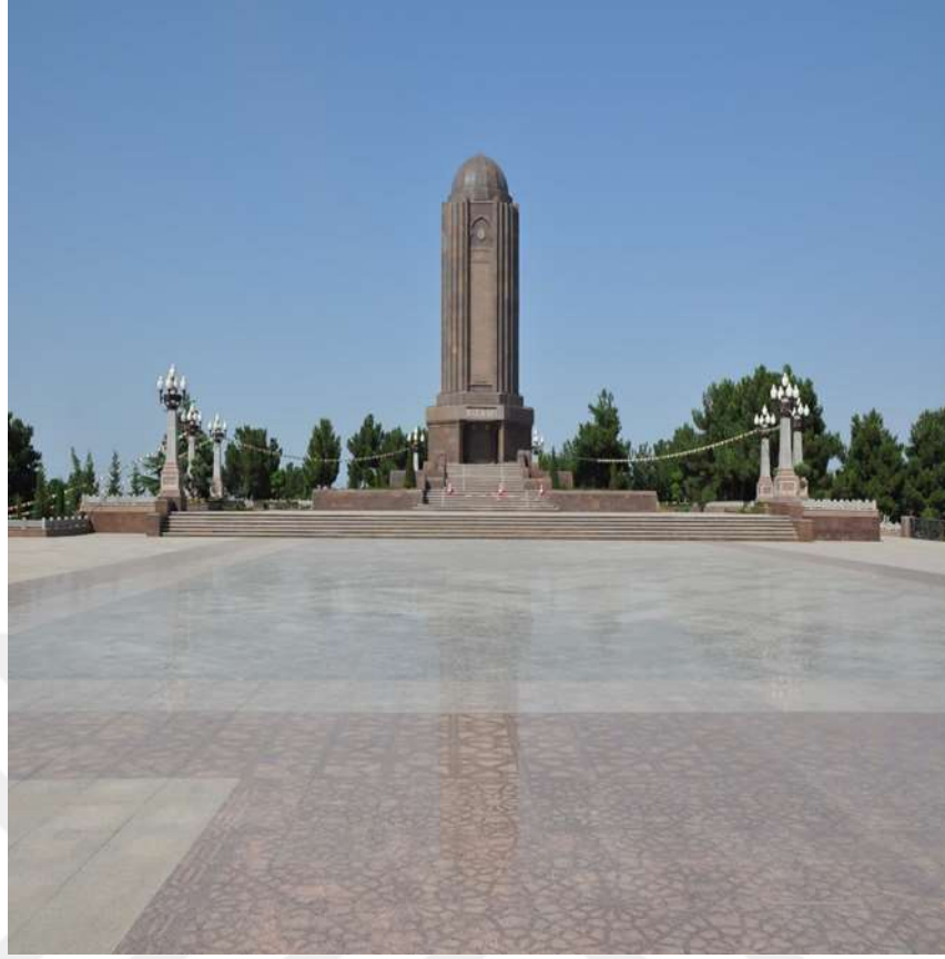
Şekil 1.3. Nizami Gencevi'nin Türbesi.

Kaynak: https://nizamiganjavi.az/nizami-ganjavi-mausoleum/