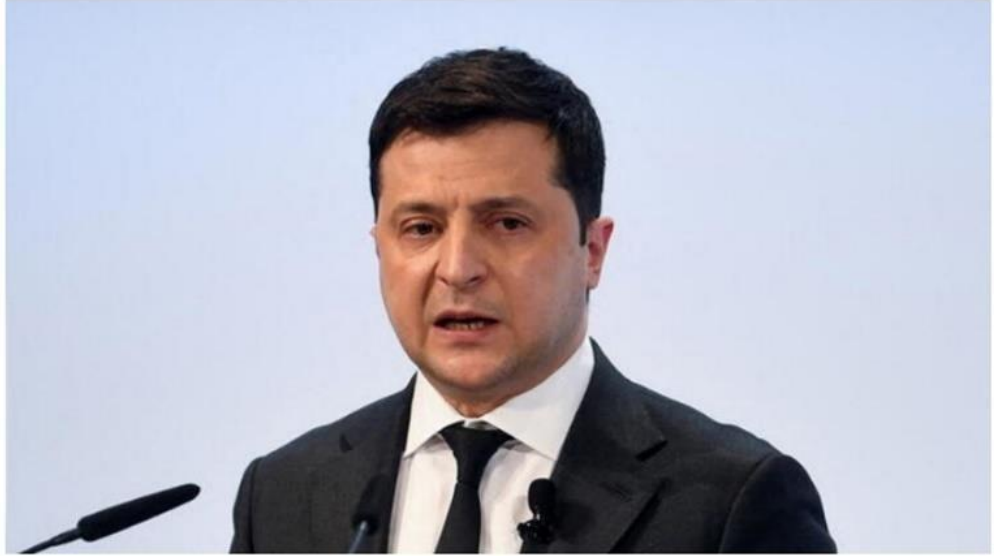
Görsel 3. T24 Örnek Haber: Zelenski, “Putin Karşıtı Koalisyon Kuruyoruz”Dedi; Erdoğan Dahil, Dünya Liderleriyle Konuştuğunu Söyledi

Zelenski, konuştuğu liderlerle Rusya'ya somut yaptırımları görüştiklerini söyledi