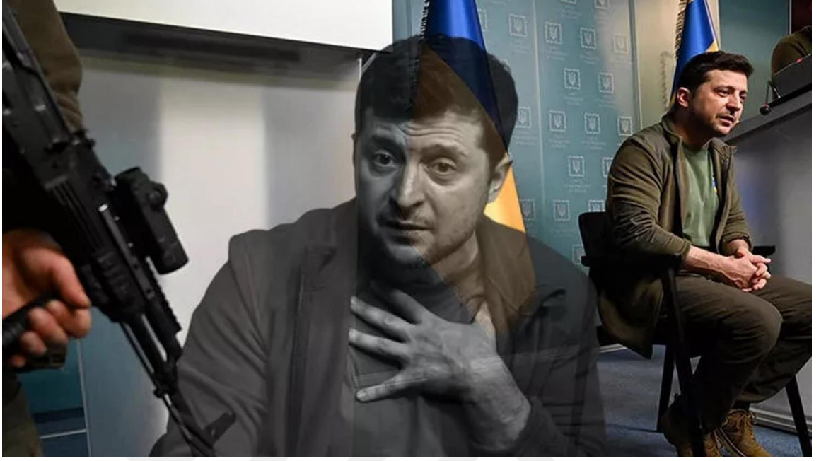
Görsel 12. Hurriyet.com.tr Haber Fotoğrafı: Zelenski

Hurriyet.com.tr Haber Başlığı: Flaş iddia: Zelenski bir haftada üç kez suikasttan kurtuldu! 14