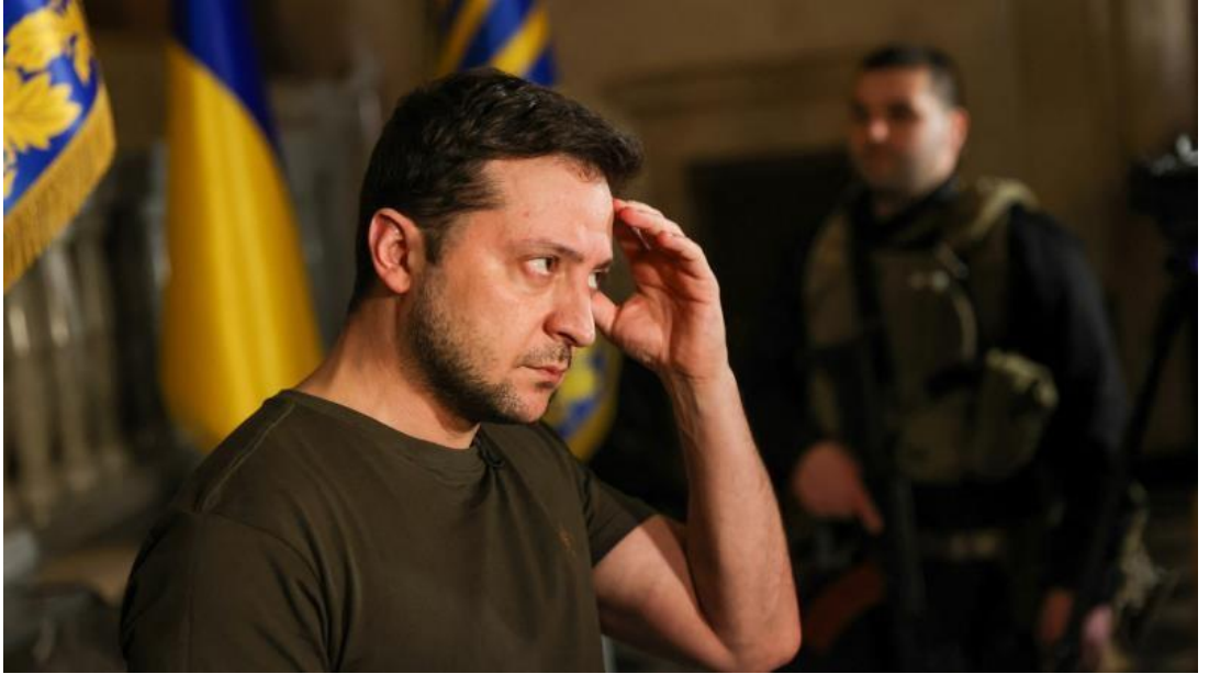
Görsel 9. Zelenski

Hurriyet.com.tr ve T24 haber sitesinin fotoğrafları örnek haber fotoğrafları seçilerek yorumlanmıştır.