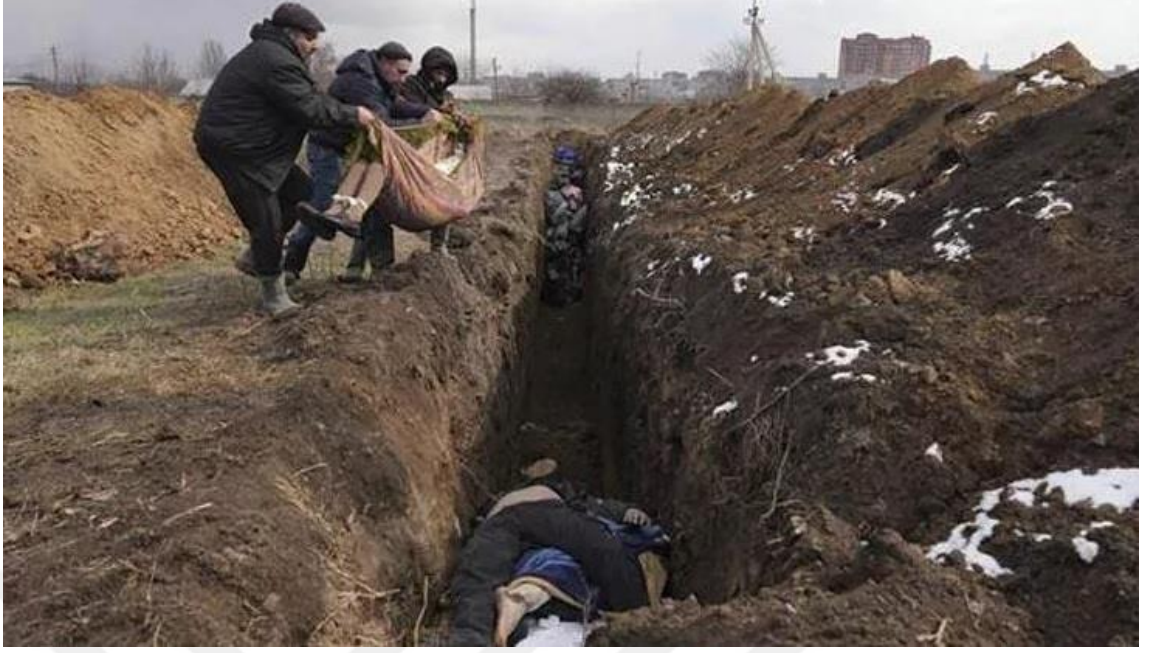
Görsel 11. Hurriyet.com.tr Haber Fotoğrafı: Cansız Bedenler

Hurriyet.com.tr Haber Başlığı: Dehşete düşüren kareler: Kanlı işgalde ölenler, toplu mezara gömüldüler