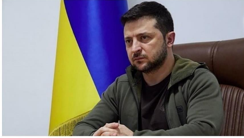
Görsel 5. T24 Örnek Haber: Zelenski 'den İstanbul'daki Müzakereye İlişkin Açıklama: Olumlu Sinyaller Var

"Bizim yok olmamız için savaşmaya devam eden bir gücün temsilcilerinin sözlerine güvenmemiz için herhangi bir nedenimiz yok"