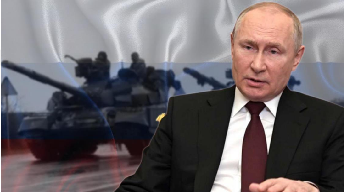
Görsel 10. T24 Haber Fotoğrafı: Putin

T24'ün haberlerinde en çok (yüzde 15,47) Ukrayna Devlet Başkanı Vladimir Zelenski'nin fotoğraflarını kullandığı tespit edilmiştir. Zelenski'nin fotoğrafları kullanılırken, herhangi bir mizansen yapılmadığı görülmektedir. Ancak, Rusya Devlet Başkanı Vladimir Putin'in paylaşıldığı bazı fotoğraflarında aşağıda görüldüğü gibi arka plana konmuş tanklar yer almaktadır. Herhangi bir çözüm önerisi olmayan, sadece insanların daha fazla nefret duymasını sağlayacak olan haber ve fotoğraflar barışa katkı sağlamamaktadır. Tam tersine çözüme olan inancı azaltıp, savaşı körüklemektedir.