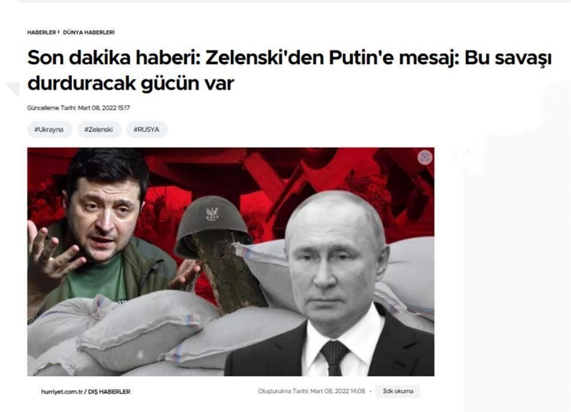
Görsel 1. Hurriyet.com.tr Örnek Haber: Zelenski'nin Putin'e Mesaj: Bu Savaşı Durduracak Gücün Var

5 kategoride değerlendirilen tüm haberler örnek haber başlıklarıyla yorumlanmıştır.