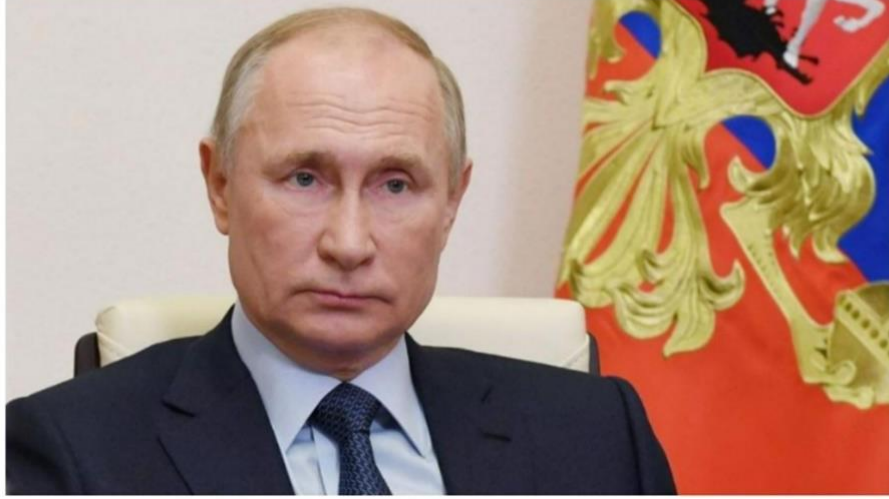
Görsel 7. T24 Örnek Haber: Güvenlik Kaynakları: Putin'in Saldırgan Tavırlarının Arkasında Kanser Tedavisi Yatıyor Olabilir

Rusya lideri Putin'in son beş yıldır davranışlarının değiştiği iddia edildi