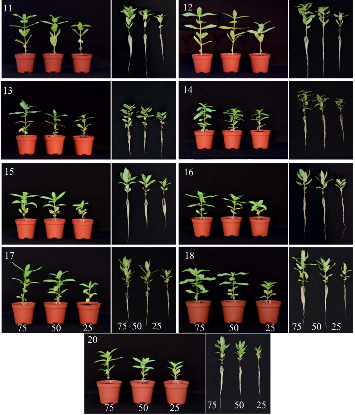
Şekil 4.3. Farklı sulama rejimleri (sırasıyla %75, 50 ve 25) uygulanan zinnia çeşitlerinin görüntüleri. 11) Ze-Scarlet, 12) Ze-White, 13) D-Za-Salmon, 14) D-Za-Yellow, 15) Za-Cherry, 16) Za-Fire, 17) Za-Red, 18) Za-White, 20) Za-Yellow.