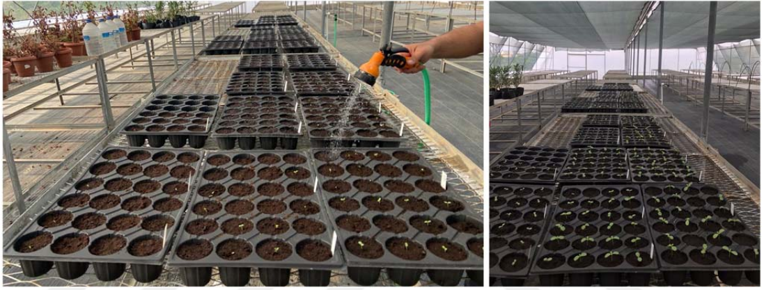
Şekil 3.1. Tohum ekimi ve çimlenme aşamasından görüntüler.

Zinnia elegans ve Zinnia marylandica çeşitlerine ait tohumlar; 24 gözlü, 34 x 50 cm dış ebat, 8 cm ağız çapı, 8 cm derinlik ve 310 cc hacim özelliklerine sahip viyoller içerisine ekilmiştir. Tohum çimlendirme ortamı olarak torf kullanılmıştır. Tohum ekimi mayıs ayının ortasında gerçekleştirilmiş ve ekimden yaklaşık 2-3 gün sonra çimlenme başlamıştır. Bu aşamadan sonra kısıtlı sulama uygulamaları başlangıcına kadar bir başka deyişle 3-4 gerçek yaprak aşamasına kadar bitkilerin gelişimi için gereken rutin sulama işlemi devam ettirilmiştir. Şekil 3.1'de tohum ekimi çimlenme aşamalarından görüntüler sunulmuştur.