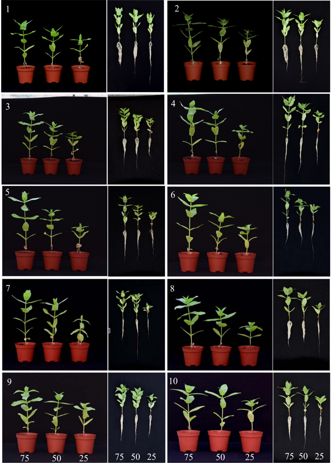
Şekil 4.2. Farklı sulama rejimleri (sırasıyla %75, 50 ve 25) uygulanan zinnia çeşitlerinin görüntüleri. 1) D-Coral, 2) D-Ivory, 3) D-Pink, 4) D-Red, 5) D-Rose, 6) D-Scarlet, 7) D-Yellow, 8) Ze-Fuchsia, 9) Ze-Pink, 10) Ze-Purple.