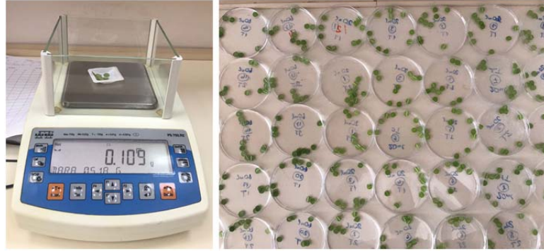
Şekil 3.4. Yaprak oransal su kapsamı analiz aşamasından görünümüler.