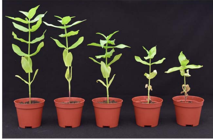
Şekil 3.3. Görsel semptom skala değerlendirmesine yönelik olarak örnek bitkilerin görünüşleri. (soldan sağa doğru 1'den 5'e puanlama sırası)