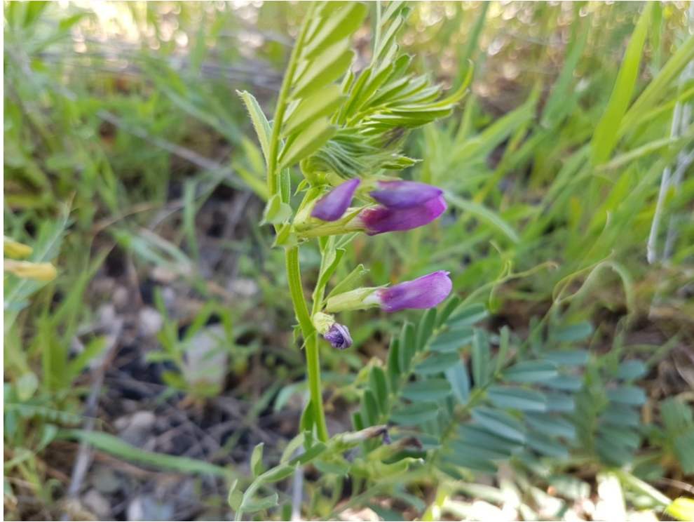
Şekil 3.10. Vicia sativa L. subsp. sativa (Merkez / Diyarbakır, 20.04.2018)