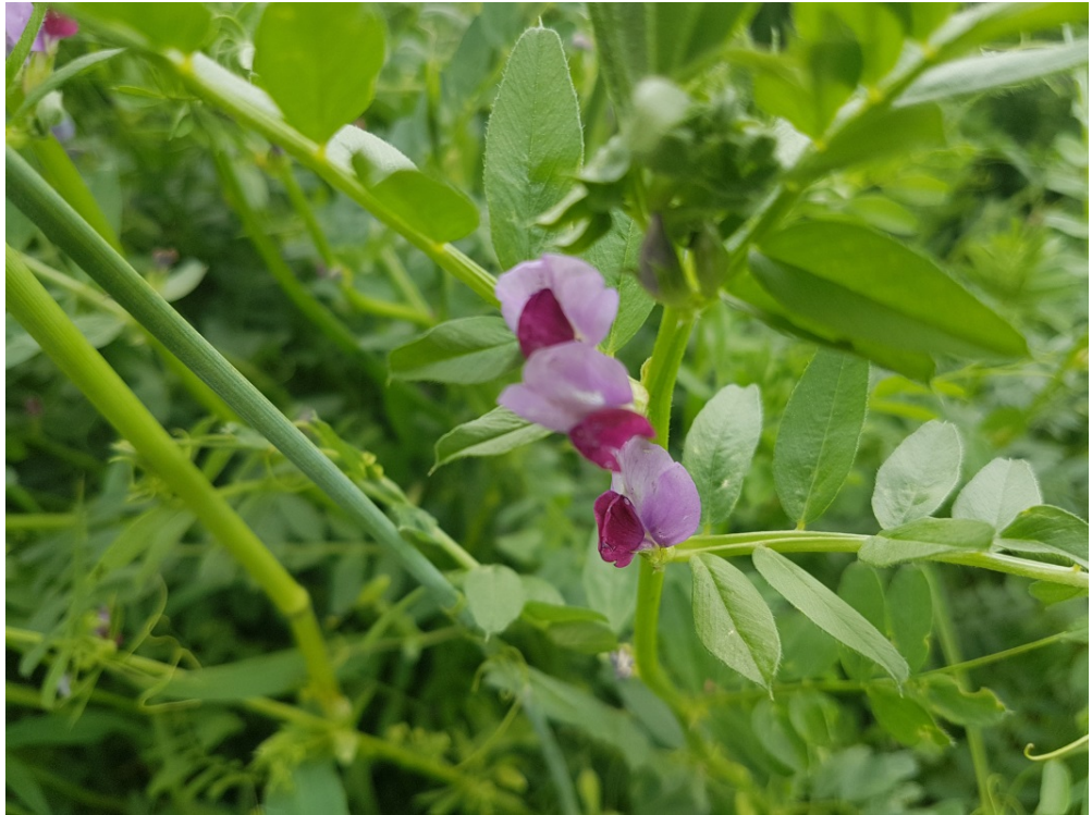
Şekil 3.12. Vicia sativa L. (Dicle / Diyarbakır, 30.04.2018)