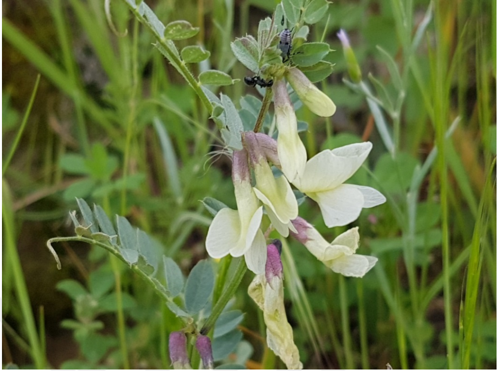
Şekil 3.11. Vicia balansae Boiss (Dicle / Diyarbakır, 30.04.2018)