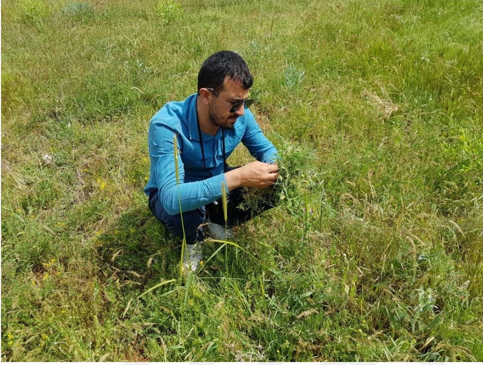
Şekil 3.13. Diyarbakır / Çüngüş, 01.05.2018