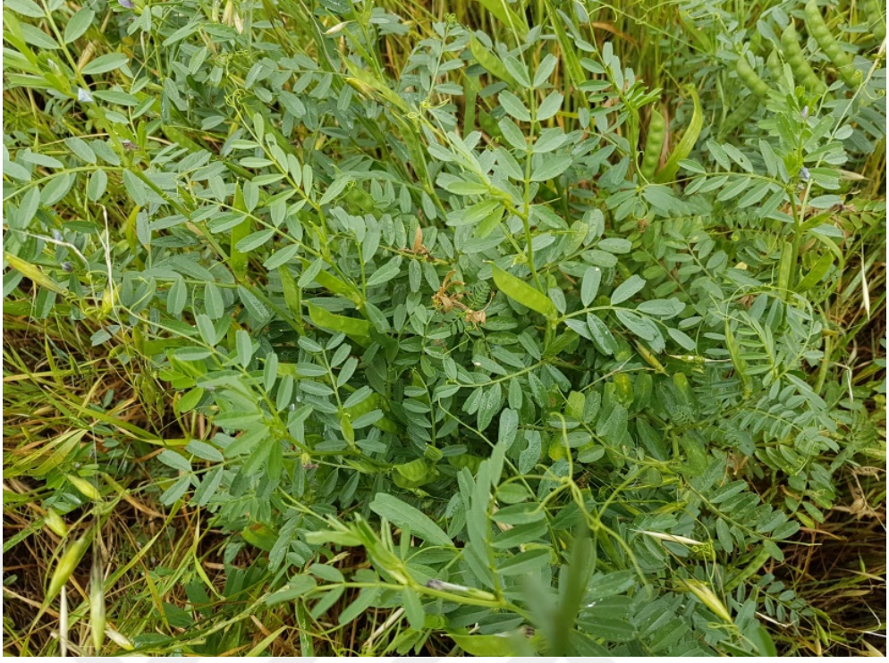
Şekil 3.7. Vicia sativa L. subsp. nigra (L.) Ehrh. var. nigra (L.) Ehrh. (Nusaybin / Mardin, 28.04.2018)