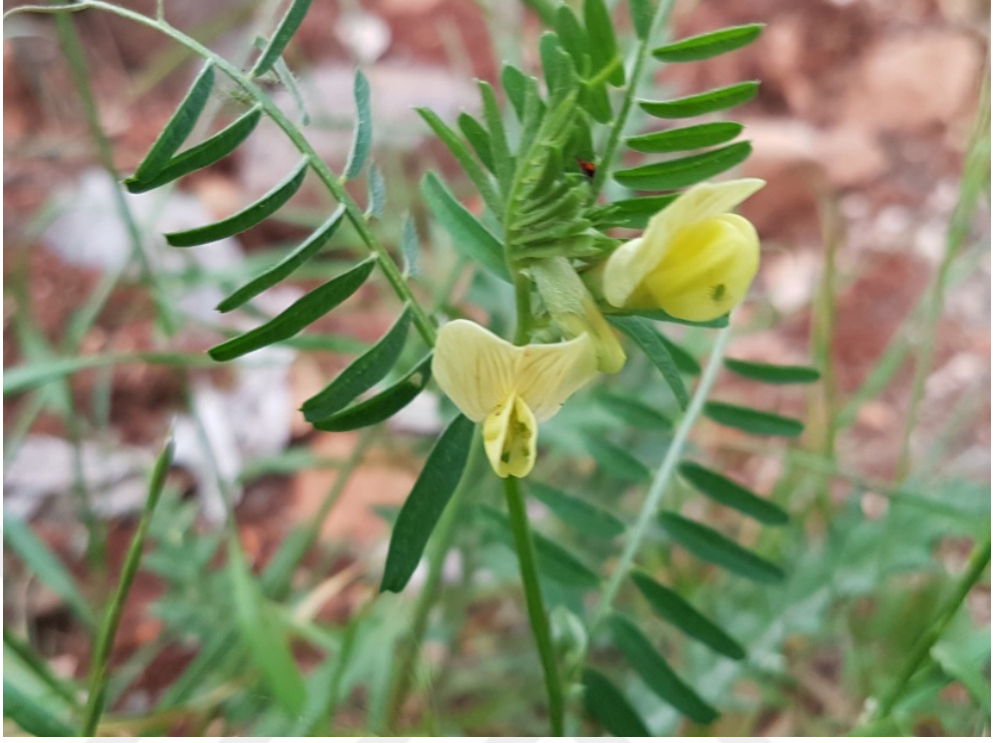
Şekil 3.3. Vicia aintabensis (Eğil / Diyarbakır, 01.05.2018)