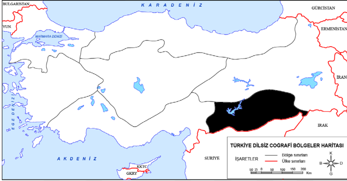
Şekil 3.1. Türkiye Bölgeler Haritası