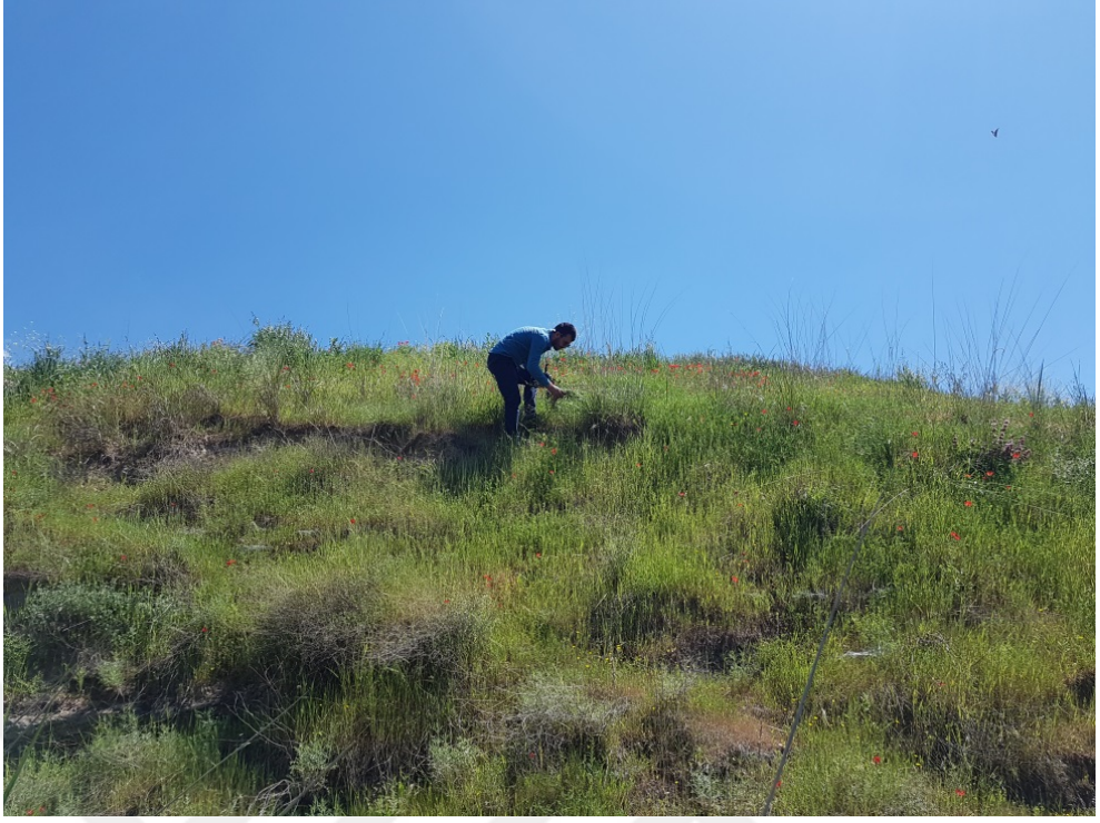
Şekil 3.15. Batman / Kozluk, 23.04.2018