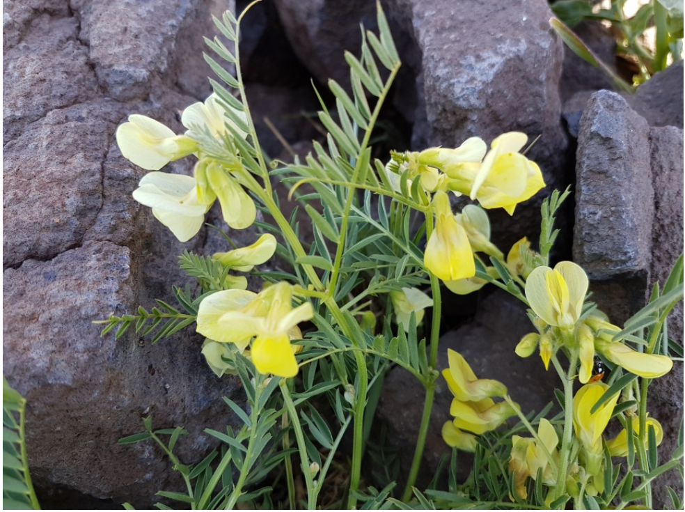
Şekil 3.8. Vicia assyriaca Boiss (Karacadağ / Diyarbakır, 30.04.2018)