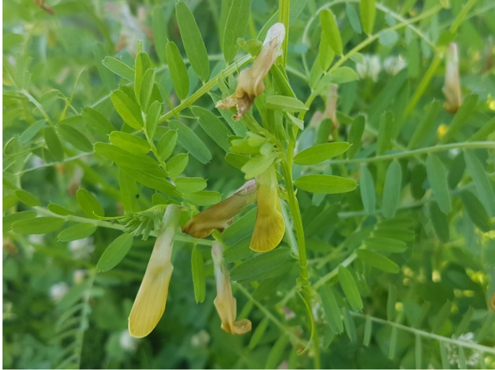
Şekil 3.4. Vicia hybrida L. (Merkez / Diyarbakır, 20.04.2018)