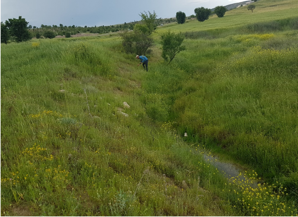
Şekil 3.14. Diyarbakır / Dicle, 30.04.2018