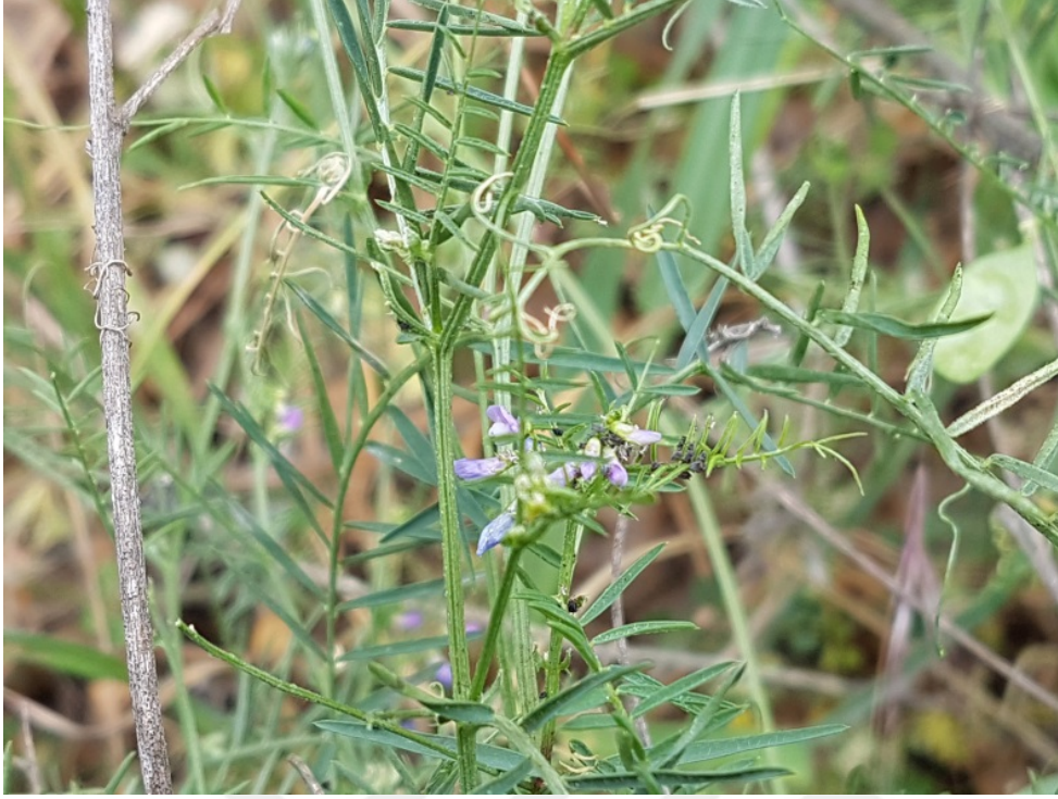
Şekil 3.5. Vicia plaestina Boiss. (Ballı / Adıyaman, 21.04.2018)