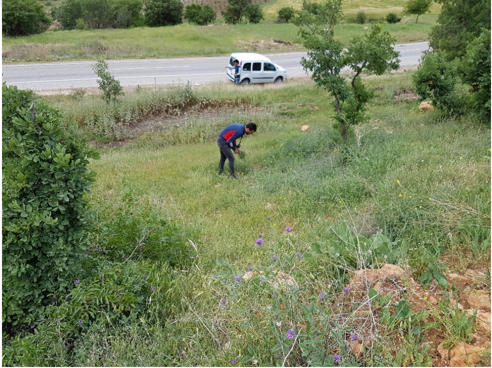
Şekil 3.16. Adıyaman / Ballı, 21.04.2018