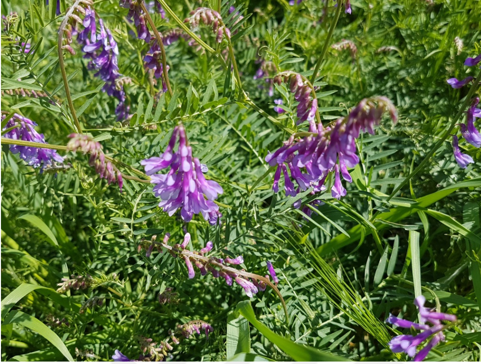
Şekil 3.9. V. cracca L. subsp. stenophylla Vel (Ergani / Diyarbakır, 01.05.2018)