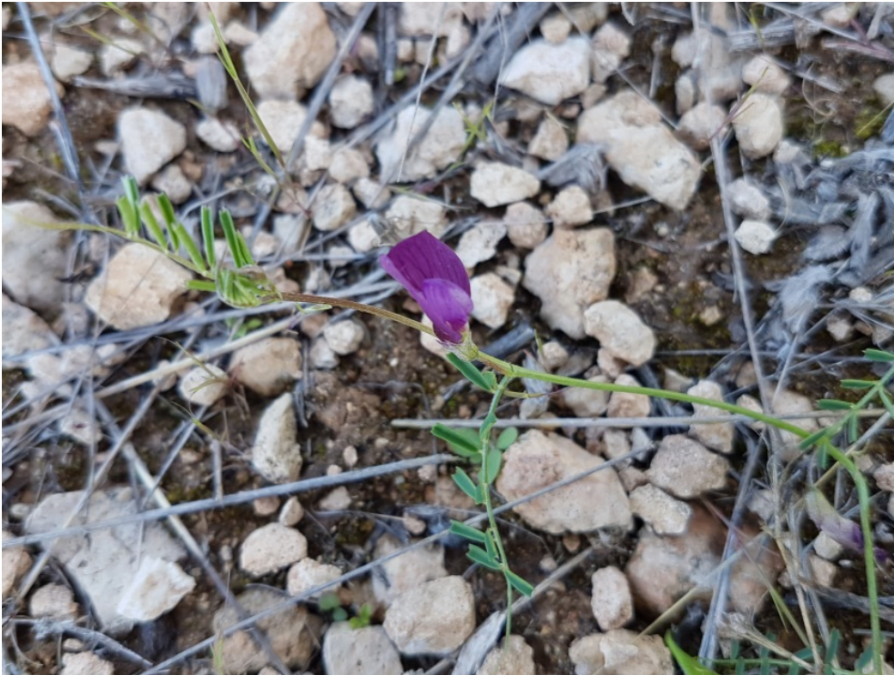
Şekil 3.6. V. michauxii Sprengel. var. stenophylla Boiss (Sultan Şehmus / Mardin, 22.04.2018)