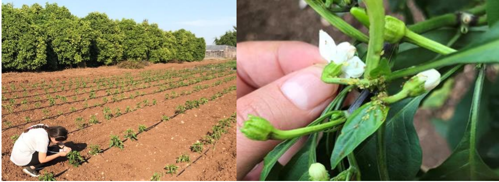
Şekil 3.4. Yaprakbitinin arazi koşullarında lup ile sayımı