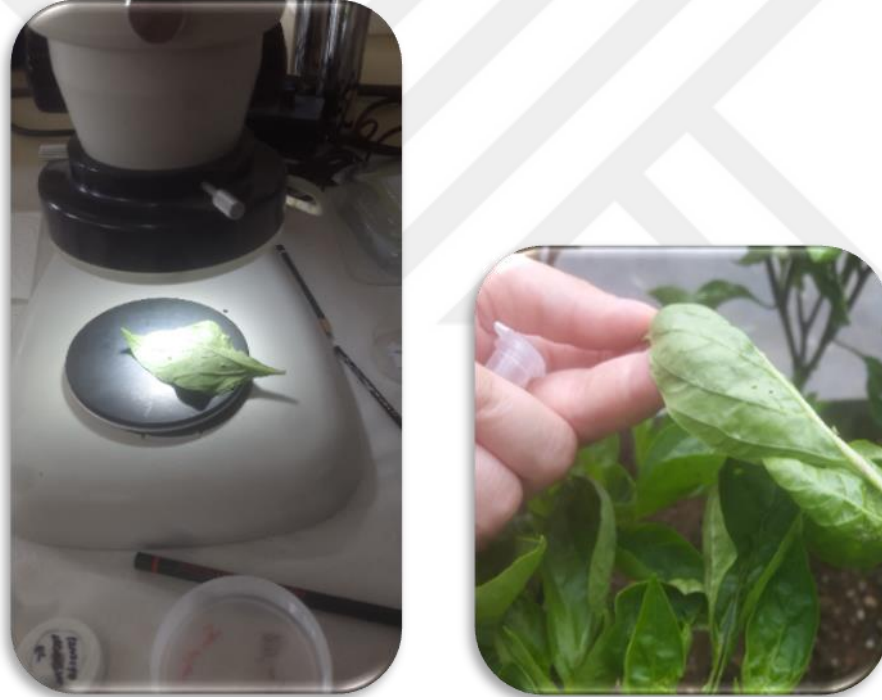
Şekil 3.1. Küçük boyutlardaki örneklerin binoküler mikroskop altında incelenmesi

farklı noktalardan tesadüfi olarak tarlayı temsil edecek şekilde en az 20 noktada biber bitkileri gözle kontrol edilmiştir. Ergin halde bulunan zararlılar ağız aspiratörü yardımıyla ya da örnekleme için tasarlanmış petri kutularına alınarak laboratuvara getirilmiştir. Zararlı ile bulaşık olduğu saptanan bitkiler ise üzerinde bulunan zararlılar ile birlikte kese kâğıtlarına alınıp laboratuvara getirilerek kültür kapları içerisinde kültüre alınarak ergin hale gelmeleri sağlanmıştır. Küçük boyutlardaki örnekler binoküler mikroskop altında incelenerek (Şekil 3.1.), koleksiyonları yapılmak üzere türüne göre alkollü ve alkolsüz tüplere alınmıştır.