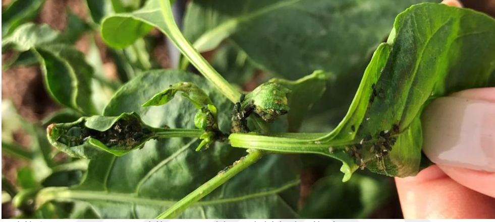
Şekil 4.1. Yaprakbitinin biber yapraklarındaki kolonileri ve zararı

aynı türün çok değişik formlarının bulunabileceğini belirtmiştir. Bu çalışmada da yaptığımız gözlemlere göre M. persicae ve A. gossypii 'nin genelde biber bitkisinin yapraklarında bulunduğu, yüksek popülasyonlarda ise çiçek, sürgün, dal ve gövdede bulunduğu belirlenmiştir (Şekil 4.1.).