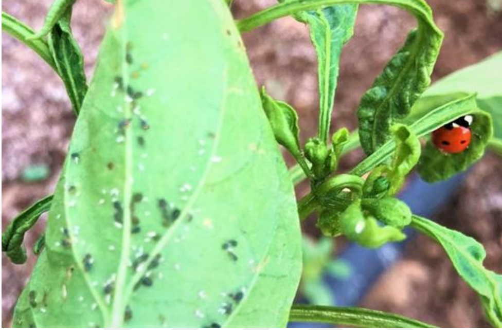
Şekil 4.3. Coccinellid ve yaprakbitinin biber yaprağındaki görünümü

Kaliforniya'da yapılan bir çalışmada Geocoris spp., Orius spp.'nin Bemisia tabaci ile beslendiği belirtilmektedir (Anonymous, 1984). Gavami(1991), 1990 ve 1991 yıllarında Çukurova'da pamuk tarlalarında yürüttüğü çalışmalarında, beyzsineğin popülasyonunun maksimuma ulaştığı dönemde en fazla rastlanan predatör türler olarak Deraeocoris pallens , Orius niger , O.minutus , Geocoris spp., Piocoris erythrocephalus , Nabis spp. ve C.carnea 'yı tespit etmiştir.