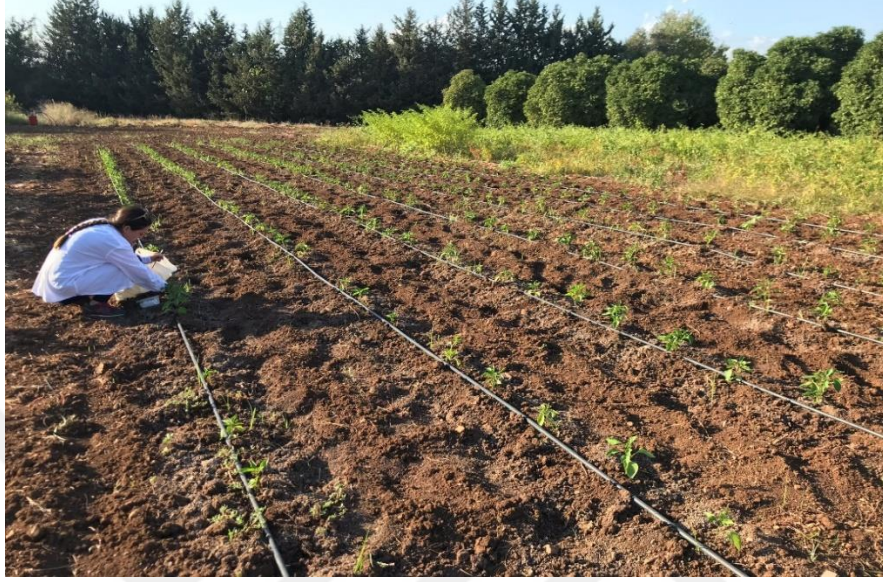
Şekil 3.2. Biberde zararlı ve yararlı türlerin “Gözle kontrolü”