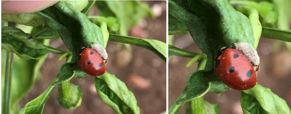
Şekil 4.2. Coccinellid parazitoiti (Hyperparazitoit) Dinocampus (Perilitus) coccinellae (Schrank)

Saptanan parazitoit ve predatör türlerin yanı sıra ayrıca; Coccinella septempunctata L. üzerinde coccinellid parazitoiti (Hyperparazitoit) olan Dinocampus (Perilitus) coccinellae (Schrank) (Hymenoptera: Braconidae) türü de saptanmıştır (Şekil 4. 2.).