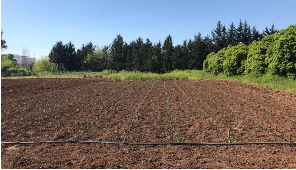
Şekil 3.3. Biber fidelerinin dikimi