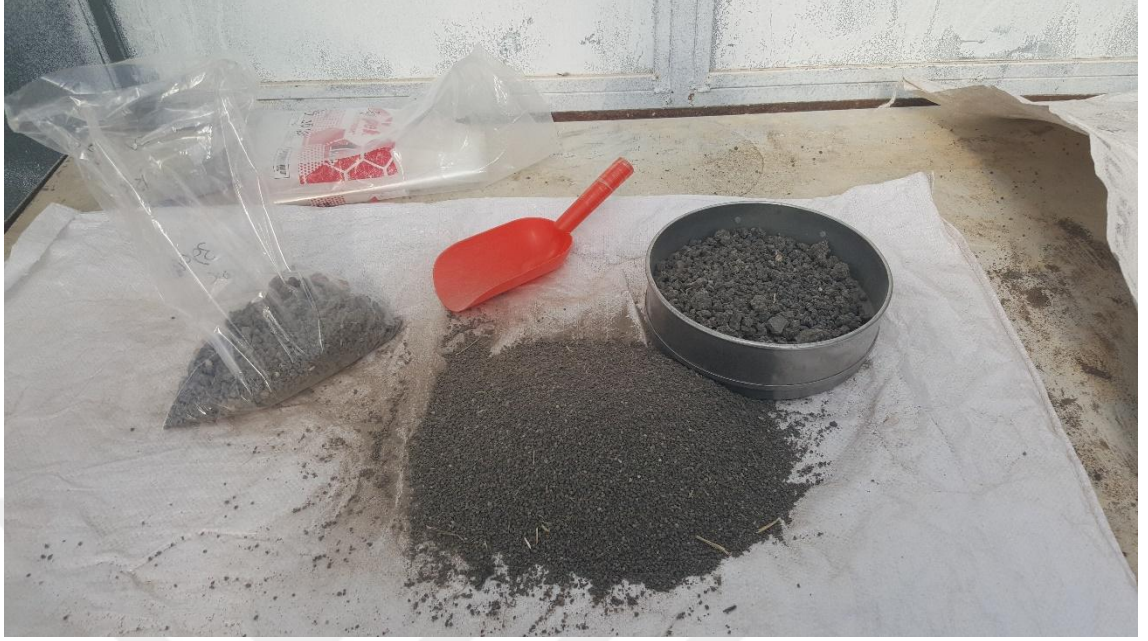
Şekil 3.3. Toprakların elenmesi

3.2.6. Toprakta toplam azot (N) analizi: Toprakların modifiye edilmiş Kjeldahl yöntemine göre yakma cihazında (Buchi K-437) yakılması ve buharlı damıtma cihazında (Buchi K-350) damıtılması sonucunda bir çözelti elde edilmiştir. Sülfürik asit (0,01 N) ile titrasyon sonrası elde edilen sarfiyatın formülde kullanılması ile toplam azot değeri belirlenmiştir (Nelson ve Sommers, 1982).