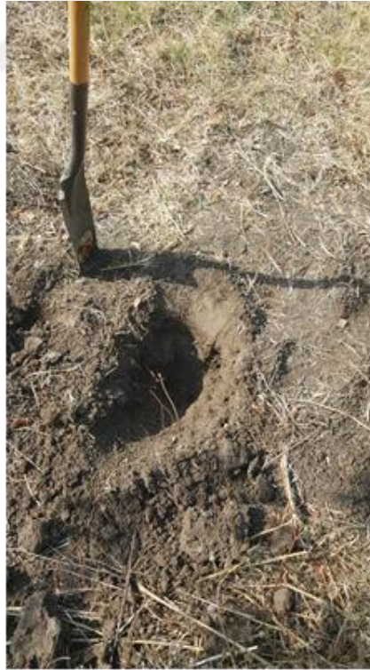
Şekil 3.2. Toprakların alınması

3.2.5. Toprakta organik madde analizi: Walkley-Black yaş yakma yönteminin modifikasyona tabi tutulmuş versiyonu ile gerçekleştirilmiştir (Nelson ve Sommers, 1982).