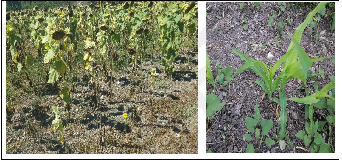
Şekil 3.4. Araziden görseller

3.2.10. Toprakta alınabilir bor (B) analizi: Toprakların Morgan çözeltisi ile ekstrakte edilmesi sonucunda elde edilen süzükten alınan numunenin Azomethine-H yöntemine göre renklendirilmesi ve spektrofotometrede okunması ile yapılmıştır (Wolf, 1971).