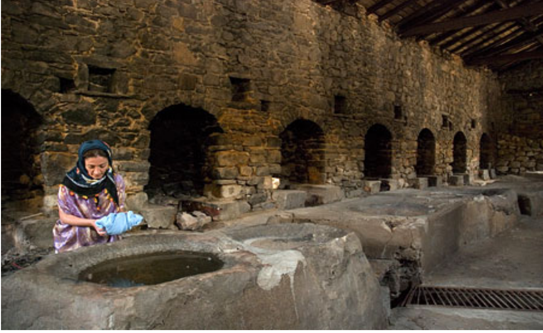
Dereköy'de Rumlardan Kalma Bir Çamaşırhane