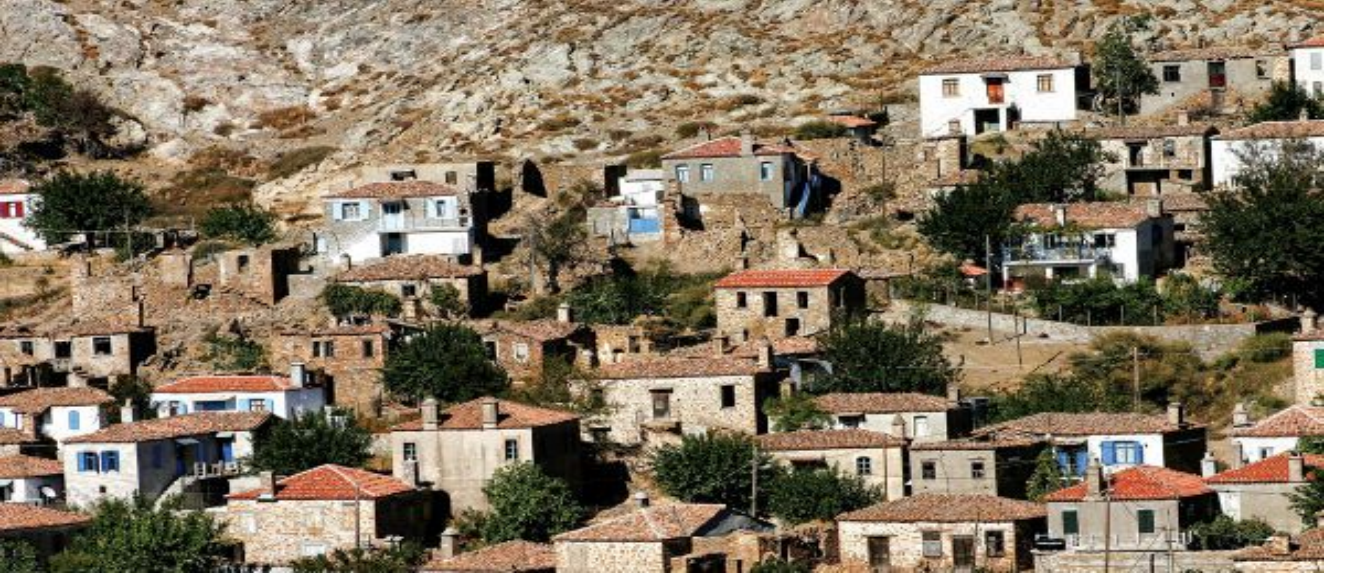
Yarı Açık Cezaevinden Etkilenen Shinudi (Dereköy)