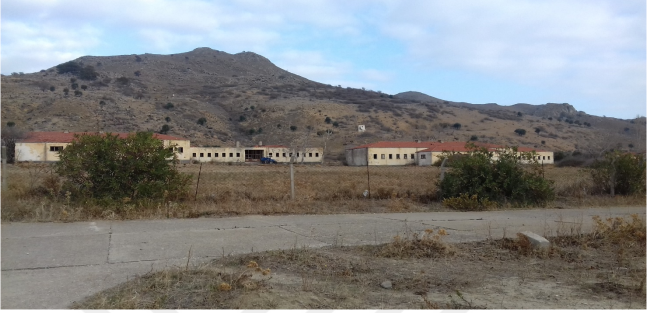
1991'de Kapatılan Yarı Açık Cezaevi Kampüsü