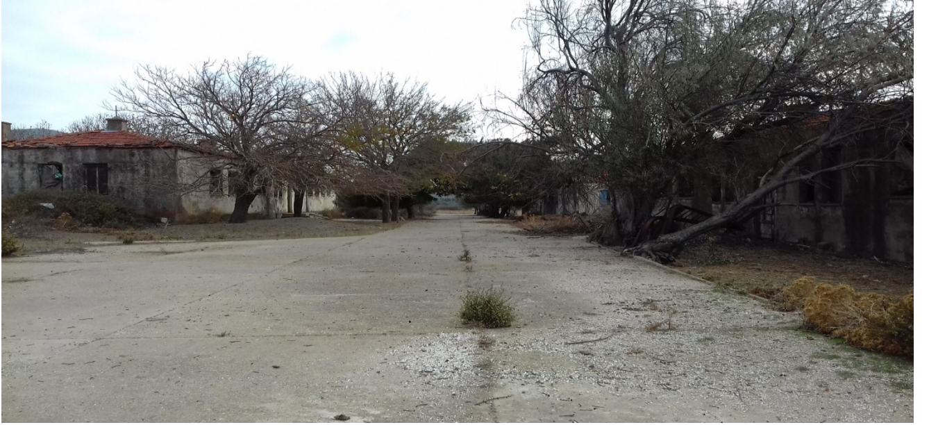
Cezaevi Kampüsünden Farklı Bir Görüntü