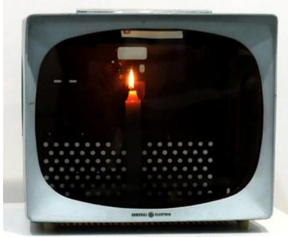
Resim 2.20. Nam June Paik, “One Candle”, 1989.

Name June Paik’in yayıncılık çalışmaları, büyük oranda kendi alanındaki gelişmeleri simgelemektedir. 1972’de gerçekleştirdiği “The Selling of New York” ve “Waiting For Commercial” gibi çalışmalarla Paik, genel durumun farkında olarak, yayın bantları gerçekleştirmeye başlamıştır. Paik, sosyolojik bir durum olarak, seyircinin televizyon izleme olayının boyutlarının farkında olmuştur. Sanatçı, WNET-TV’de gece programlarının arasına sokulacak bazı spotlar hazırlamıştır. Çalışmada normal insanların görüntüleri kullanılmıştır. Bu insanlar, günlük yaşamlarını sürdürürken televizyon da onların yanında varlığını sürdürmüş ve onlar da bir süre sonra televizyonun varlığını unutmuş ya da kanıksar bir duruma gelmişlerdir. Bu sırada, Asya’nın en büyük endüstriyel pazarı olan Japon televizyonu için hazırlanmış Amerikan ürünleri reklamları devreye girmiştir. Sanatçının burada eleştiri getirdiği nokta, izleyicinin pasif konumudur. Alaylı bir biçimde yan yana getirdiği bu iki durumu, izleyici ve sanatçının etken olması gerektiği düşüncesi üzerinden kullanmıştır. 134