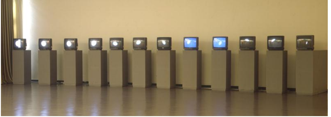
Resim 2.12. Nam June Paik, “The Moon in The Oldest TV”, 1965.

kendi mekanizmasından görüntü üretebilen self-referential (kendini referans alan) makineler kullanmıştır. Sanatçının denemeleri, sanat dünyasının yönelimleriyle yöntem ve malzeme olarak paraleldir. Bu iş, Paik’i farklı bir arayışa yönlendirmiştir. 126 1970’de Paik ve Shuya Abe, işbirliği içinde, kendi ihtiyaçları için ekipman geliştirmişlerdir. “Paik-Abe Video Synthesizer” (Paik-Abe Video Sentezleyici) olarak tanınan bu aygıt, sanatçıya yeniden tarama, biçim bozma, renklendirme gibi yollarla canlı ve kaydedilmiş kaynaklardan video görüntüsü üretme imkânı tanımıştır. Paik, var olanın üzerinde oynamanın, kaydetmekten daha zor olduğunu düşünmüştür. Paik’in ilgisi, bu yeni teknolojinin araştırılması üzerine değil, iletişim üzerine yoğunlaşmıştır. Sanatçının çalışmasının odağı, televizyon ve iletişimin dünya çapında yarattığı kültürdür. Rock müziği, reklamlar, gösteriler, Asya dansları, Hint ritüellerini onun için önemli olan ve sevdiği birçok konuyu içermektedir. Cage’nin sessiz konuşması ve Charlette Moorman’ın vücudunu enstrüman gibi kullanması da bunların arasındadır.