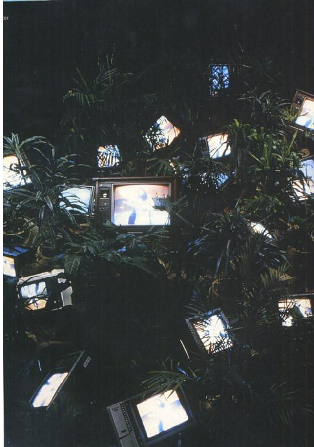
Resim 2.16. Nam June Paik, "TV Garden", 1974.