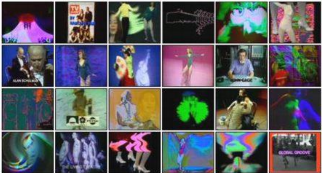
Resim 2.17. Nam June Paik, "Global Groove", 1973.