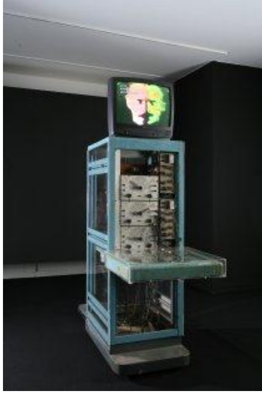
Resim 2.13. Nam June Paik ve Shuya Abe, “Paik-Abe Video Synthesizer”, 1970.

1967 yılın da Avrupa ülkelerinde ki video sanatçıları yaptıkları çalışmalarla bu alanda öncü olarak başı çekmişlerdir. Paris Modern Sanatlar Müzesi’nde Pierre Gaudibert, “Animasyon, Yüzleşme” adlı çalışmasını; Martial Raysee, “Monitör-Resim” adlı video enstalasyonunu gerçekleştirmiştir. İtalya’da Luciano Giarccari, video yapımları için, Varese’de, Studio 971’i kurmuştur. Avrupa’da özgürlük sloganı ile birlikte gelişen kitle iletişim araçları, sanat alanında etkisini göstermiştir. 127