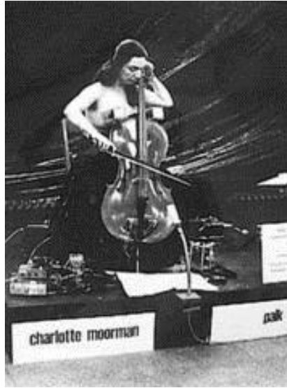
Resim 2.14. Nam June Paik, "TV Bra for Living Sculpture", 1969.

Paik'in. "TV Bra for Living Sculpture" (Canlı Heykel İçin TV Sütyen) (1969), "Concerto for Cello and Video Tape" (Çello ve Video Bandı İçin Konçerto) (1971) ve "TV Buddha" (TV Buda) (1974) adlı işleri Charlotte Moorman ile performansları, sanat dünyası için önemli video performans, video heykel ve video enstalasyonlar olmuşlardır. 128 1967 yılında, Charlotte Moorman ile birlikte gerçekleştirdiği video performansları ayrıca, videonun belgeleyici bir anlayışla kullanımını da göstermektedir. Paik, bu çalışmalarında monitörü, genel algı kalıplarının dışında kullanarak sorgulamış ve bu gösteriler sadece davet edilenler tarafından izlenebilmiştir. 129