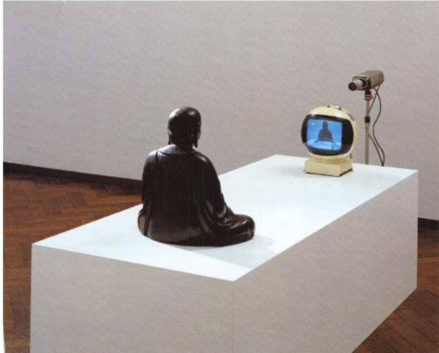
Resim 2.15. Nam June Paik, “TV Buddha”, 1974.

Paik, “TV Buddha” isimli çalışmasında malzeme olarak video kamera, monitör, Buda heykeli ve toprağı kullanmıştır. Buda’nın görüntüsü o an ekrana kamerayla çekilerek yansıtılmıştır. Buda, toprak içerisindeki monitörden izlediği kendi görüntüsüyle yüzleşmekte ve kutsal bilgeliğini kendi kendisine sorgulamaktadır. 131 “TV Buddha” Paik’in en iyi bilenen kapalı devre enstalasyonu olsa da, 1974’teki “TV Garden” ile birleştirilen, 1973 tarihli “Global Groove”, o dönemdeki en kayda değer video işi sayılabilir. Sanatçı, televizyon setlerini doğal bir ortama yerleştirmiş ve bu setlerde, tüm dünyadan görüntüler yer almıştır. Dünyayı, doğal ve uluslar arası bir çevre olarak sunmuştur. 132 Sanatçının en göze çarpan işleri, “Imagine: There are More Stars in the Sky Than Chinese on the Earth” (1981), “V-yramid” (1982), “Beuys/Voice” (1987), “One Candle” (1989), gibi kapalı devre multi-monitör enstalasyonlarıdır. Bunların haricinde bir de, Dufy’nin Musée D’Art Moderna dela Ville de Paris’teki, “LA Fée Electricite” ine göndermesi olan anıtsal enstalasyonu vardır. 1989 tarihli bu iş, Fransız devriminin 200’üncü yılına da göndermede bulunur ve “The Elektronik Fairy” adını taşımaktadır. 133