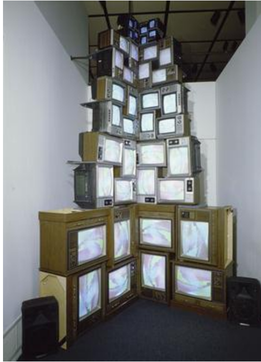
Resim 2.18. Nam June Paik, “V-yramid”, 1982.