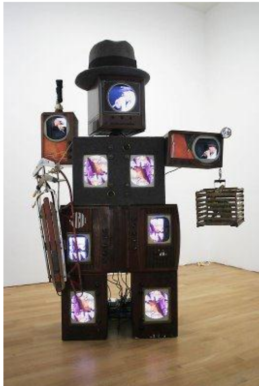
Resim 2.19. Nam June Paik, “Beuys/Voice”, 1987.