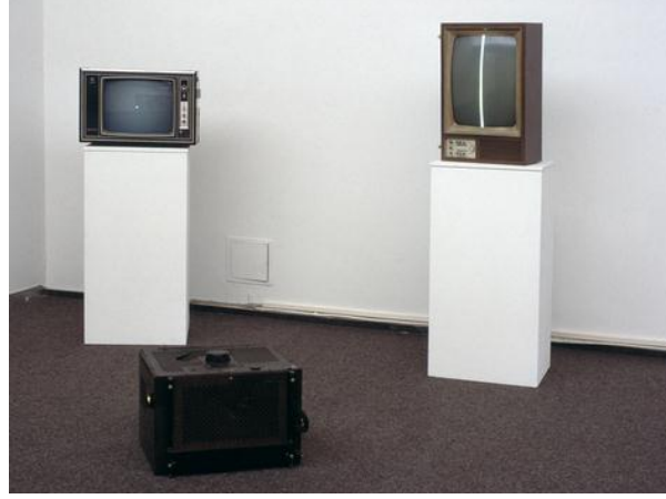
Resim 2.11. Nam June Paik, “Exposition of Music – Electronic Television”, 1963.

kenti Galerı Parnass'ta gerekleřtirdi. Galerı Parnass daha sonraki yıllarda video sanatının merkezlerinden biri oldu. Parnass video sanatının gelişim sürecinde isimlerine sık sık rastlayacađımız önemli sanatıların etkinliklerine sahne oldu; daha da önemlisi, Video Sanatı'nı başlatan sanatı olarak tanınmıştır. 124