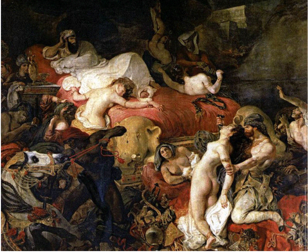
Resim 4.1: Eugène Delacroix, The Death of Sardanapalus, 1827

karişiklik başka bir deyişle bu karişik oda bir kadına aittir. 83 Parçalanmış, yırtılmış bir yatak; etrafa saçılmış elbiseler ve çeşitli nesnelere; zarar görmüş eşyalar; çekmeceleri açılmış ve kurcalanmış gibi duran komodin; yıpranmış ve zarar görmüş kapı; pencere ve duvarlar ile organize edilmiş bir kaos görünmektedir.