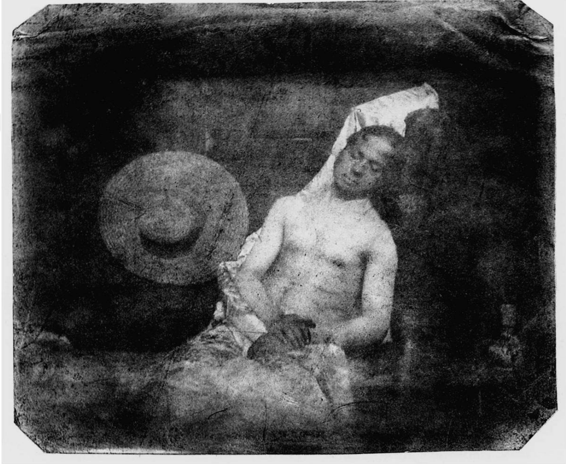
Fotoğraf 3.3: Hippolyte Bayard , Self portrait as a drowned man , 1840

Tarihte bilinen ilk kurgusal fotoğraf Hippolyte Bayard'a aittir. Bayard, 1840 yılında otoportrelerinin birinde kendisini beş kuruşsuz kalmış bir biçimde intihar eden anlaşılmamış ve değeri bilinmemiş bir sanatçı olarak fotoğraflamıştır. 46 Fotoğrafın içindeki öğelerden ve vücudun duruş biçiminden söz konusu intihar kurgusunun teatral bir biçimde ortaya konduğu söylenebilir.