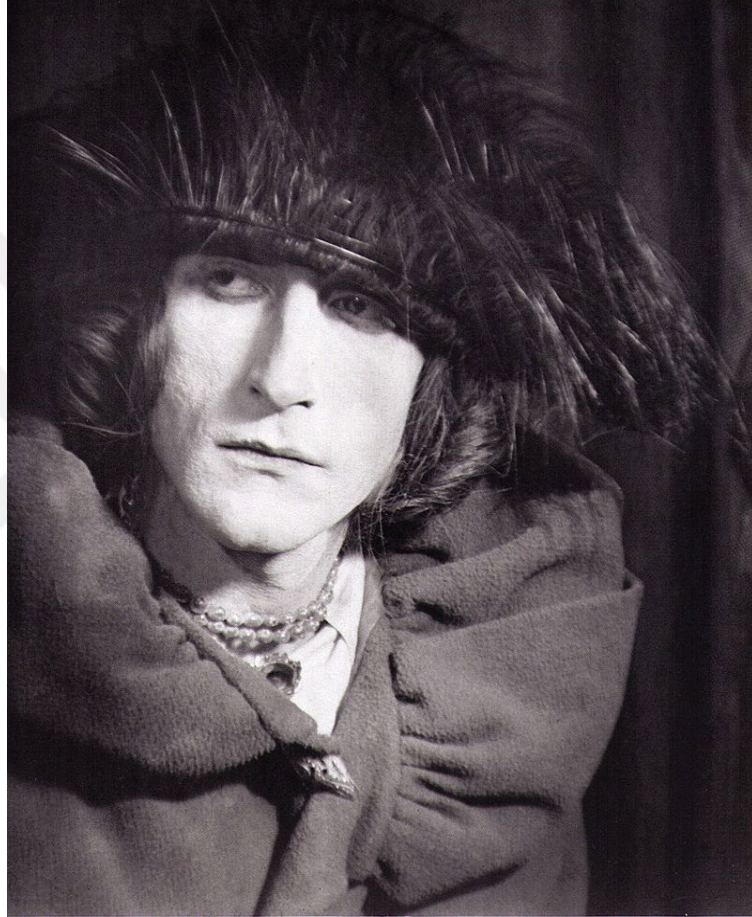
Fotoğraf 3.4: Rose Sélavy (Marcel Duchamp), 1921, (Fotoğraf: Man Ray , Sanat Yönetimi: Marcel Duchamp)

müdahalelerine olanak sağlayacak boyutu da kazandırmıştır. “Marcel Duchamp’ın “Rose Selavy” kimliğini yansıtan portresi bu anlamda değerlendirilmelidir.” 47 Tumay, Ray ve Duchamp’ın bu benzer yaklaşımları fotoğrafçıların ilgi alanına yaratıcılık boyutuyla şunun sokulmasının olanağını sağlamışlağını ifade etmektedir. Diğerlerinin hikayelerini zamanla ya da zaman içinde zihindeki hiper olarak nitelendirilebilecek gerçeğin bütün varoluşlarıyla beraber yorumlanmasının.