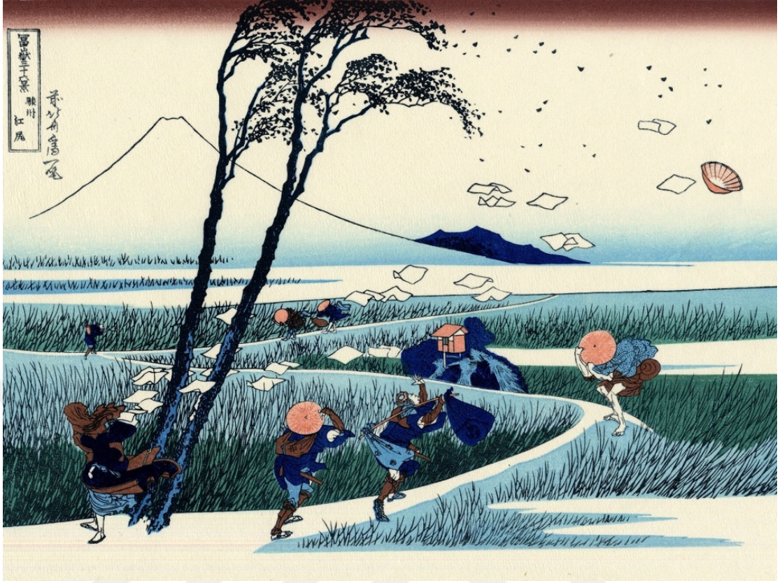
Resim 4.2: Katsushika Hokusai, Travellers Caught in a Sudden breeze at Ejiri, 1832

“Bazen bende o şey, beni bellekte büyüleyen şeyi yakalayıp fark edene kadar takılıp kalır. Fotoğraflamak bana sanat için son derece önemli olan yaratımsal özgürlük vermez. Onu veren şey, sanatında onu hakkında olduğu şey, yapmak istediğimiz şeyin özgürlüğüdür.” 86