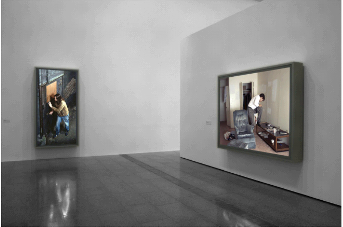
Fotoğraf 4.1: Jeff Wall Fotoğraflarının NGV'deki Enstalasyonundan Bir Görünüm; Avustralya Sergisi; solda, Doorpusher 1984 ve sağda, Polishing 1998.

Wall'un çalışmalarını sunma biçimi de son derece göze çarpmaktadır. Wall çalışmalarını büyük lightbox 'lar halinde sergilemektedir. Cotton'a göre bu yolla fotoğrafların uzamsal ve parlak niteliklerine, olağanüstü bir buradalık kazandırılmaktadır. Bir lightbox ne bir fotoğraftır ne de bir resimdir. Ne ki her ikisinin birlikteliğini sunmayı hedefler. Lightbox 'ın kullanımı Wall'un çalışmaları için başka bir çerçeve sunmaktadır.