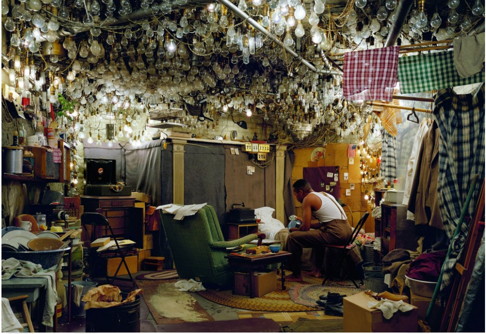
Fotoğraf 4.11: Jeff Wall, Invisible Man, 1999-2000