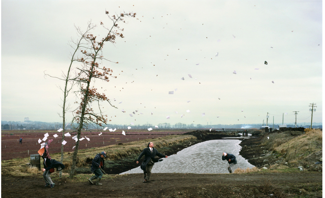
Fotoğraf 4.10: Jeff Wall, A Sudden Gust of Wind (after Hokusai), 1993

9. Wall'un bir başka röprodüksiyon yapıtı ise 1993 yılında ürettiği A Sudden Gust of Wind (after Hokusai) adlı fotoğraftır. Fotoğrafın isminde parantez içinde belirtildiği gibi eser Japon ressam ve özgün baskı sanatçısı Katsushika Hokusai'den öykünerek yaratılmıştır. Wall diğer röprodüksiyon fotoğraflarında daha çok gördüklerini hayal gücü ve entelektüel birikimi ile yorumlamıştır, bu eserinde ise neredeyse bire bir kopyalama söz konusudur. Wall’un verdiği bir röportajda belirttiği gibi aslında o yapmak istediği şeyin yapma özgürlüğüyle kuşatılmış ve çalışmayı ortaya koymuştur.