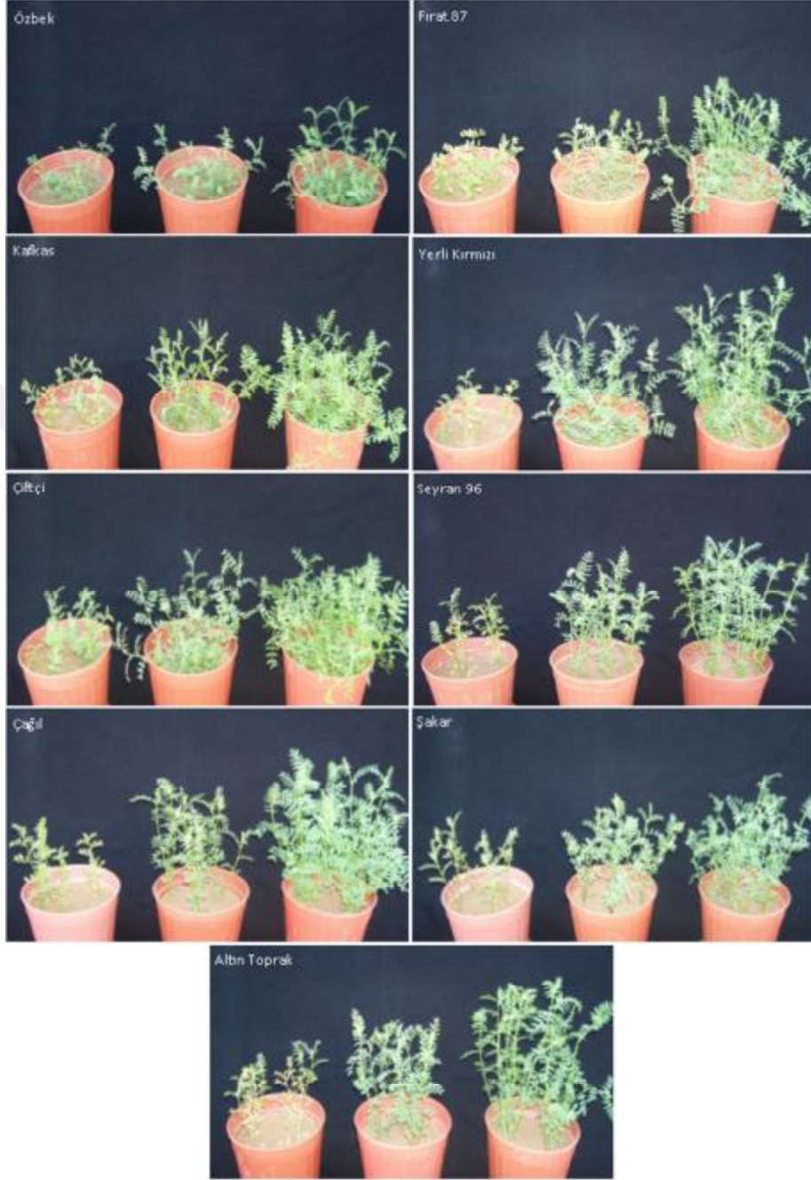
Şekil 4.1. Mercimek Genotiplerinin 15-45-90 mg P kg -1 toprak dozlarındaki (soldan sağa doğru) görünümü