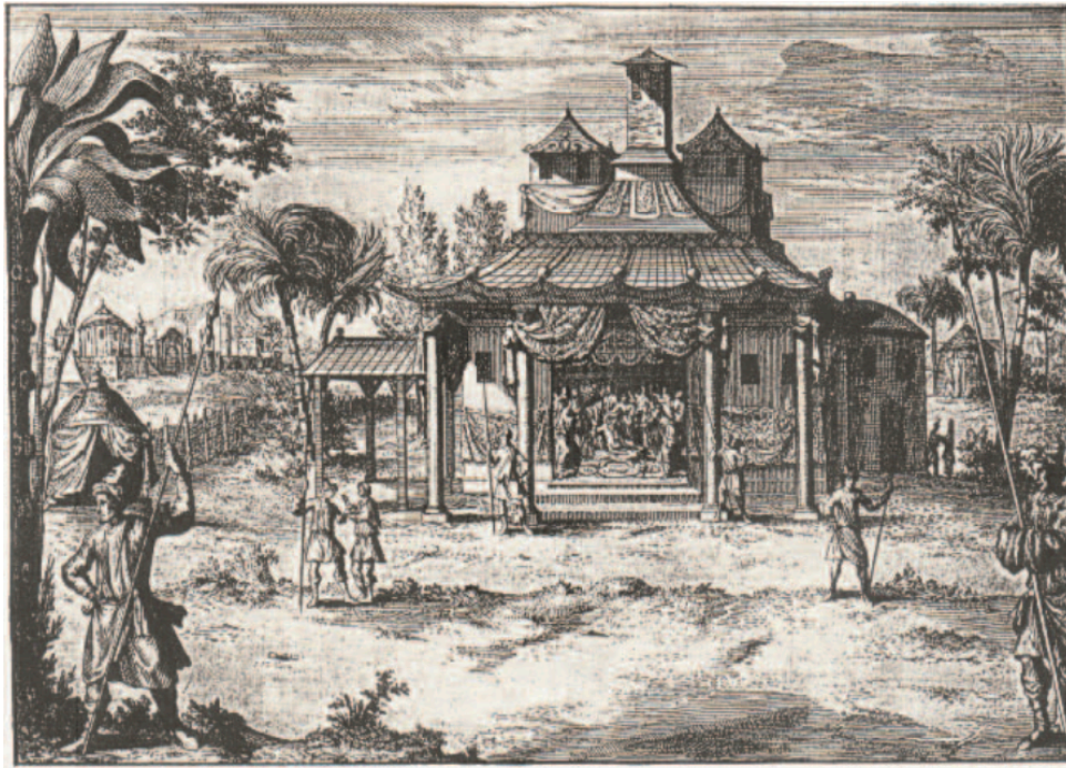
Şekil 3.1: 1604 Yılında Vefat Eden Sultan 'Alauddin Riayat Şah el-Mukammil Döneminde Açe Kraliyet Sarayı'nın Görünümüne Dair Bir Tasvir.

menteri dirham ve balai furdah'dan oluşuyordu. 60 Yasama organı ise, üzerinde uzlaşa sağlanan konular üzerine yemin etmeyi içeren görevleri olan balai musyawarah adını taşımaktaydı. Bu organ üç bölüme ayrılmıştır: balai rungsari, balai gadeng, ve balai majelis mahkamah rakyat. Balai rungsari dört kıdemli Orang Kaya 'dan, balai gadeng yirmi iki önde gelen din âliminden ve balai majelis mahkamah rakyat her biri bir mukim 'i temsil eden yetmiş üç üyeden oluşmaktaydı. 61 Adat Meukuta Alam (bir hukuk kanunu), belirli bir mukimi temsil eden Uleebalang'ın köy başkanı ( keuchik ), din görevlisi ( imam ) ve yaşlılar ( orang tuha-tuha ) tarafından uzlaşa yoluyla seçilmesini öngörmektedir.