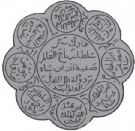
Şekil 3.5: Safiyatuddin’in Mühürü

Safiyetüddin döneminde Açe’ye gelen Müslüman seyyah el-Mutewakkil, Safiyetüddin hakkında şu dikkat çekici tasviri yapmıştır: “Son derece zarif, kâmil bir Müslüman kadın, cömert ve malca ihsanda bulunan bir hükümdardır. Onlara hükmeder. Okuma bilmekte, ilimden, hayır işlerinden ve Kur’ân üzerine ittifaktan haberdardır. Ona Safiyyatü’-d-Din Şah Berdaulat denir. İsmi sikkelerde yazılıdır; bir yüzünde Safiyyatü’-d-Din , diğer yüzünde Şah Berdaulat ifadesi bulunmaktadır.” Bu tanıklık, Safiyetüddin’in yalnızca siyasî bir figür değil, aynı zamanda bilgisi, dindarlığı ve cömertliğiyle çağdaşlarının gözünde örnek bir hükümdar olarak algılandığını göstermektedir. 183