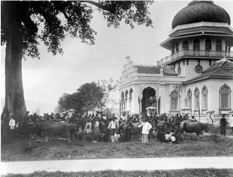
Şekil 4.2: Ramazan ve Kurban Bayramları, Bâytürrahman Camii'nde