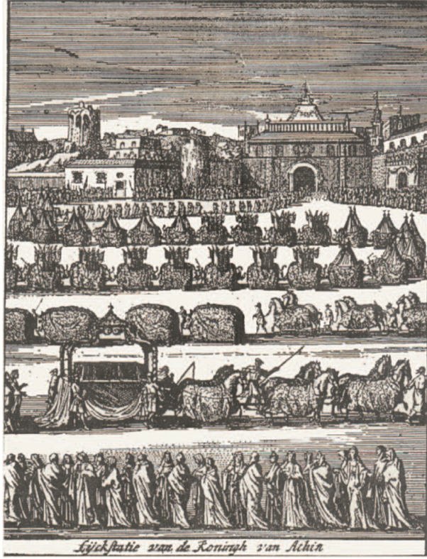
Şekil 4.5: 1641 Yılında Sultan İskender Sani'nin Cenaze Töreni

hazırlanmış suassa (altın-bakır alaşımı) bir sandıktan ibaretti ve altın kumaşla örtülmüştü. Alayın sonunda hükümdarın naaşı, sarayın arkasında bulunan kraliyet türbesine, seleflerinin yanına defnedildi. Yüz gün boyunca eşleri buraya tütün, yiyecek ve içecekler getirmeye devam etti, sanki hâlâ hayattaymış gibi. Naaş toprağa verildiği anda iki gümüş top ateşlendi, sesi bütün gece boyunca yankılandı; araya sıkışan ‘Tanrı Yeni Kraliçeyi Korusun’ (God Bewaar de nieuwe Koningin) nidalarıyla gece boyu devam etti. Ardından her şey sükûnete kavuştu.” Bu cenaze merasimi, yalnızca İskender Hanî’nin kraliyet geleneklerine uygun biçimde defnedilmesini sağlamakla kalmamış, aynı zamanda Safiyetüddin’in meşruiyetini pekiştiren siyasî bir gösteri işlevi de görmüştür. 227