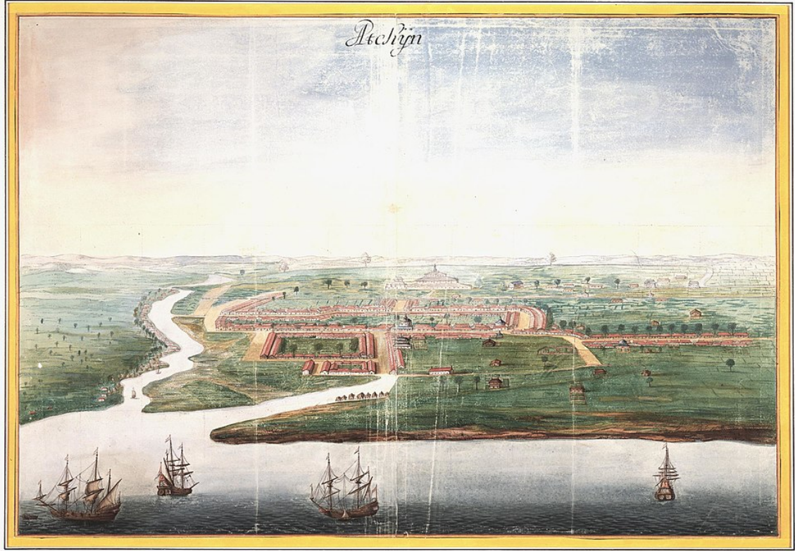
Şekil 3.3: Banda Açe'nin 1665 Yılında Sultan Sarayı'nın Arka Planlı İle Boyanması

Açe'de ticaret yapan yabancıların korunması ve onlara yardım sağlanması da laksamana'nın göreviydi.