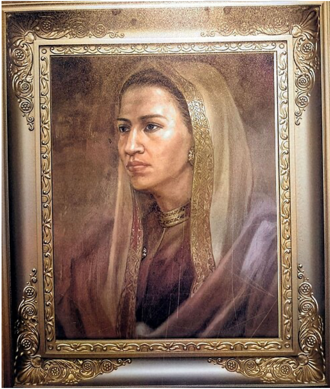
Şekil 2.1: Sri Sultan Tacul-Alem Safiyyetüddin Şah'ın Görsel Bir İllüstrasyonu

yedi yaşından itibaren saray çocuklarıyla birlikte dönemin tanınmış âlimlerinden eğitim almıştır. Bu âlimler arasında Şeyh Hamza Fansurî, Şeyh Nuruddin er-Ranîrî, Seri Zeynel Abidin Fakih İbn Mansur Dâim, Şeyh Kemalüddin, Şeyh Ahmed Alâeddin, Muhyiddin Şeyh Ali, Şeyh Takiyüddin ve Şeyh Hasan Seyfüddin Abdülkahhar gibi isimler bulunmaktadır. Bu şahsiyetlerin tümü, Camia Beytürrahman'da görev yapan büyük ve seçkin müderrislerdir (profesörlerdir).” 27 Bu durum, Safiyyetüddin'in yalnızca babası İskender Muda'nın entelektüel mirasını devralmadığını, aynı zamanda Açe'nin kozmopolit atmosferinde diplomasi, dinî temsil ve kültürlerarası iletişim becerilerini sergileyebilmek üzere erken yaştan itibaren yetiştirildiğini ortaya koymaktadır.