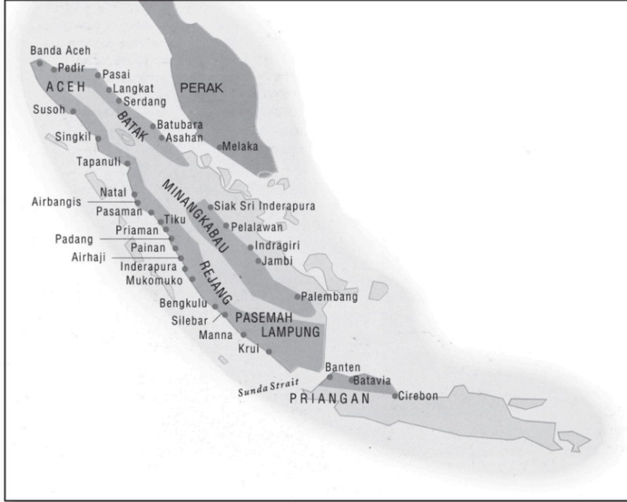
Şekil 3.2: Sumatra, Batı Cava ve Malay Yarımadası haritası, 17. Yüzyıl

durum Minangkabau için de geçerliydi: Açe, artık hinterland üzerinde doğrudan kontrol sağlayamıyor, yalnızca biber ihracatı için stratejik önemi olan Batı Sumatra kıyılarındaki Barus, Singkil ve Meulaboh gibi liman bölgelerinde etkisini sürdürebiliyordu. 77 Bu dönemde Açe'nin yönetim sistemi, yerel Orang Kaya ve Uleebalang 'ların geniş özerklikle kendi bölgelerini idare ettikleri, karşılığında ise Banda Açe'ye haraç gönderdikleri daha feodal bir yapıya büründü.