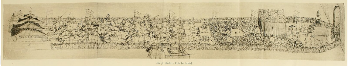
Şekil 4.1: Açe Sultanı'nın Kurban Bayramı'nda Camiye Kadar Eşlik Ettiği Alay

bulunarak patrimonial siyâsetini pekiştirmiştir. 205 Mevlid-i Nebî, şiirlerin okunması, ziyâfetler ve toplu duâlarla kutlanırken; Kur'ân hatmi, yılbaşı duâları ve devlet için doa selamat törenleri de muntazaman yapılmıştır. Bu merâsimlerde Şeyh Abdurrauf es-Singkilî gibi büyük ulemânın hazır bulunması, Safiyetüddin'in dînî otoriteyle meşruiyetini pekiştirdiğini göstermektedir. 206