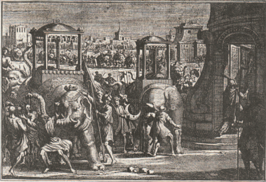
Şekil 4.4: Açalilerin Yabancı Elçileri ve Onların Hediyelelerini Kraliyet Sarayına Götürme Biçimine Dair Avrupalı Bir Betimleme.

şenliklere katılan teb'anın kalabalıklığı, yalnızca ülkenin nüfusunu değil, daha da önemlisi hükümdarın mahareti ve yüceliğini kanıtlıyordu. 221 A. C. Milner, Malay saray ritüelleri üzerine yaptığı çalışmada, törensel işlevlerin, resmî alayların ve devlet şenliklerinin hükümdarların kendi eğlenceleri için değil, doğrudan hükümdarlık görevlerinin ayrılmaz bir parçası olarak icra edildiğini ileri sürmektedir. 222 Buna göre, hükümdarın düzenlediği bu şenliklere katılarak bersuka-suka (eğlenmek) teb'anın görevlerinden biri sayılmaktaydı. 223