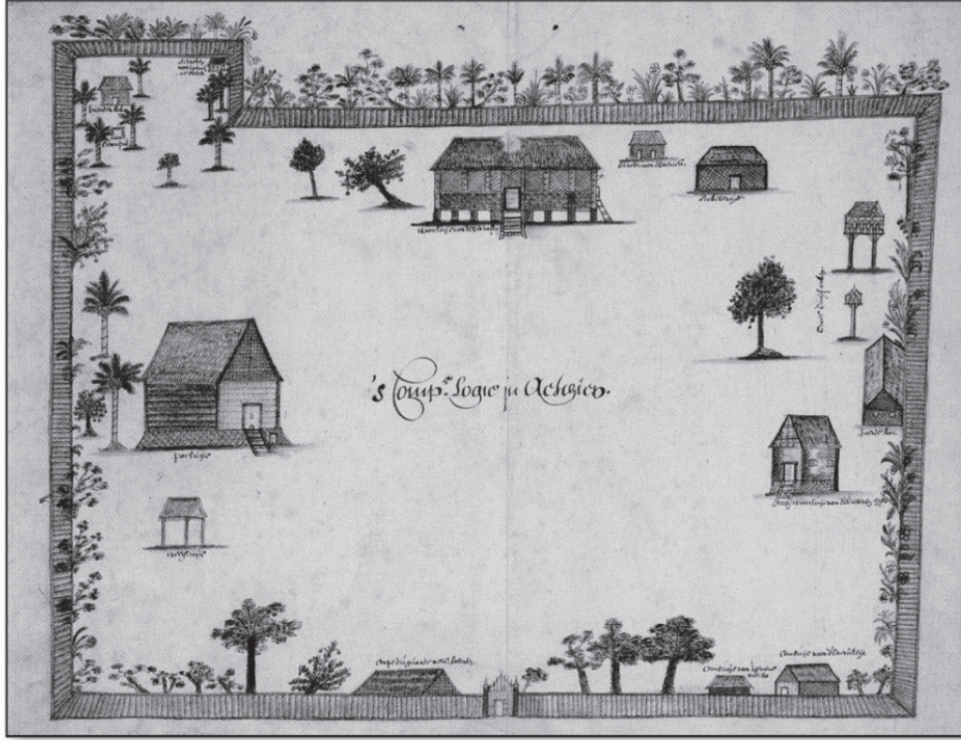
Şekil 4.6: 17. Yüzyıla Ait, Açe'deki VOC (Hollanda Doğu Hindistan Şirketi) Fabrikasını Tasvir Eden Bir Çizim.

Kaynak : Sher Banu, Sovereign Women, 2017