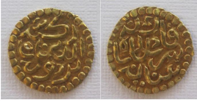
Şekil 3.6: Seri Ratu Kamalat Şah Döneminde Dirhem