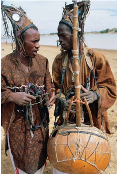
Figura 2 Griot tradizionali Africani

città ricca e facoltosa, e dall'altro ci mostra il popolo africano in totale povertà.