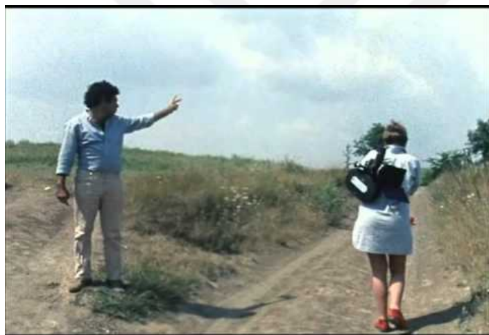
Figure 1 Scena tratta dal Vento dell'Est , Godard

Nel manifesto Verso un Terzo Cinema, vengono criticate Hollywood e la Nouvelle Vague (cinema europeo). Secondo il Manifesto, Hollywood produce i film solo a scopo di lucro e ciò rende passivi gli spettatori. Invece, come nella proiezione di Las Horas de Los Hornos lo spettatore viene reso parte integrante e attiva del film, commentandolo. Durante la proiezione il film viene messo in pausa per permettere l'apertura di un dialogo sulla politica contemporanea. Così si viene a creare un modo critico di guardare il film con feedback da parte del pubblico. Come dice Micheal Chanan, il film permette allo spettatore di parlare delle problematiche sociali