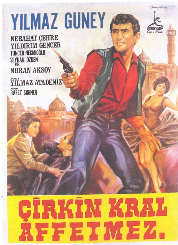
Figure 2 La Locandina di (Re Brutto Non Perdona) "Çirkin Kral Affetmez, 1967). Il film esemplare del periodo Re Brutto .

La rivista Güney segue il mondo del cinema rivoluzionario in diverse aree geografiche, spostandosi anche in Africa. Racconta la fase della realizzazione di Fine del Dialogo (phelandaba), il documentario realizzato nel 1970 da Nana Mahomo che narra l'Apartheid in Sud Africa. Il principale interesse di Güney rispetto a questo contesto sudafricano è la capacità di realizzare film con scarsissime risorse e in condizioni sfavorevoli. Sottolinea inoltre le conseguenze l'accordo del Congresso Panafricano e racconta la lotta dei neri attraverso la camera da presa di fronte alla discriminazione razziale da parte dei bianchi. La rivista dunque non si limitava ad affrontare le problematiche locali turche ma ampliò il suo raggio di azione e analisi al resto del mondo. Il regista, infatti, definì una distinzione tra 'Cinema turco' e 'Cinema della