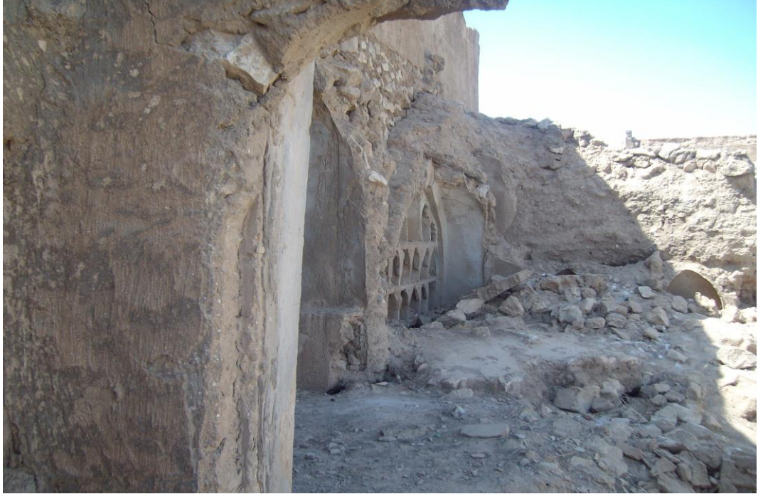
Figür 5: Kerkük Kalesi içindeki yıkıntılar, Irak (2009)