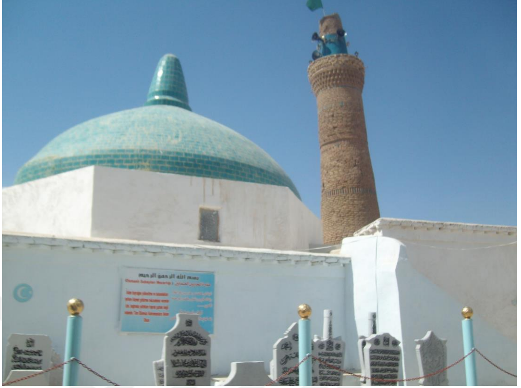
Figür 2: Danyal Nebi Türbesi ve Osmanlı Subayları mezarlığı Kerkük, Irak (2009)