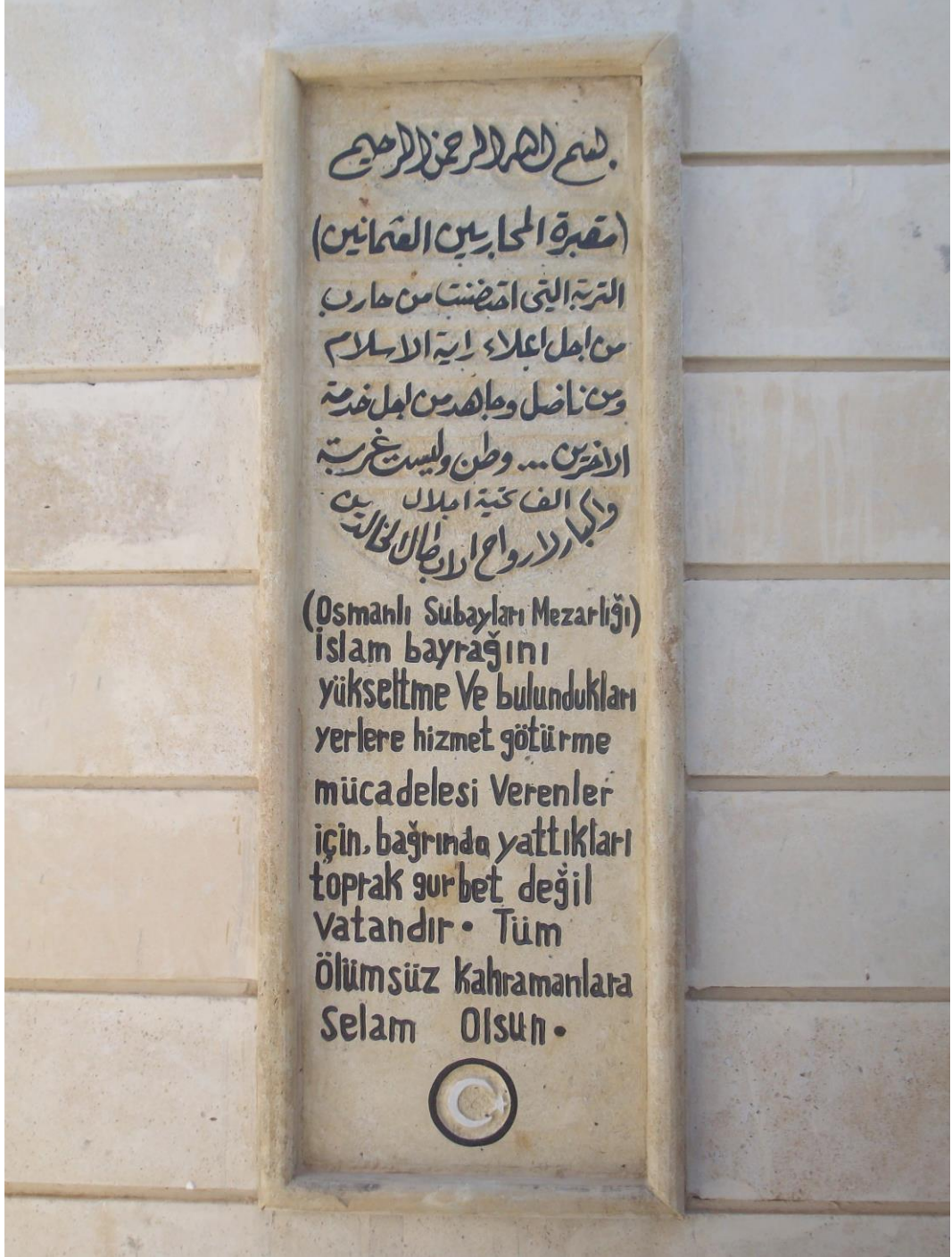
Figür 1: Osmanlı subayları mezarlığı giriş levhası Kerkük, Irak (2009)