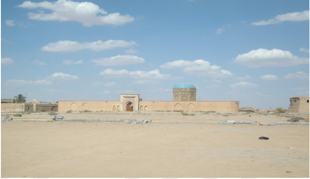
Figür 6: Kerkük Kalesi içerisindeki Yeşil Türbe, Irak (2009)