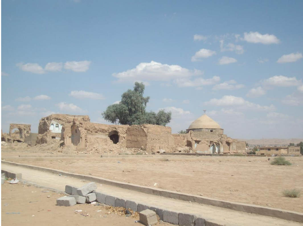
Figür 7: Kerkük Kalesi içerisinde görünüm, Irak (2009)