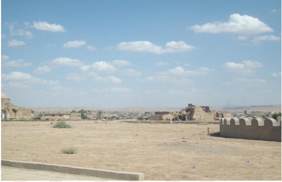
Figür 4: Kerkük Kalesi'nde yıkılan evler, Irak (2009)