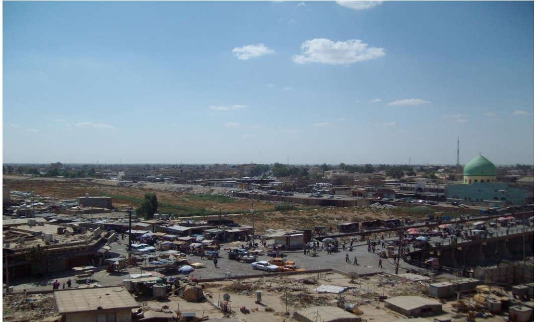
Figür 3: Kaleden Kerkük şehrinin görünümü, Irak (2009)