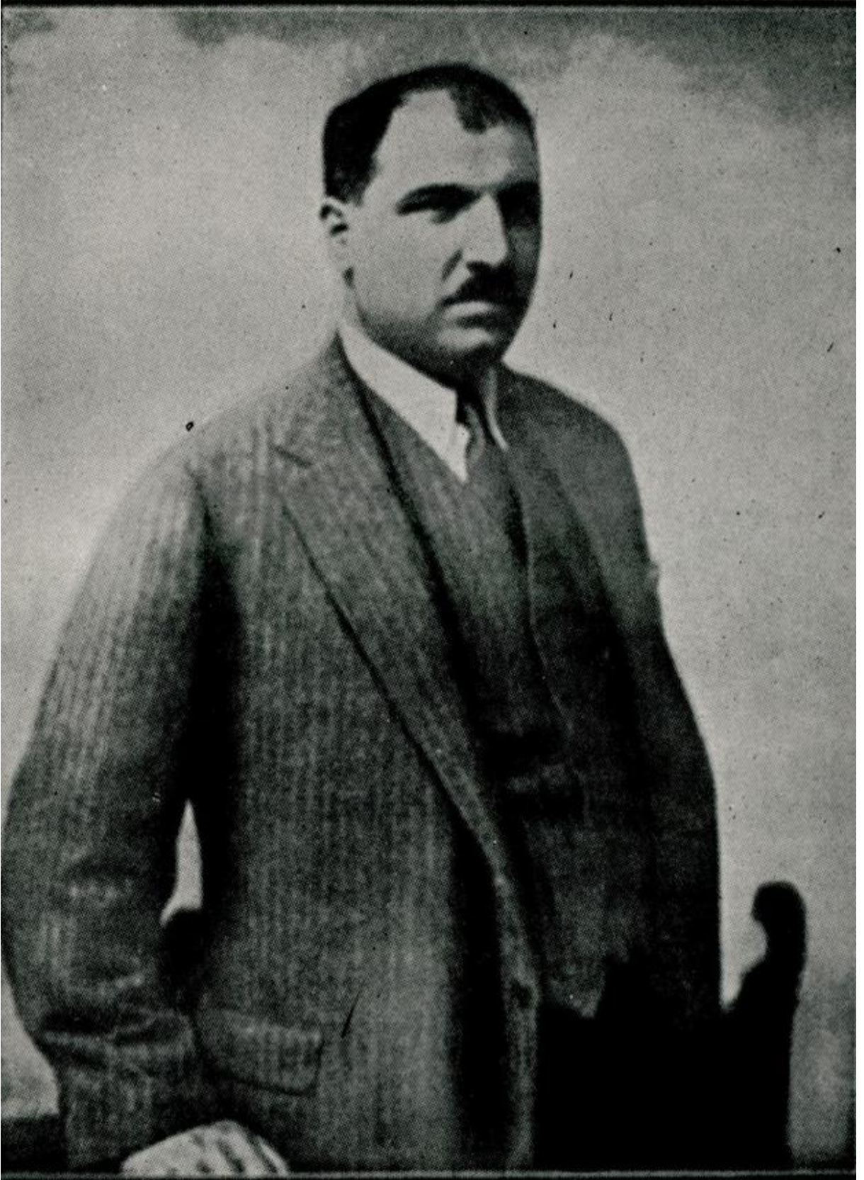
EK: 4: Mustafa Necati Bey (Maarif Vekâleti Mecmuası, Sayı: 17)