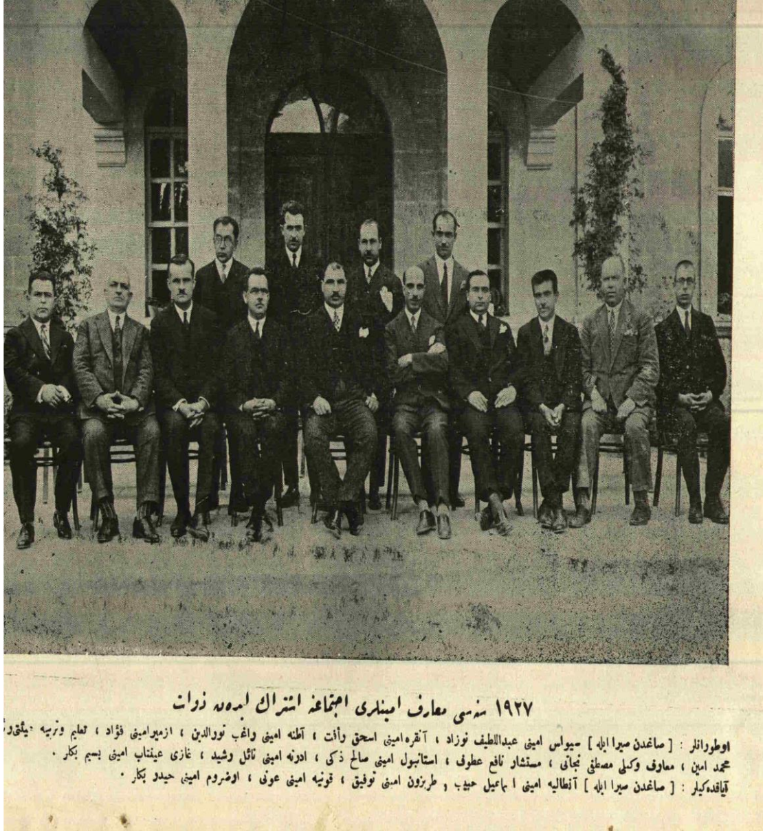
EK 3: 1927 Senesi Maarif Eminleri İçtimana İştirak Eden Zevat (Maarif Vekâleti Mecmuası, Sayı 12)