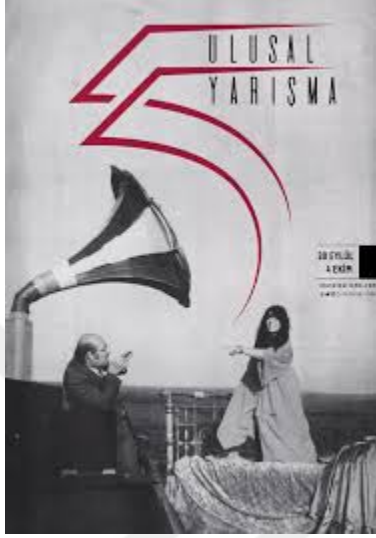
Şekil 6: 2. Yıl Ulusal Yarışma posterlerinden