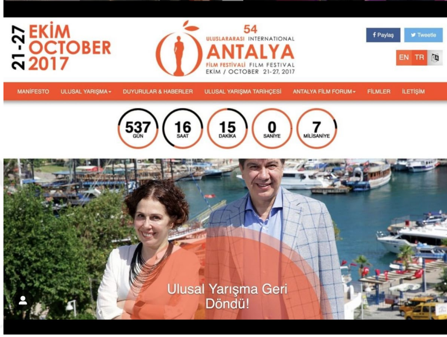
Şekil 2: Antalyaff.net sitesi (Kopya site)