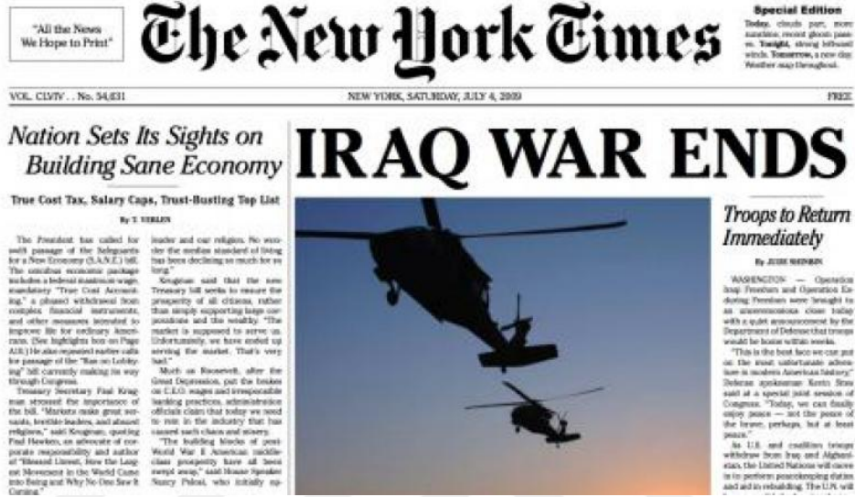
Şekil 3: Yes Man'ın The New York Times gazetesi sabotajı