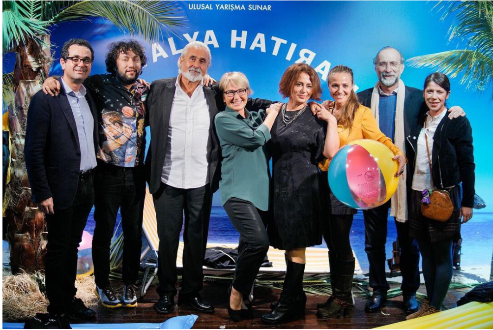
Şekil 4: Ulusal Yarışma'da Antalya Hatırası köşesi

Gezi Direnişi'nde çokça kullanılan yaratıcı sloganlara Ulusal Yarışma'nın Instagram ve Twitter hesaplarında da rastlıyoruz. Festivalin geçiciliğini ve aslen Antalya'ya dönme umudunu perçinlemek için kullanılan "Bir gün geri döneceğiz o şehre" sloganının yanı sıra Beyoğlu Sineması'nda film ekiplerinin fotoğraf çekimleri için tasarlanan Antalya Hatırası dekoru kullanıldı.