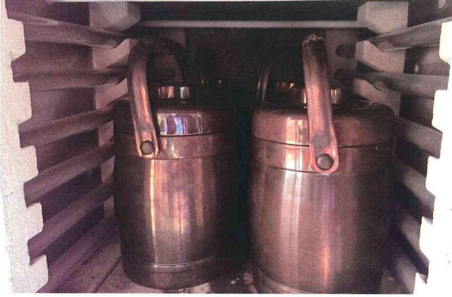
Şekil 3.3. Biyoçar üretimi için kullanılan sefer taslarının kıl fırını içerisindeki görüntüsü