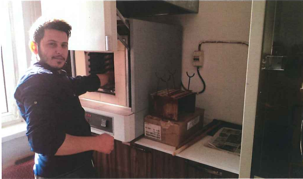
Şekil 3.2. Biyoçar üretimi için kullanılan kül fırını