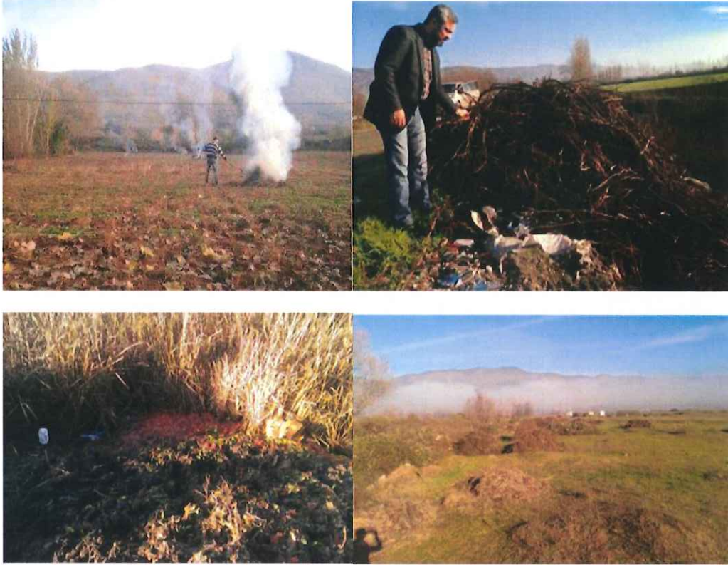
Şekil 2.1. Kazova'da 2014 yılı üretim sezonu sonunda çevreye çürümeye terk edilen tarımsal atıklar

Bu tez çalışmasında, temin edilen çok çeşitli tarımsal atıkların hammadde ve biyoçar olarak özellikleri belirlenmiştir. Bu ürünlerin çeşitli kullanımlara uygunlukları konusunda bir altlık olma özelliği olan çalışma sonuçları, yeni projelerin üretilmesi için önemli bilgiler sağlama potansiyeline sahiptir. Özellikle domates atıkları gibi bölgemizde önemli miktarda kirliliğe neden olan ve büyük miktarda var olan tarımsal atıkların çevreye dost ürünlere dönüştürülme potansiyeli nedeni ile çalışma sonunda elde edilecek çıktıların bölge ekonomisine önemli katkılar yapması beklenmektedir.