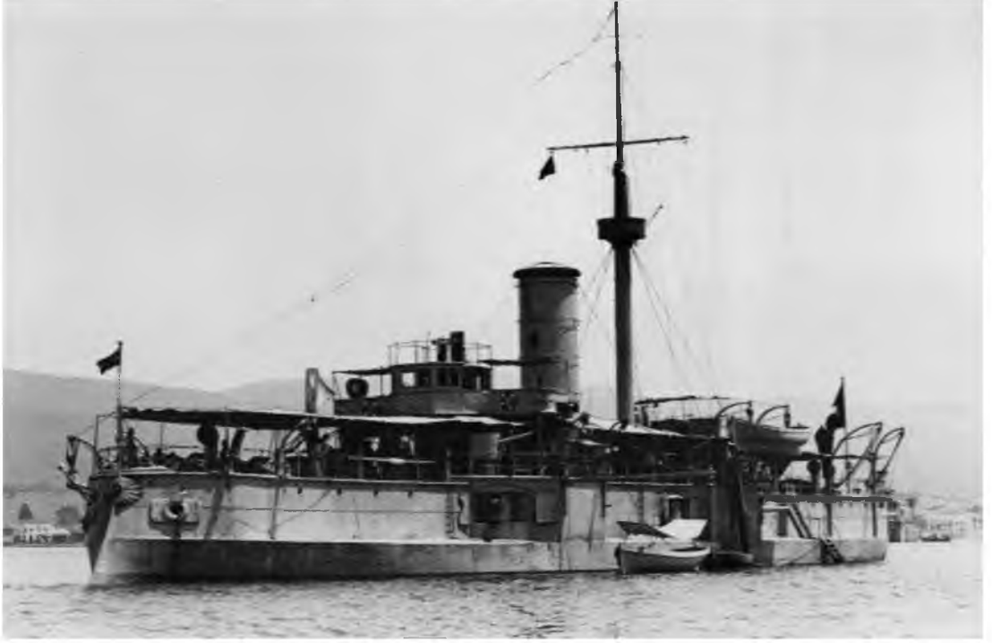
Muin-i Zafer Zırhlısı

( https://upload.wikimedia.org/wikipedia/commons/8/8e/Muin-i_Zafer.jpg )