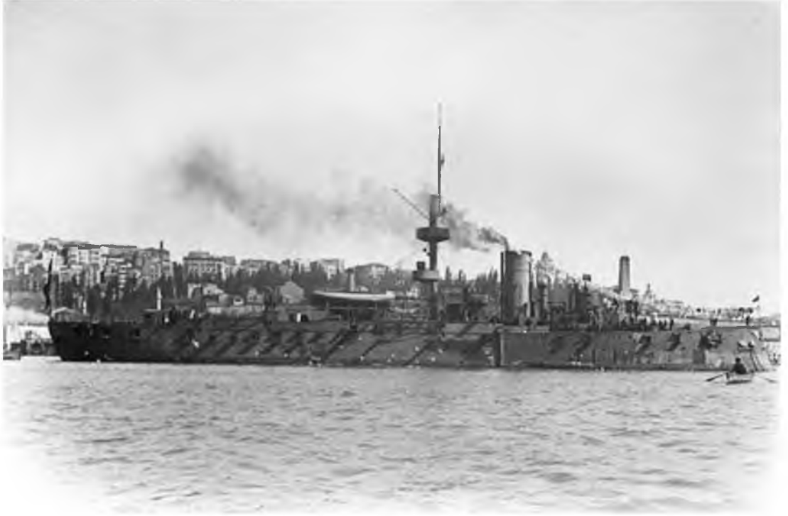
Asar-ı Tevfik Zırhlısı

( https://upload.wikimedia.org/wikipedia/commons/9/96/Asaritevfik.jpg )