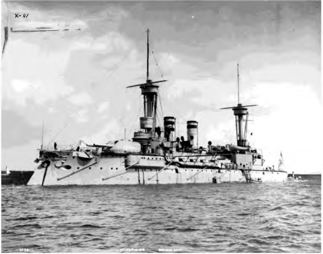
Turgut Reis Muharebe Gemisi

( https://upload.wikimedia.org/wikipedia/commons/8/83/SMS_Weissenburg_NH_88653.jpg )