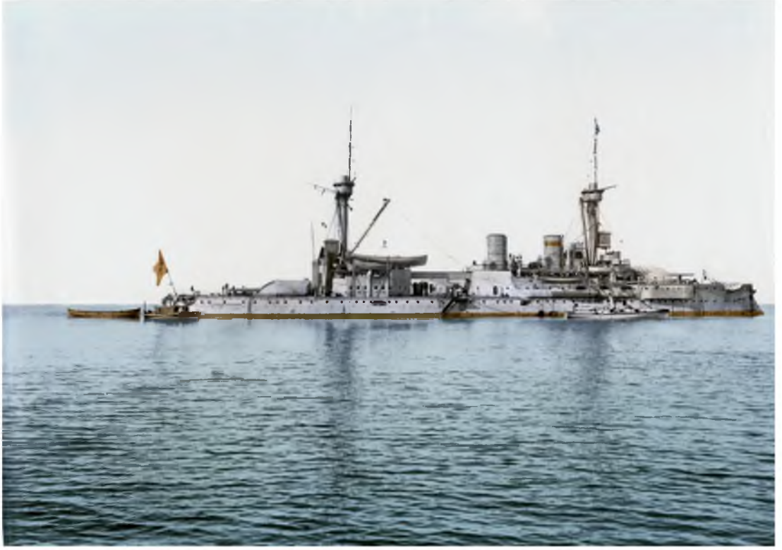
Barbaros Hayreddin Muharebe Gemisi

( https://upload.wikimedia.org/wikipedia/commons/1/10/SMS_Kurfuerst_Friedrich_Wilhelm_1900-2.jpg )