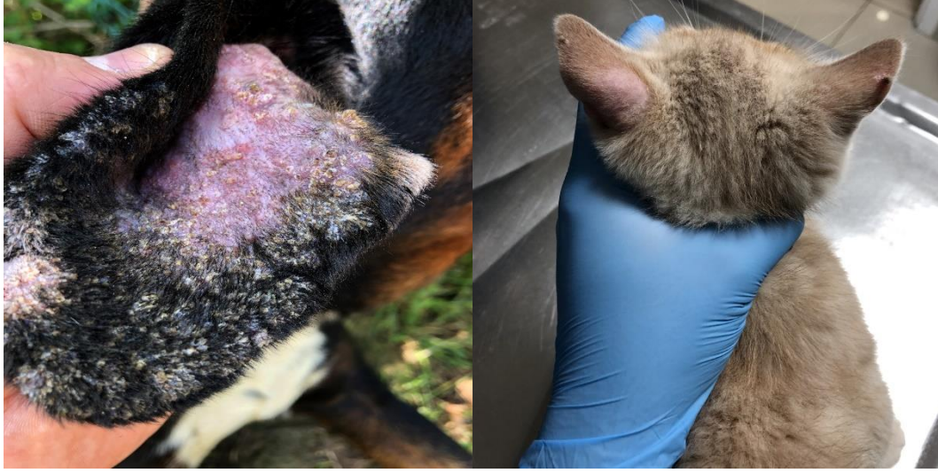
Şekil 3.6. Köpek ve kedide kulakta mantar

Thiabendazol ve ivermektin gibi antiparaziter ilaçlar, paraziter kulak enfeksiyonlarının tedavisinde etkili sonuçlar verebilmektedir. Glukokortikoidler, malassezia kaynaklı mantar ve mayaların üremelerini önlemek ve yangıyı azaltmak amacıyla kullanılmaktadır. Amikasin, polmiksin B, enroflaxsinin, tikarsilin ve colsitin sülfat pseudomonas kaynaklı otitislerin tedavisinde başarılı sonuçlar verebilmektedir. İleri derece alerjik enfeksiyonlarda %60'lık DMSO ve %0,01'lik fluocinolon kullanımı yangıyı dindirirken, aynı zamanda %4'lük tiabendazol, %0,1'lik deksametazon ve %0,32'lik neomisin kullanımı da etkili olabilmektedir [37].