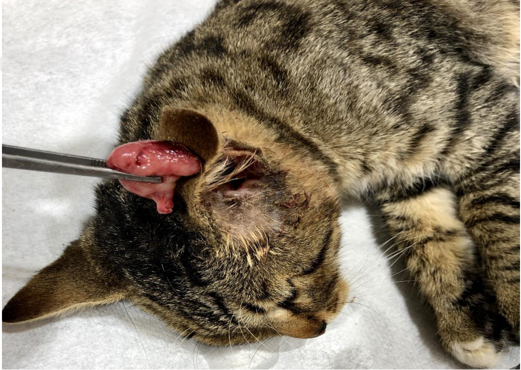
Şekil 3.4. Bir kedide kulak kanalından çıkarılan polip

Polipin konumuna baęlı olarak deęişkenlik gösteren klinik belirtiler tipik olarak aural akıntı, nazal akıntı, başın eğikliği, aksırma, disfonya, hırıltılı nefes alma, rinitis, nistagmus, üst solunum yolu tıkanıklıkları ve ataksi olarak gözlenebilmektedir [36]. Bulla timpanika içerisinde yerleşen poliplerde çoęunlukla otitis media bulguları gözlenmektedir. İçerisinde kan ve mukus bulunan polipler, beyaz ya da kırmızı renkli olup, saplıdırlar [26].