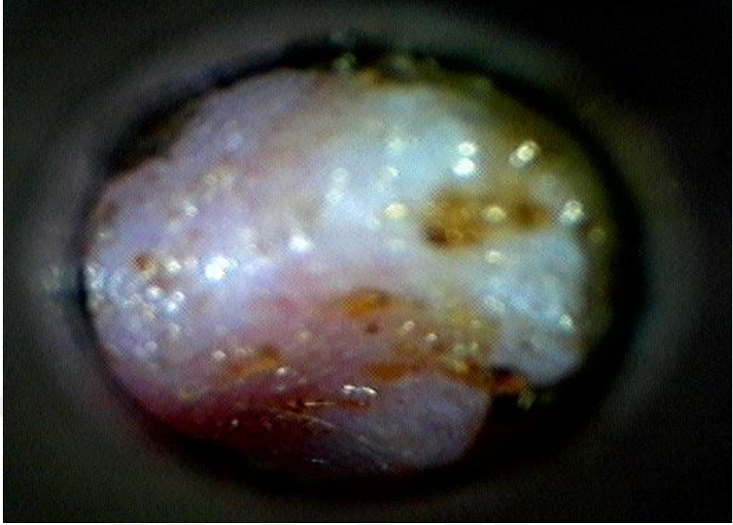
Şekil 3.2. Video otoskop ile muayene

Köpeklerde pars flakside ve pars tensada olmak üzere iki kısımdan oluşan kulak zarı otoskopi ile incelendiğinde büyük bir kısmının pars tensadan oluştuğu görülür. Şeffaf çizgilere sahip olan pars tensa, malleusu ve manubriumu dışı doğru olup beyazımsı bir bölge olarak görülmektedir. Timpanik bulla ve timpanik kemik bu beyazımsı bölgenin bitiminde bulunmaktadır [19]. Kulak zarı kedilerde ortalama 42 mm 2 'lik bir alana sahipken köpeklerde 46 mm 2 'lik bir alana sahiptir [20]. Kulak zarının dış yüzeyindeki sinirler n. vagus'tan gelirken iç yüzeyindeki sinirler ise pleksus timpanikus'tan gelir [21]. Kulak zarı, kulak kanalındaki basıncı artıran kaza ya da darbeler, şiddetli patlamalar, kulak kemiği kırıkları, delici ve batıcı cisimlerin kulağa girmesi, aşırı sıcak ya da asitli sıvıların kulak kanalına kaçması ve yabancı cisimlerin kulak kanalına kaçması sonucunda perfore olabilmektedir.