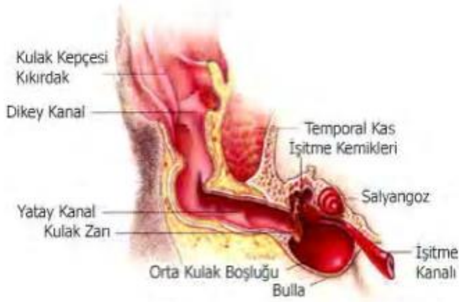
Şekil 3.1. Kulağın anatomik yapısı [1]

Dış dünyadaki ses dalgalarının oluşturdukları titreşimleri dönüştürerek beyne ileten kulak işitme ve denge olaylarını gerçekleştiren duyu organıdır [6]. Diğer duyu organlarıyla organize bir şekilde çalışan kulak, dış dünyada gerçekleşen birtakım olaylara karşı organizmanın tepkilerinin ortaya çıkmasında etkili rol oynamaktadır [7].